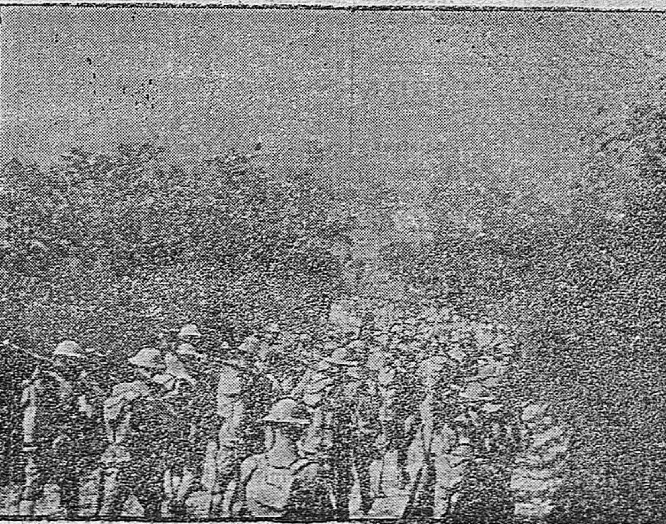
TROPAS AMERICANAS EN FRANCIA