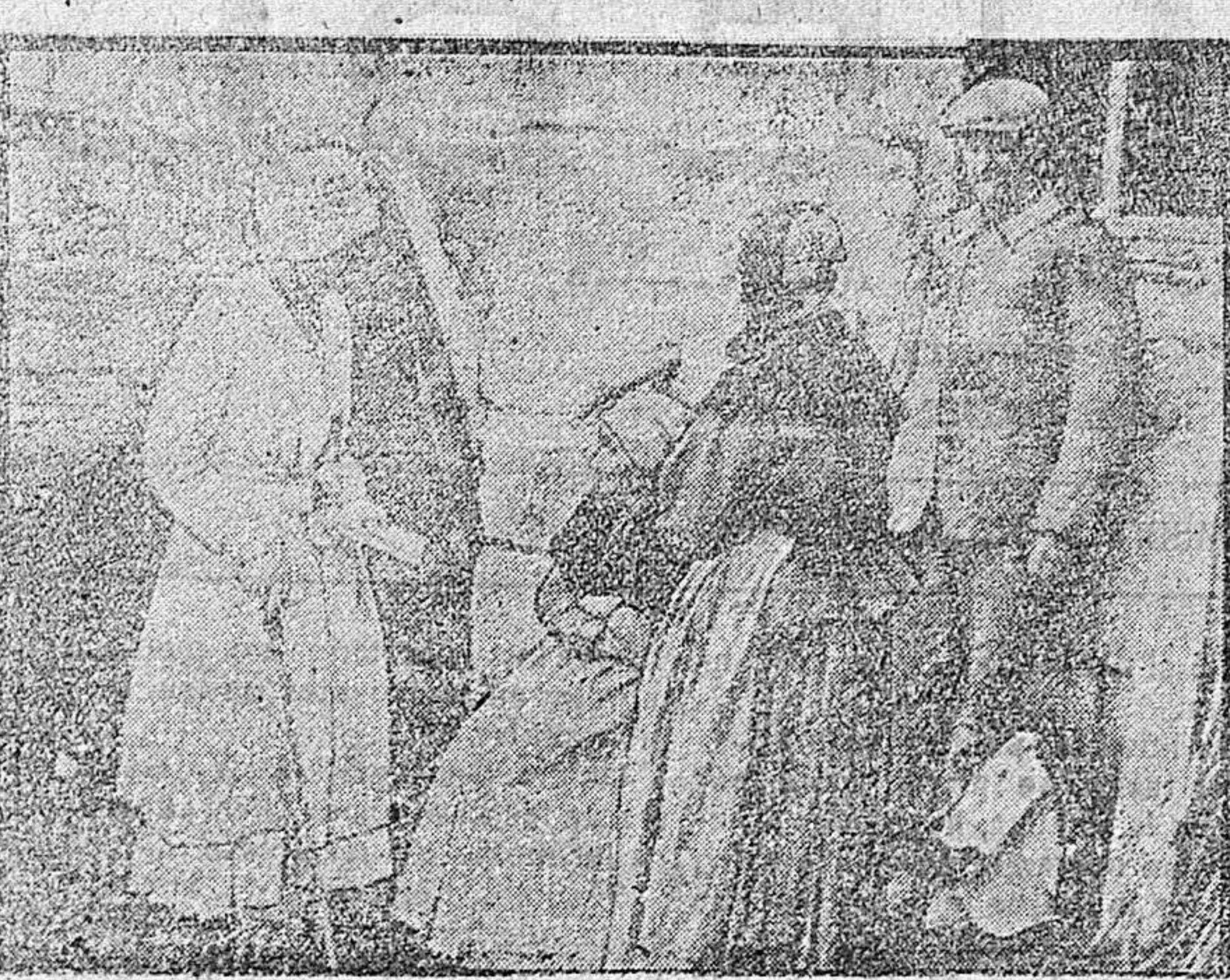
DAMA DEL COMITÉ AMERICANO VISITANDO UN PUEBLO RECONQUISTADO A LOS ALEMANES

Y a propósito de amnistía. Esta palabra significa olvido y no perdón. Y para restablecer eso que llama la paz de los espíritus lo que hace falta no es ni olvido ni