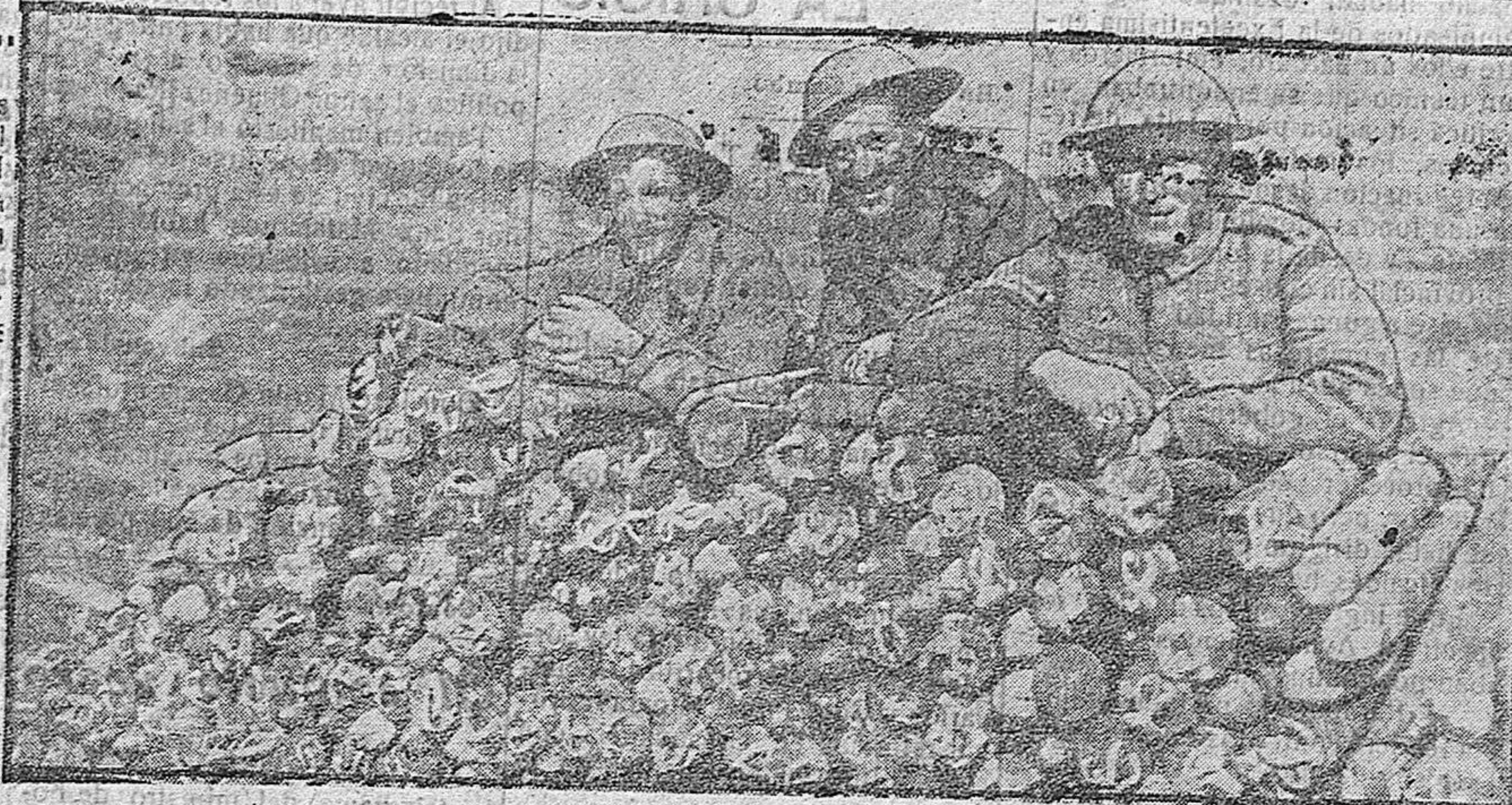
ARTILLEROS Y MUNICIONES INGLES