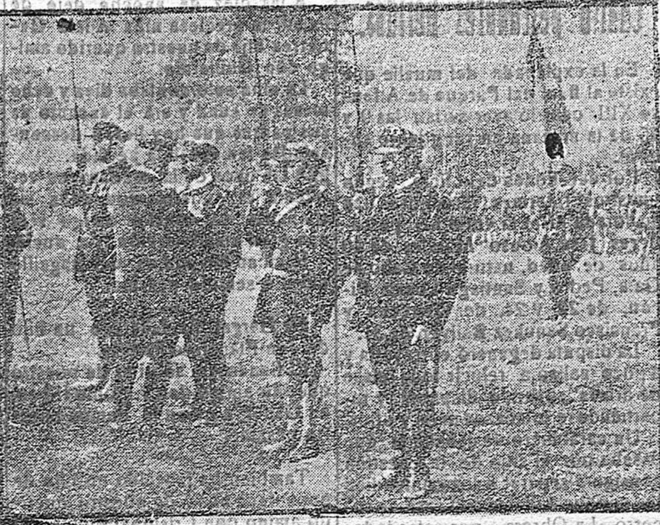
EL ALMIRANTE ROMARD REVISTA LOS FUSILERS MARINOS

No vamos a cejar en esta campaña; queremos que en todas estas sombras reine la luz del sol; que de todas estas cloacas, desaparezca la fetidez, que los ciudadanos puedan