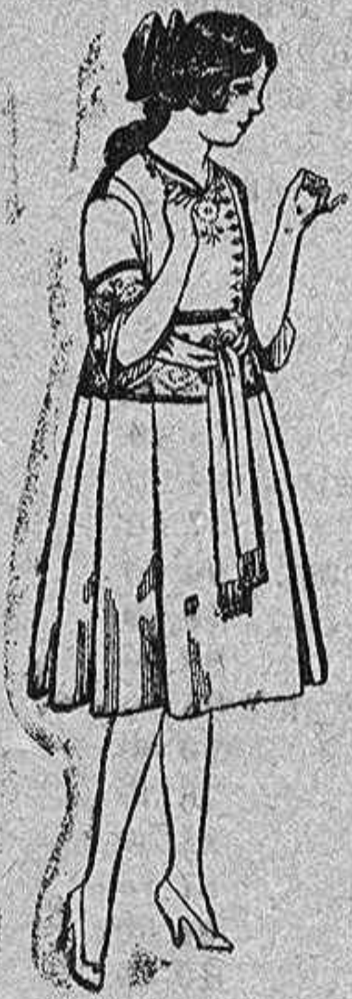
Vestidos de sarga inglesa azul bordados, para las niñas de 12 a 15 de pts. 42 a 46.