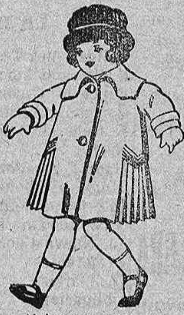
Abrigos de pañete, gamuza, etc. para niñas de 4 a 9 años. de pts. 24 a 36.