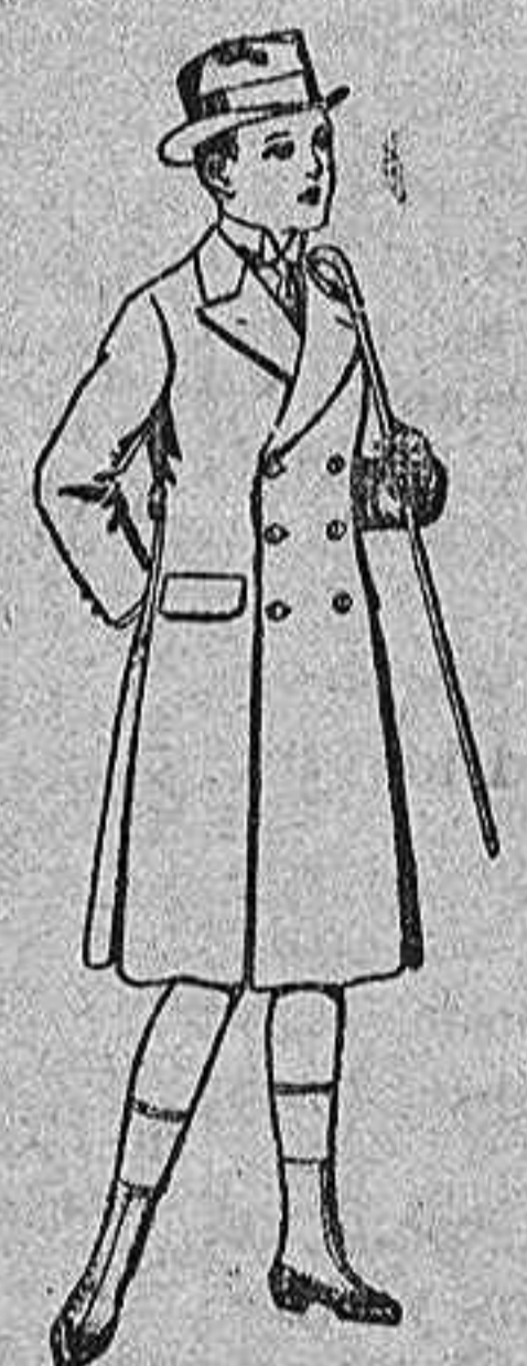
Gabanes de patén, para niños de 4 a 9 años. de pts. 16 a 50.