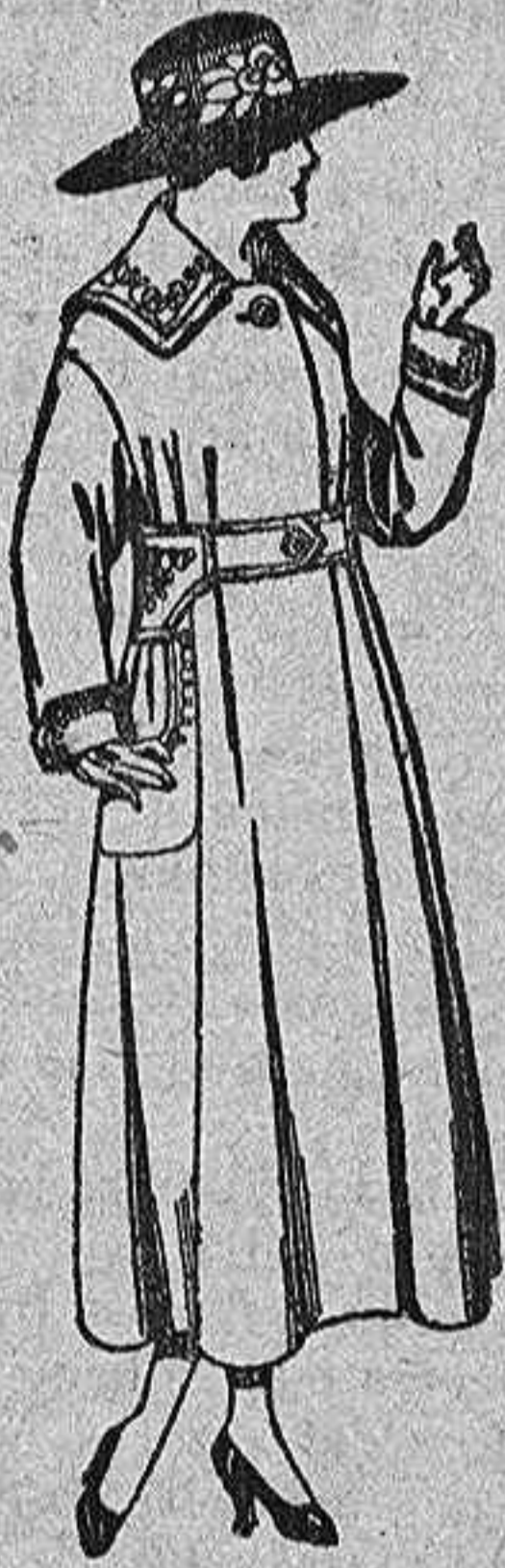
Abrigos de zaba dina, pañete, etc. en azul y color, bordados. de pts. 75 a 84.