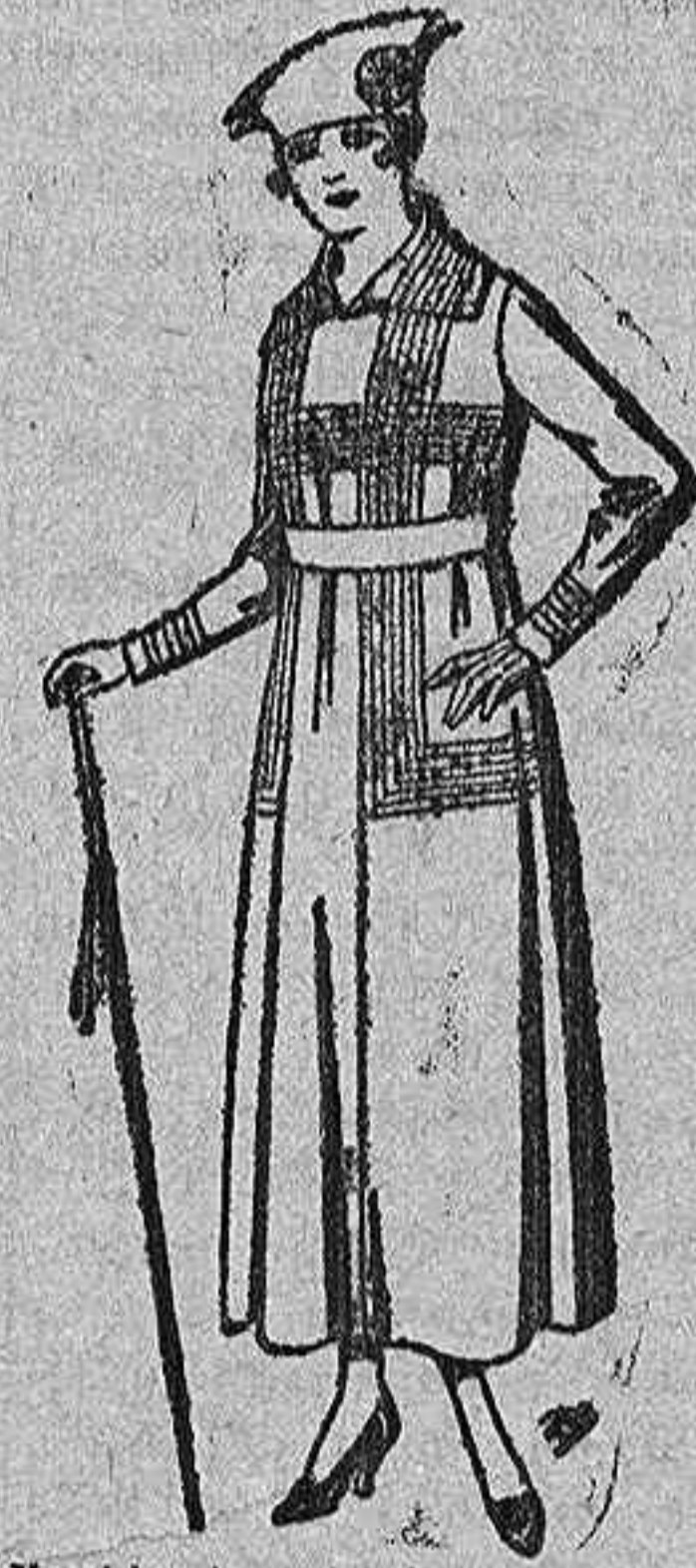
Vestidos de gabardina, satambre, en negro, azul y color, bordados. de pts. 60 a 65.