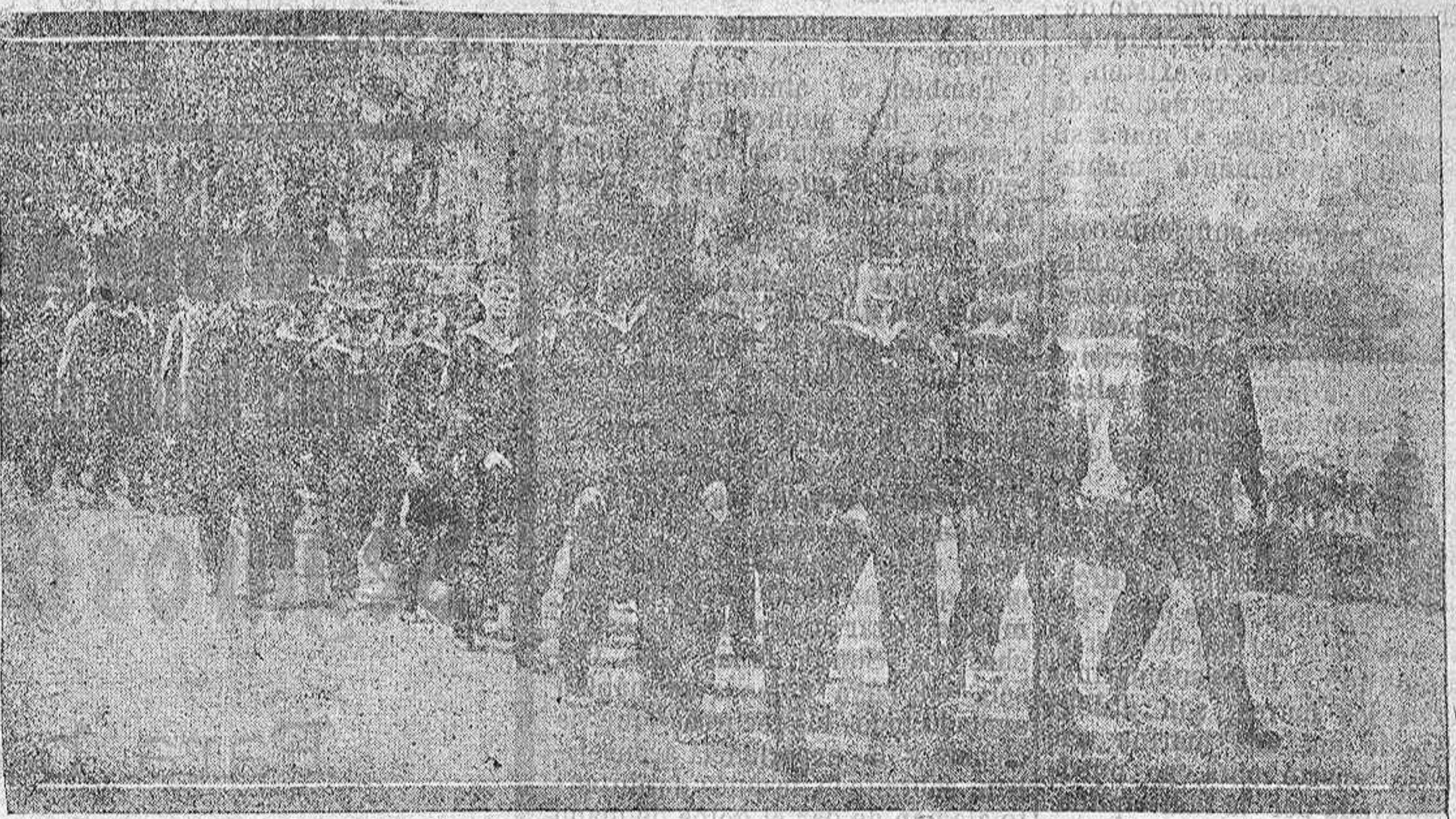
Reclutas de la Marina alemana recientemente incorporados.