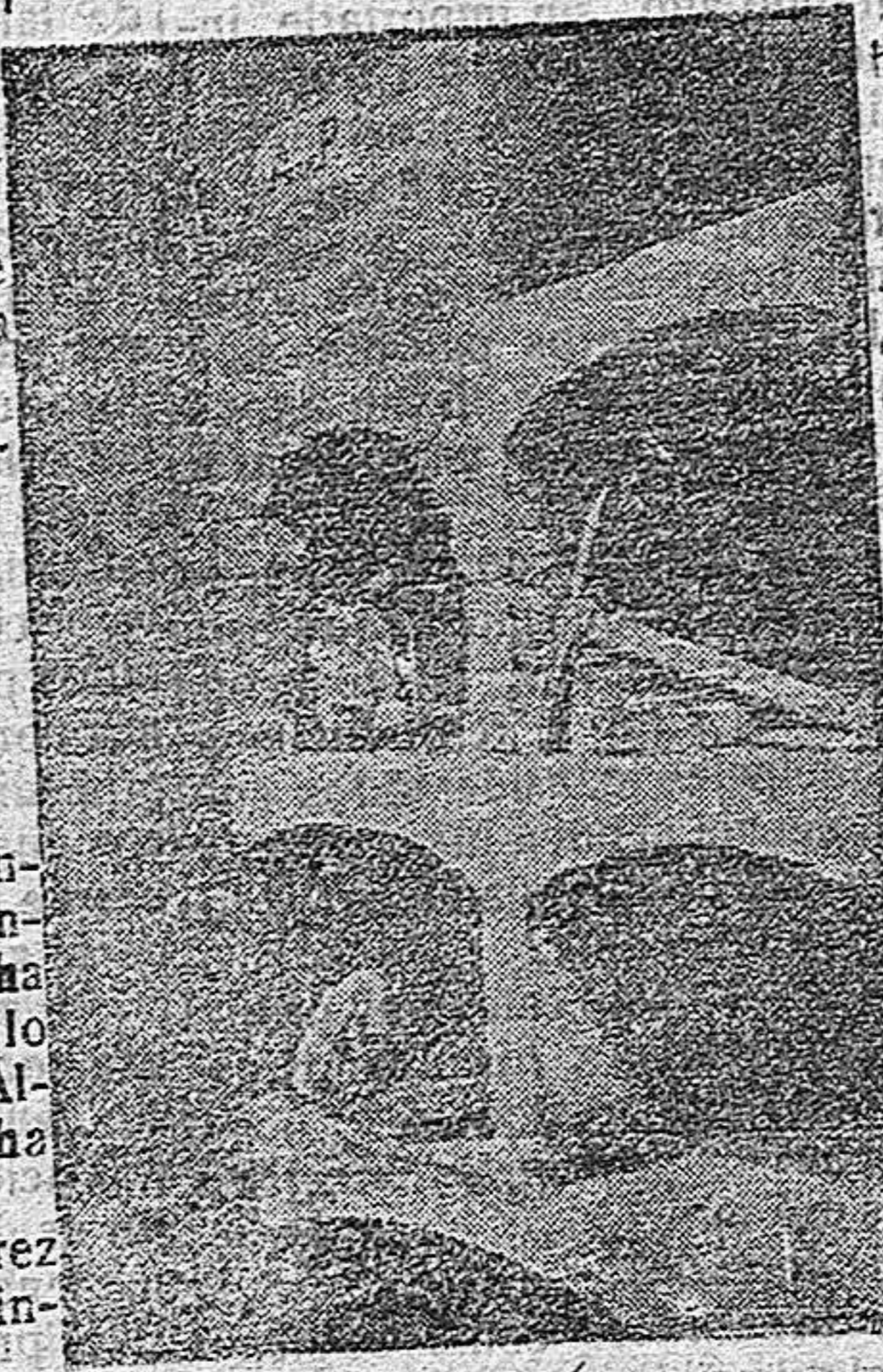
Nichos profanados por los alemanes