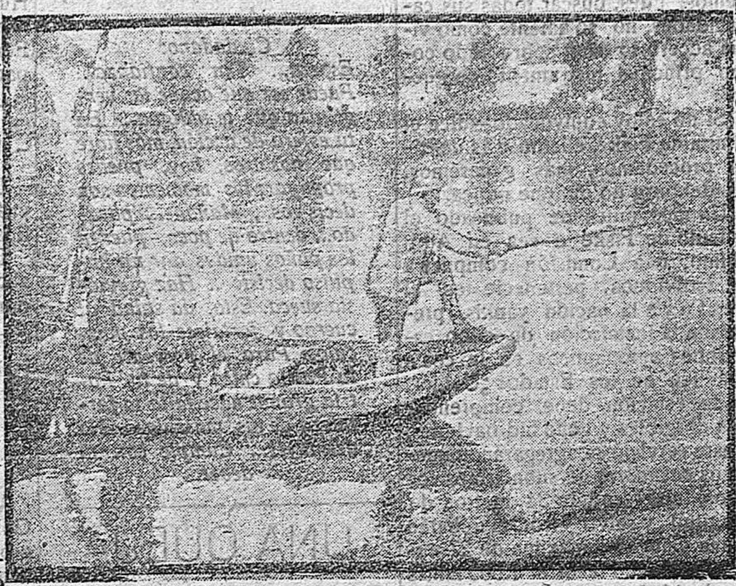
SOLDADOS FRANCESES PESCANDO

Por eso nosotros esperamos que sea larga la vida de nuestro Gobierno. Que gobierne el tiempo suficiente para que la censura haga su labor Patriótica; para que el ejército vea cual es su deber y lo cumpla; para que acaben de llegar todas las cosas a su meta; para que acaben de convencerse los que esperaban el bien desde arriba. En fin, para que la labor del Gobierno, sea lo fructifera que debe ser para España.