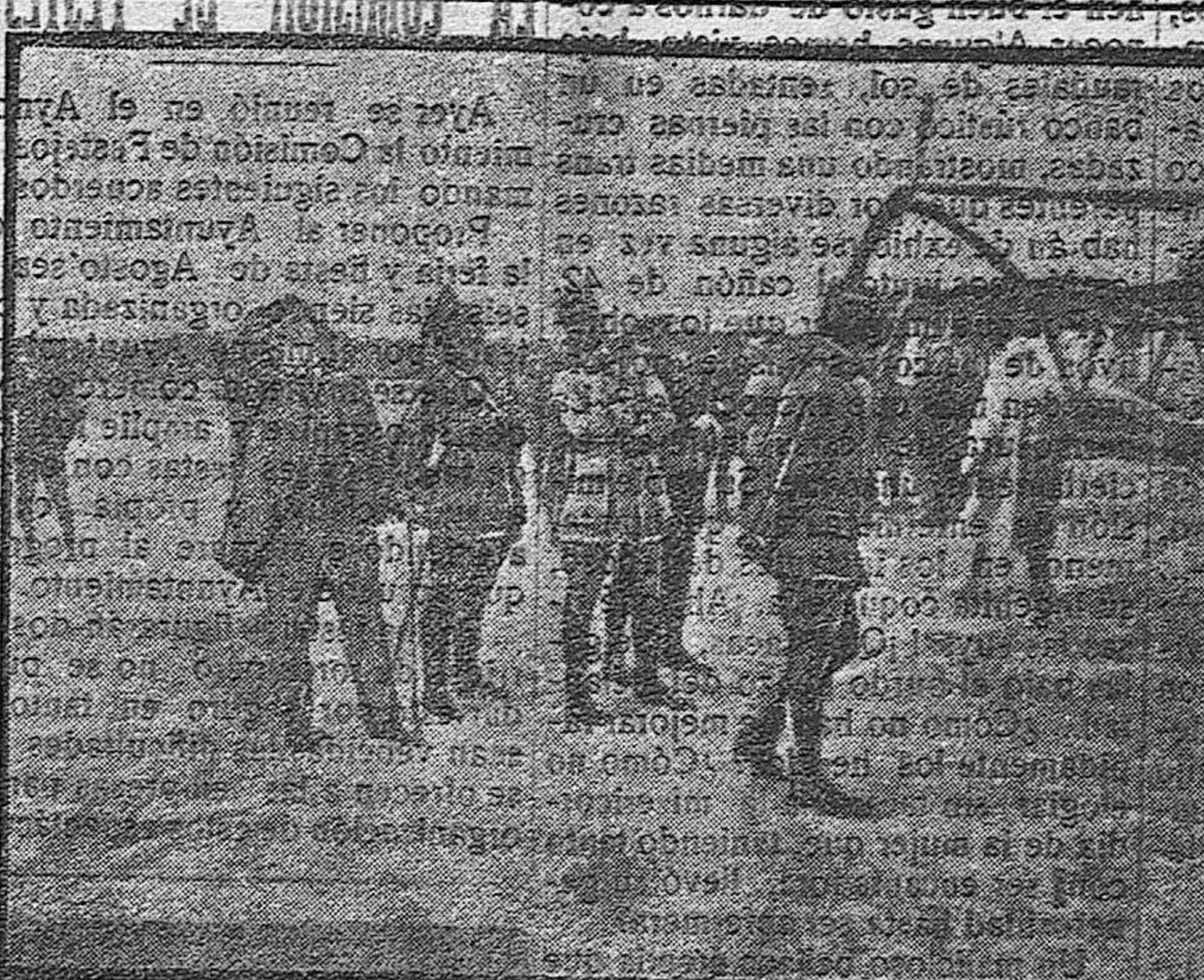
OFICIALES Y PERIODISTAS AMERICANOS VISITANDO UN CAMPO DE AVIACIÓN CERCA DEL FRENTE FRANCÉS

Somos así, nos defendemos y defendemos a los demás. Creemos que no nos tratarán de crueles, por eso, de que del arbol caído, no debe hacerse leña, y que cuando esto, porque entendemos que el adagio se refiere a ciertos