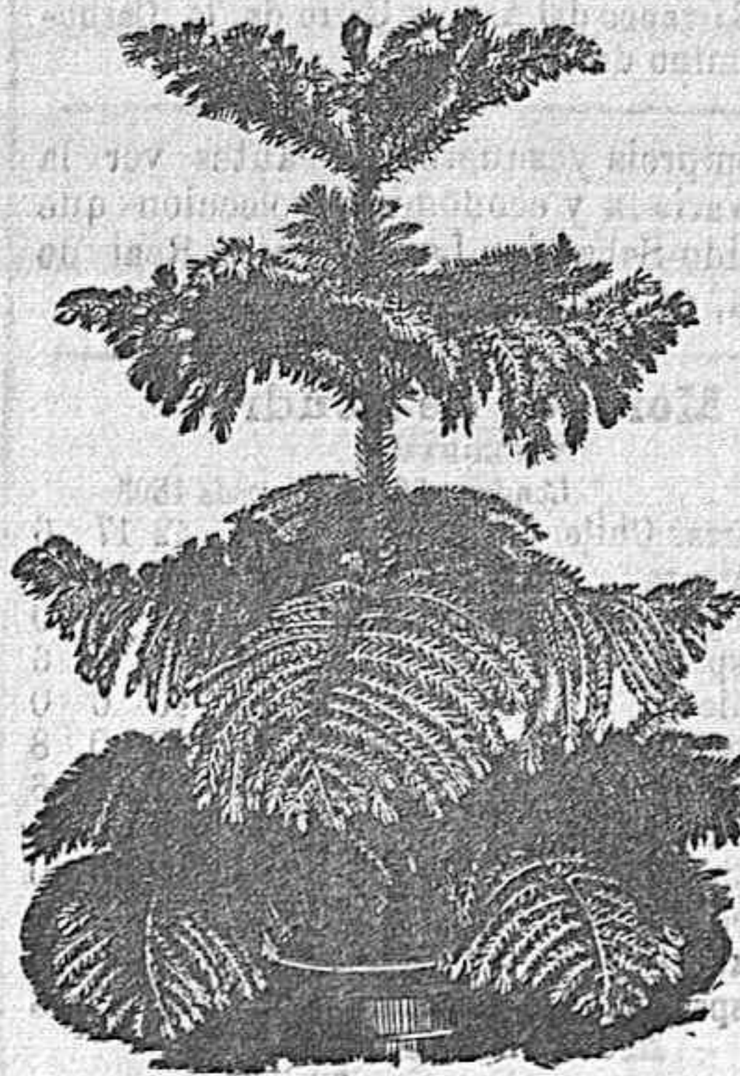
Arboles, plantas, semillas y flores de todas clases.

Adorno con plantas y flores de salones, comedores, balcones, etc.