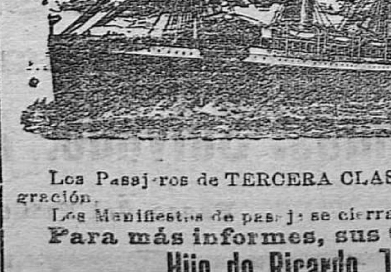
Los Pasajeros de TERCERA CLASE mandarán con bastante anticipación los documentos que ordena la vigente Ley de Emigración.