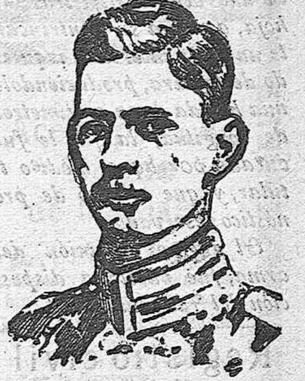
El príncipe Carlos de Rumania, que en breve contraerá matrimonio con la princesa Elena hija del Rey Constantino de Grecia.

Hay «cosas» que es muy peligroso vayan a poder de los rateros si tienen apetito y buenos dientes.