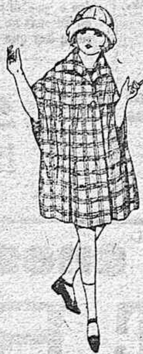
Capas de pañete, cheviot, etc., diferentes colores y dibujos, para niñas de 4 a 9 años de ptas. 25 a 58