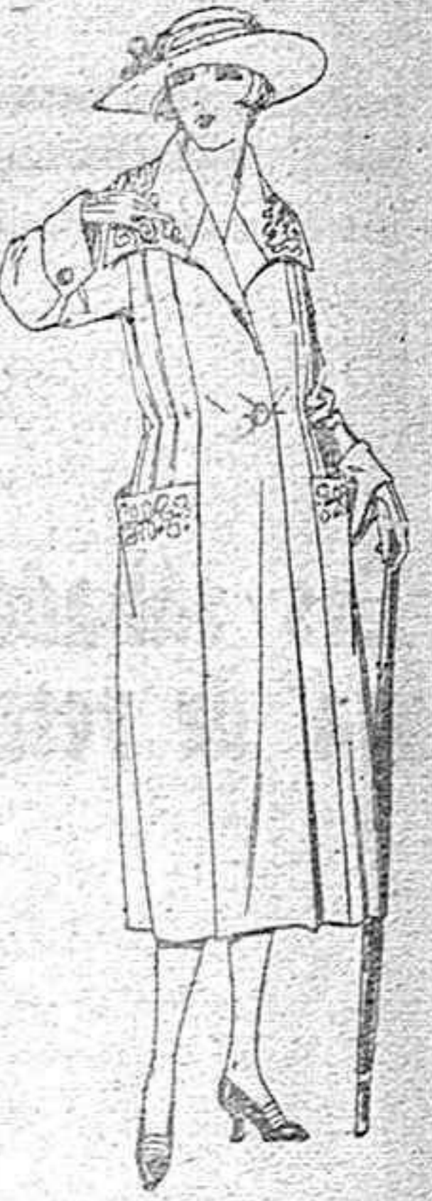
Abrigos de pañete, gomuza, etc., en azul y color, adornos bordados de ptas. 70 a 120