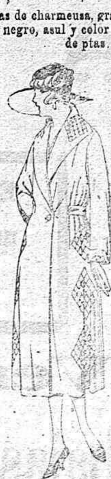
Abrigos de gamuza, ratina, etc., en negro, azul y color, adornos pes pantes seda de ptas. 65 a 110