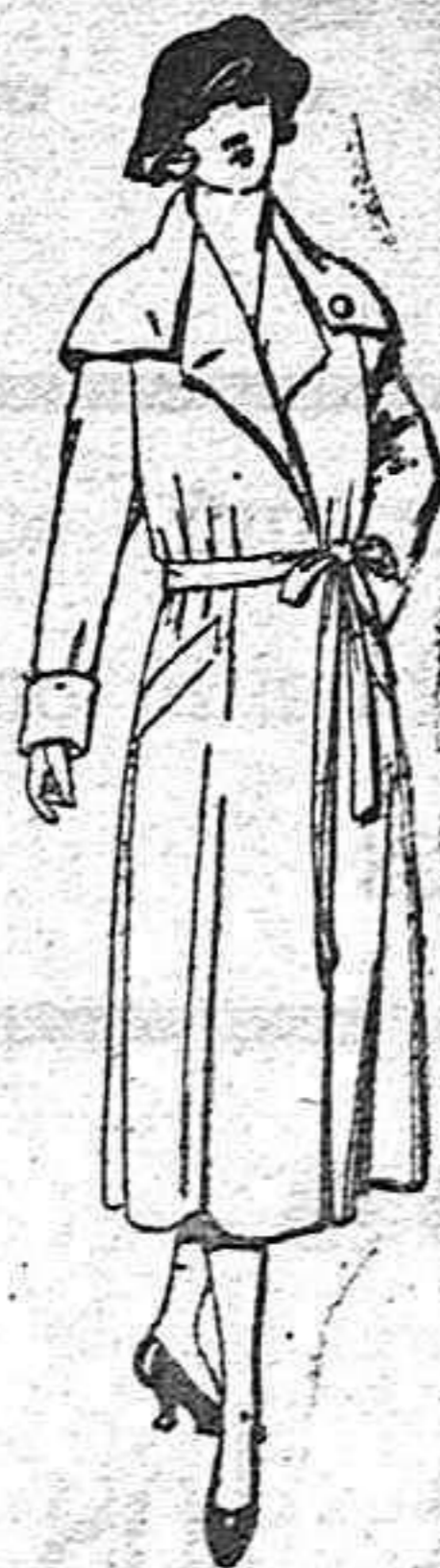
Abrigos de seda impermeables de ptas. 130 a 225