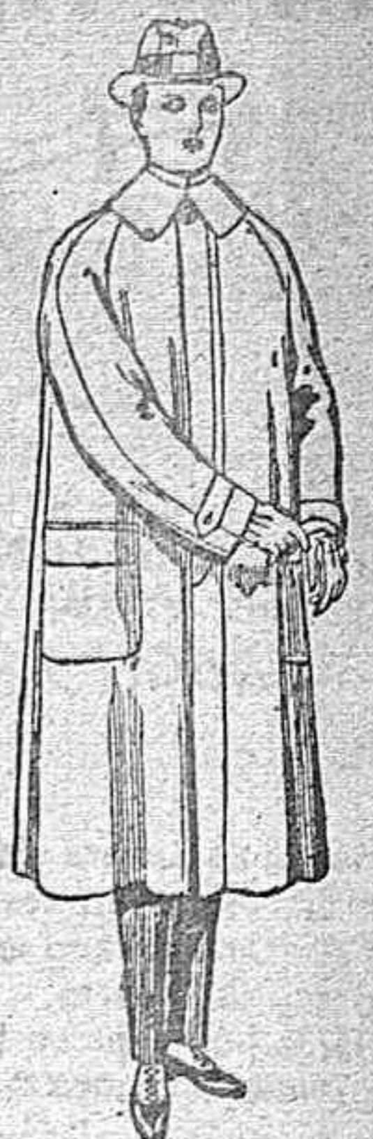
Impermeables reglan, en azul y colores de ptas. 40 a 170