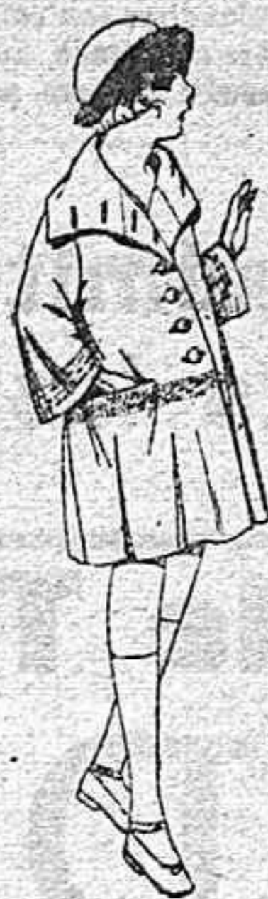
Abrigos de gamuza, ratina, etc., en azul y color, para niñas de 4 a 12 años de ptas. 55 a 60