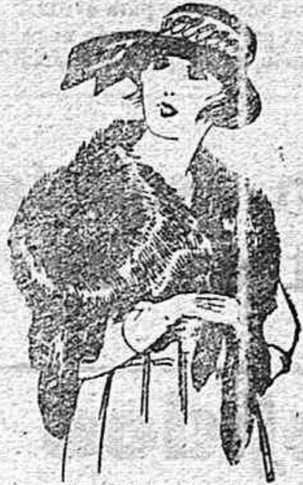
Cuello piel Renardina, en blanco, marrón, gris y negro de ptas. 18 a 40