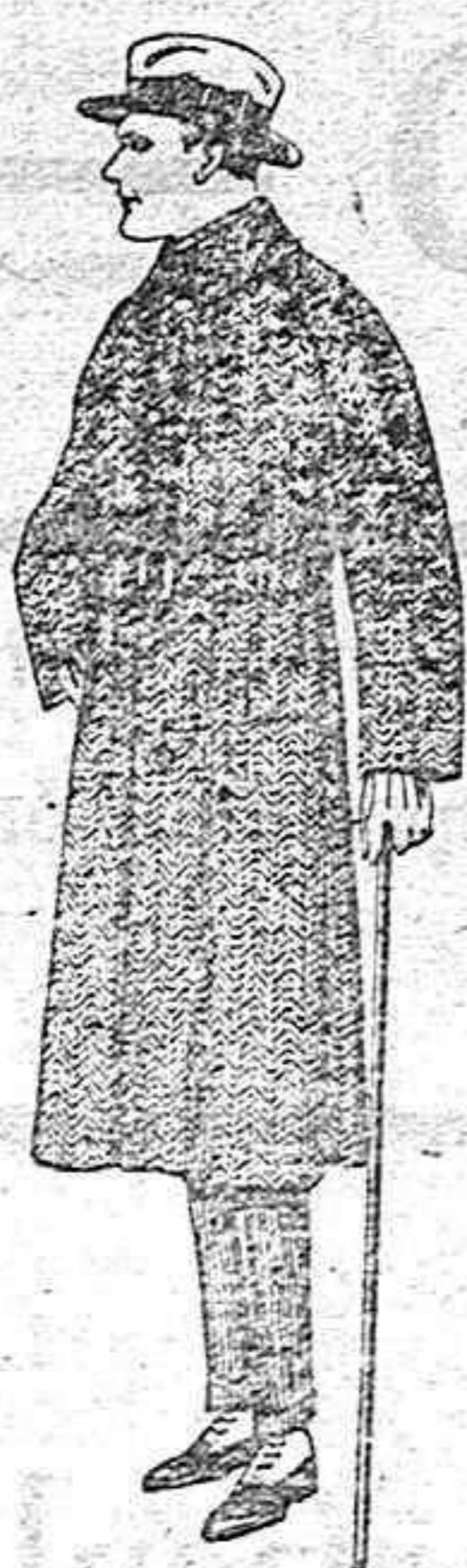
Gabanes de patén, cheviot o cover de ptas. 55 a 160