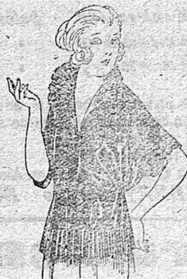
Blusas de charmeus, granadina etc., en negro, azul y color de ptas. 80 a 55