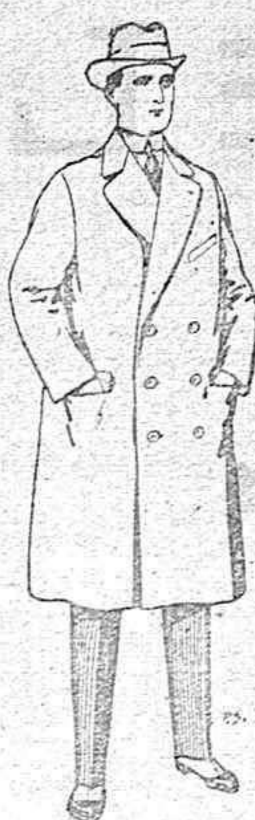
Gabanes de patén, gamuza o cover de ptas. 60 a 200