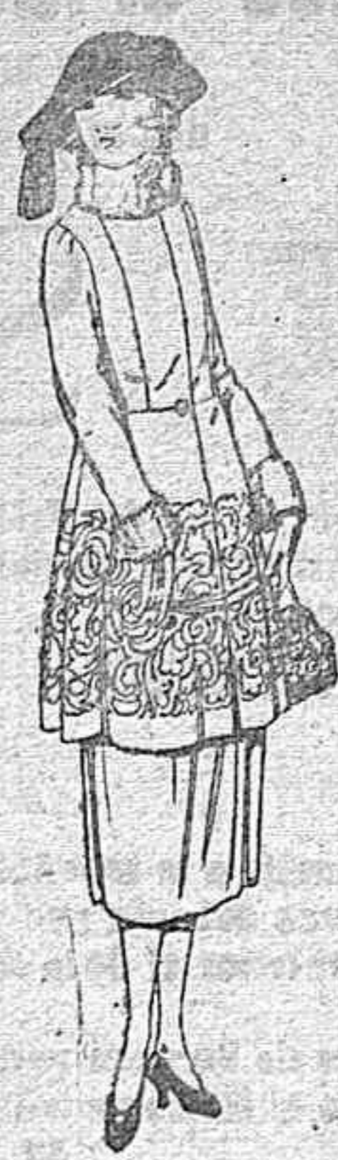
Trajes de gamuza, adornos bordados y con piel, en negro, azul y color de ptas. 180 a 220