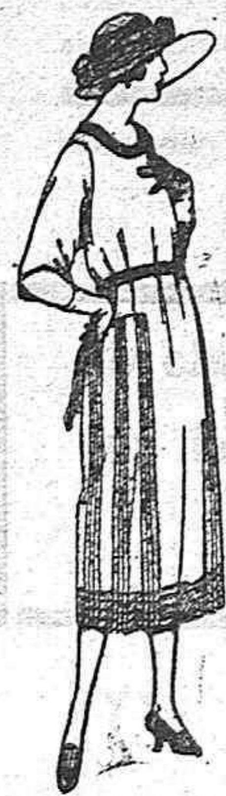
Vestidos de estambre tricotina, gabardina, etc., en negro, azul y color, adornos bordados de ptas. 110 a 150