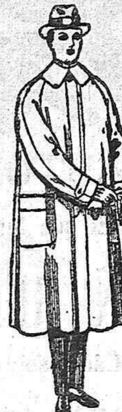
Gabanes de patén, gamuza o cover. de ptas. 60 a 200