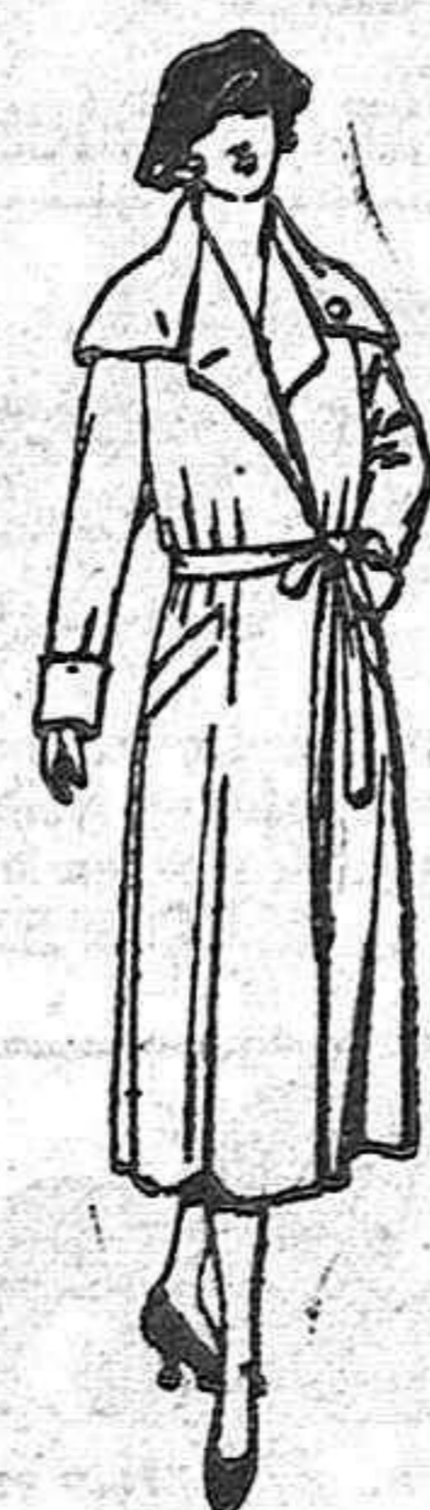
Abrigos de seda impermeables. de ptas. 180 a 225