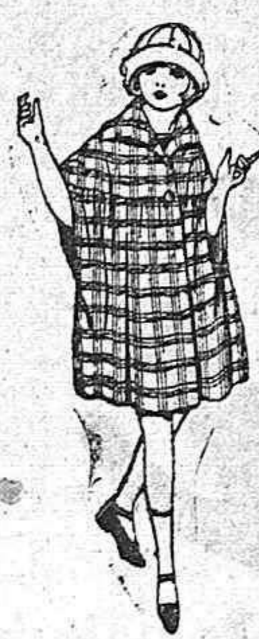
Capas de pufete, cheviot, etc., diferen es colores y dibujos, para niñas de 4 a 9 años. de ptas. 25 a 58