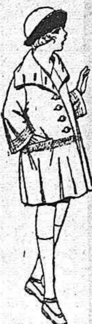
Abrigos de gamuza, ratina, etc., en azul y color, para niñas de 4 a 12 años. de ptas. 85 a 60