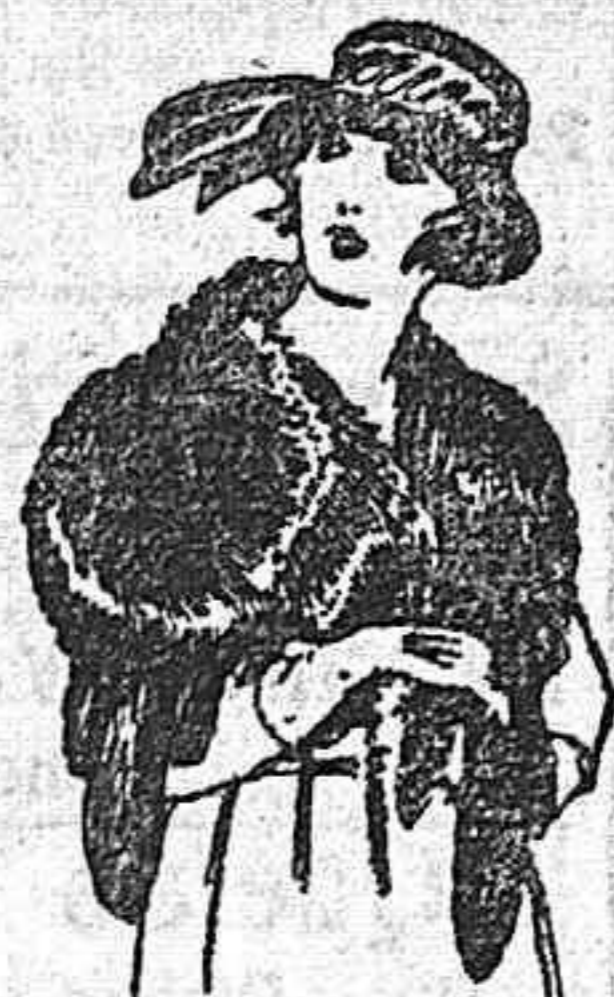
Cuello piel Bernardina, en blanco, gris y negro. de ptas. 18 a 40