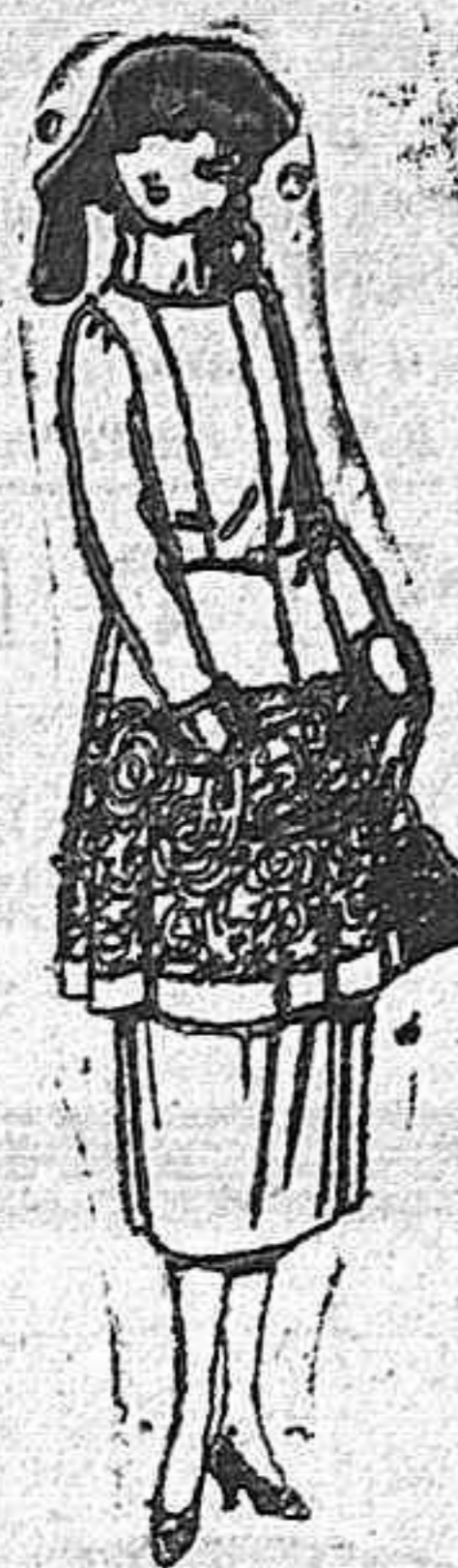
Trajes de gamuza, adornos bordados, con piel, en negro, azul y color. de ptas. 180 a 230