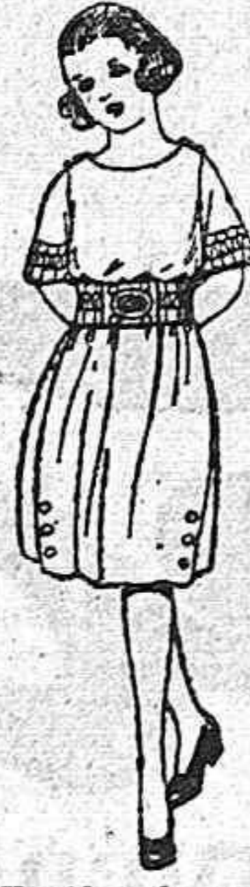
Vestidos de sarga inglesa, lanilla, etc. en azul y color, adornos bordados, para niñas de 4 a 9 años. de ptas. 35 a 48