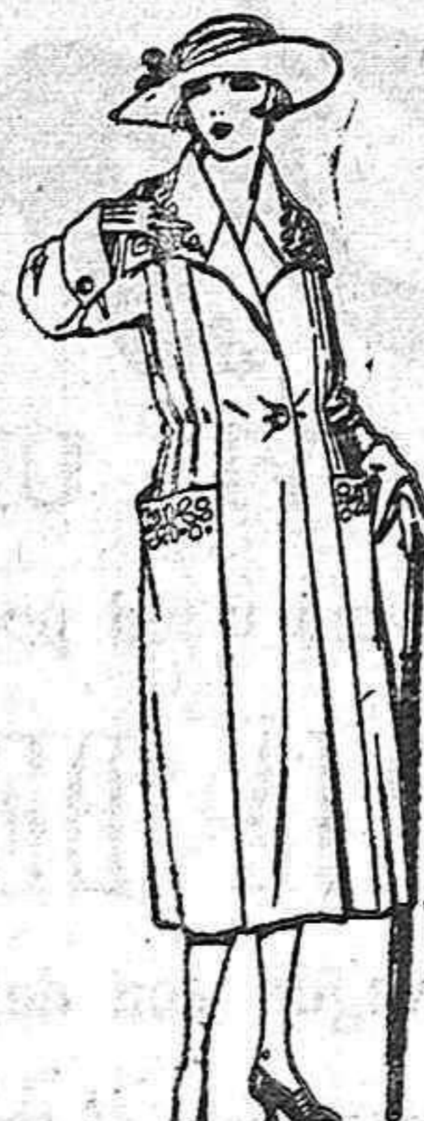
Abrigos de gamuza, ratina, etc. en negro, azul y color, adornos, pespunte seda. de ptas. 65 a 110