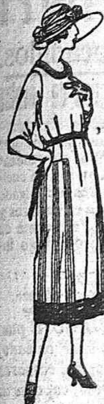
Vestidos de estambre, tricetina, gabardina, etc. en negro, azul y color, adornos bordados. de ptas. 110 a 150