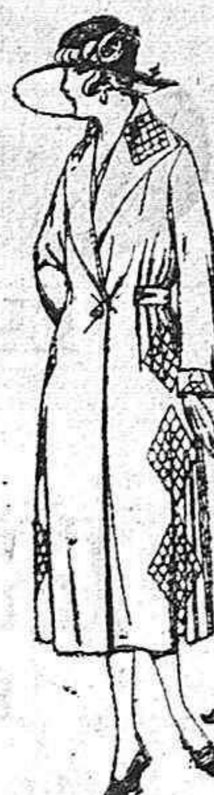
Abrigos de pañete, gamuza, etc., en azul y color, adornos bordados. de ptas. 70 a 130