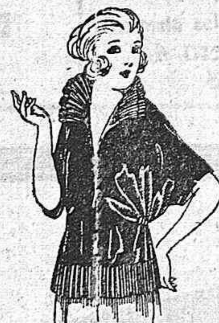
Busas de charmeus, granadina, en negro, azul y color. de ptas. 30 a 45