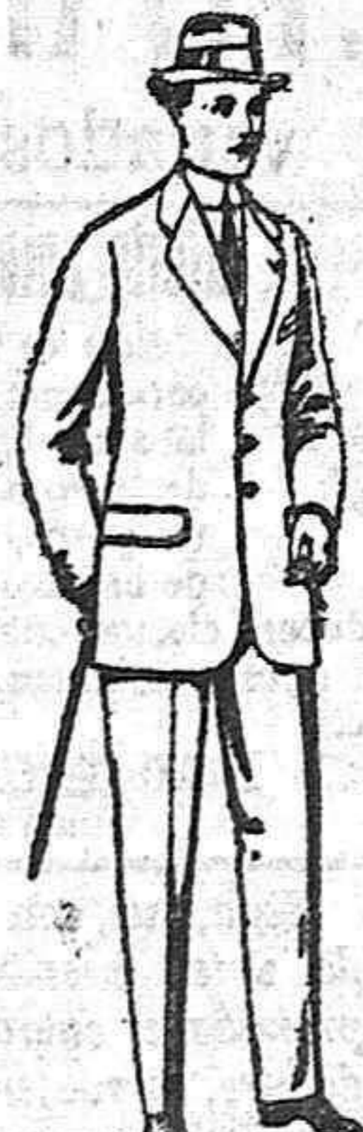
Gabanes de oatán, cheviot cover. de ptas. 80 a 160