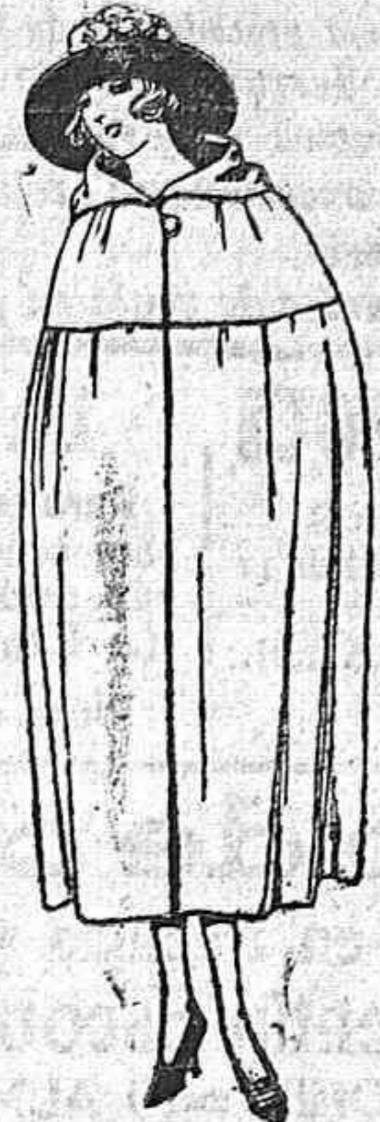
Capas de gabardina, terciopelo de lana, etc. diferentes colores. de ptas. 100 a 160