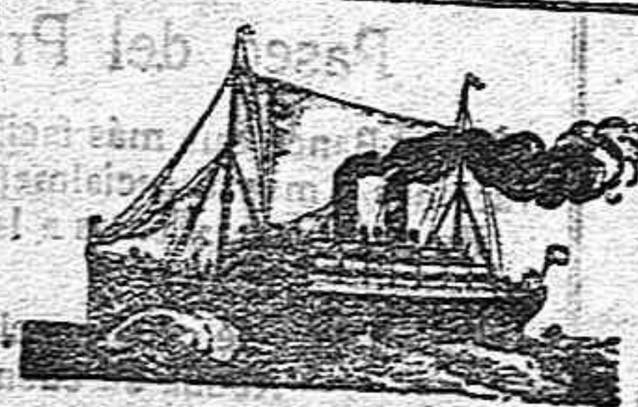
El magnífico y acreditado vapor «CRETIC» de la White Star Line, llegará a este puerto el primer día de Octubre.

Para comer por poco dinero y para cenas económicas, como en «La Campana». Plaza del Carmen núm. 3.