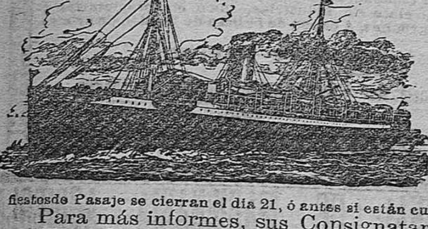
Acabando Pasaje se cierran el día 21, ó antes si están cubiertas las plazas asignadas á este puerto. Para más informes, sus Consignatarios, Hijo de Ricardo Jiménez, S. en C. Boulevard del Príncipe, 73 y 75.—ALMERIA

Saldrá de Almería el 22 de Febrero de 1912, y admitirá pasaje en Cámara de PRIMERA, SEGUNDA, SEGUNDA ECONOMICA y TERCERA CLASE, haciendo breve escala en DAKAR (Costa de Africa) para abastecerse de carbón y agua, siendo la duración probable del viaje de 13 días.