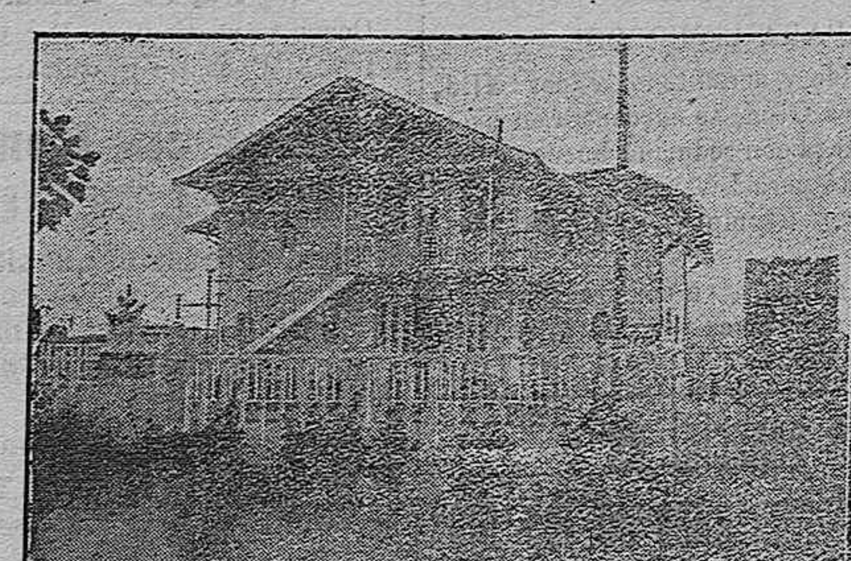
Fotografía del Chalet de S. de Oriva

Se construyen corsés rectos últimos modelos de París, de legítimas ballenas á medida desde 15 pesetas en adelante. Fajas medicinales para el descenso de la matriz, reducción del vientre para puerperas de útero y embago; diticos adelantos. Se vende el artículo del corsé, á pre-