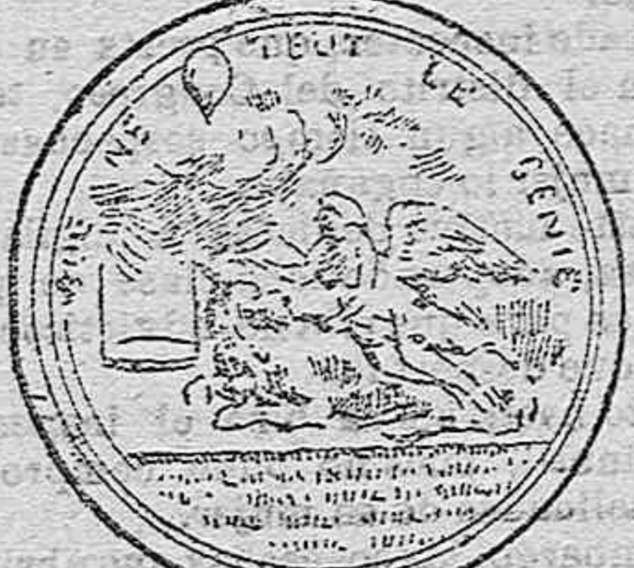
Medalla acuñada en honor de los hermanos Montgolfier

Cien años acaban de cumplirse desde la muerte de Miguel José Montgolfier, inventor del globo libre, y Francia ha celebrado dignamente el centenario, aunque no en la medida que se merece la memoria del primer termal de Balnearies-Bains (Francia), donde con motivo del centenario ha sido colocada una lápida de bronce y mármol que recuerda el hecho: Por su parte la Academia de Ciencias ha hecho acuñar una medalla dedicada a los dos hermanos Montgolfier, consagrandoles también algunas solemnidades.