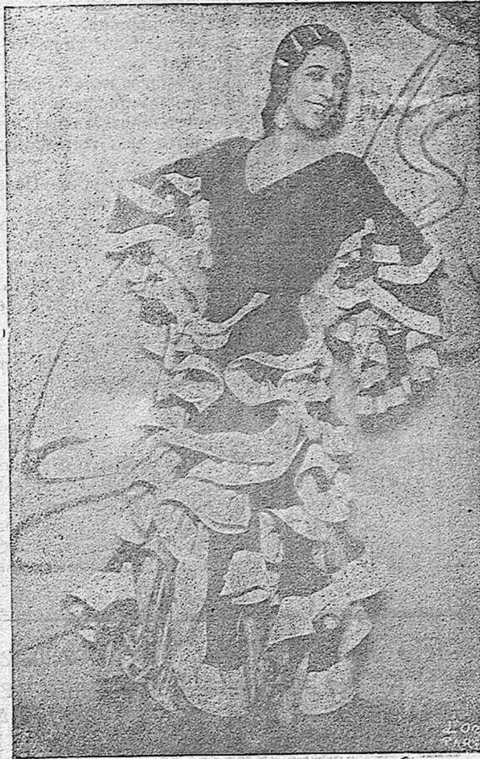
La inimitable bailarina "Argentinita"

te grata porque nos ha ofrecido la maravilla de sus danzas, ha sido objeto de repetidos y sinceros homenajes, destacándose el ofrecido por el Gobierno, en mercedida correspondencia a su gran labor difusora del arte español.