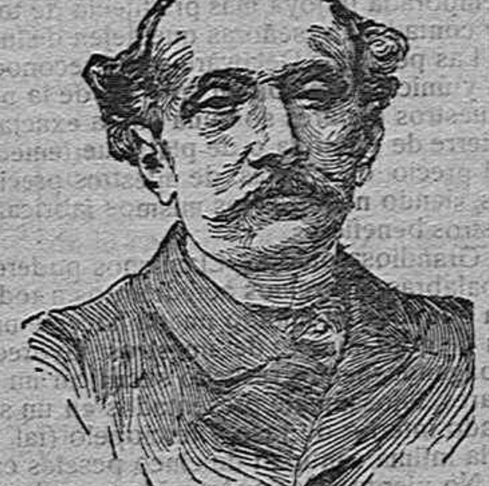
Don Eduardo Dato presidente del nuevo Consejo de ministros.

La Juventud Ciudadana ha dirigido ayer al Presidente del Consejo de Ministros y al Ministro de la Gobernación el siguiente telegrama: «Juventud Ciudadana integrada todos matices políticos saluda V. E. y le expone que estado opinión ciudad toda favorable a la moralizadora gestión Gobernador señor Polo de Lara nos constituye en el deber de rogar al Gobierno que por excepción continúe en el desempeño de dicho cargo si los compromisos del Gabinete pudieran hacerse compatibles con los