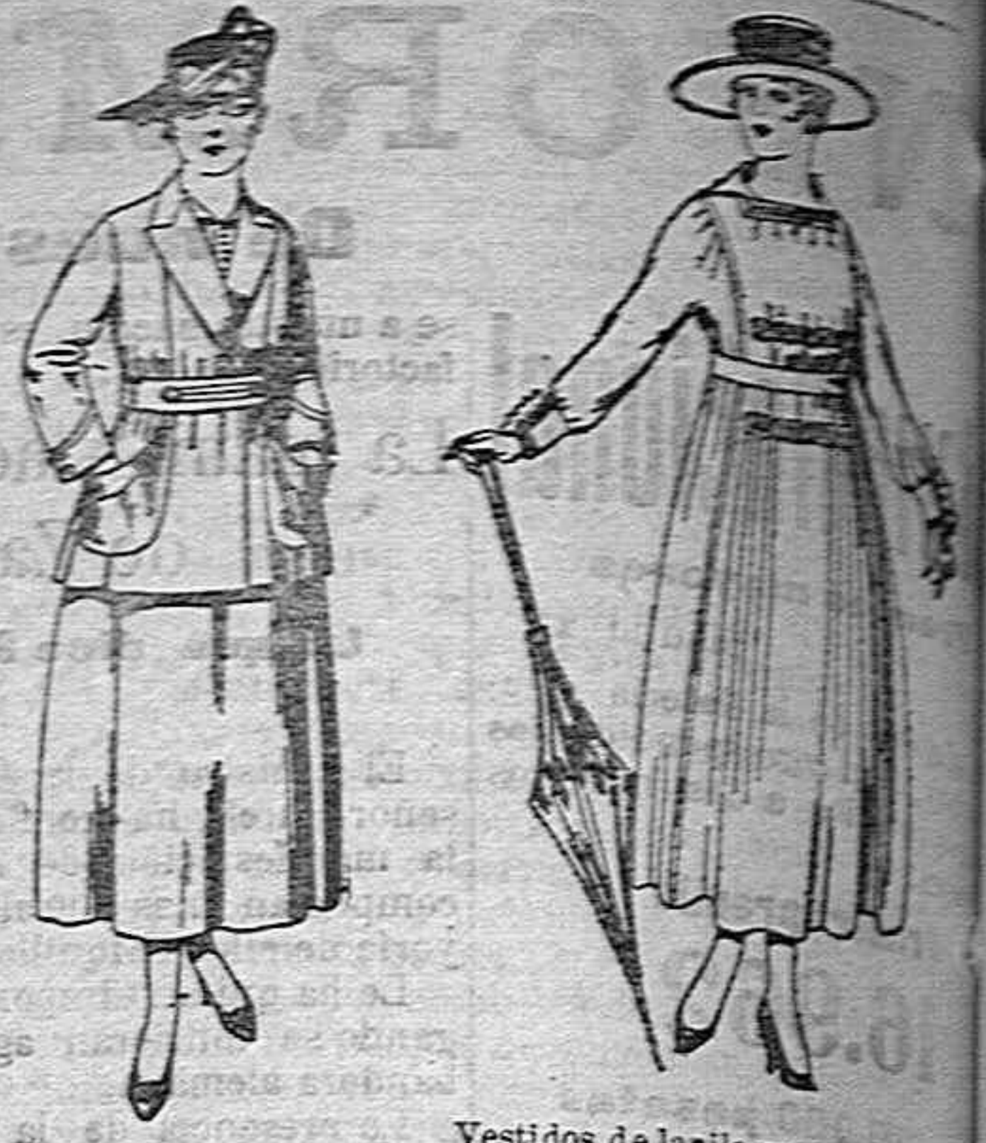
Traje de estambre negro, azul y color... Vestidos de lanilla...

SUCURSALES: Madrid, Barcelona, Alicante, Almería, Bilbao, Cádiz, Cartagena, Gijón, Granada, Málaga, Palma de Mallorca, Santander, Sevilla, Valencia, Valladolid, Zaragoza.