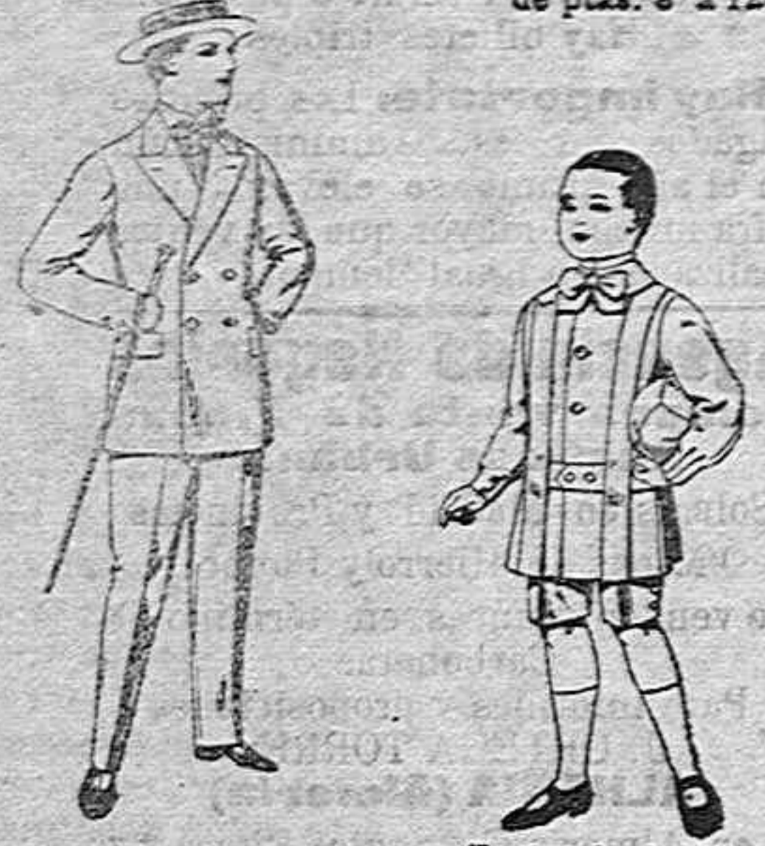
Traje de estambre, vicuña o jerga... Trajes de lanilla para niños...