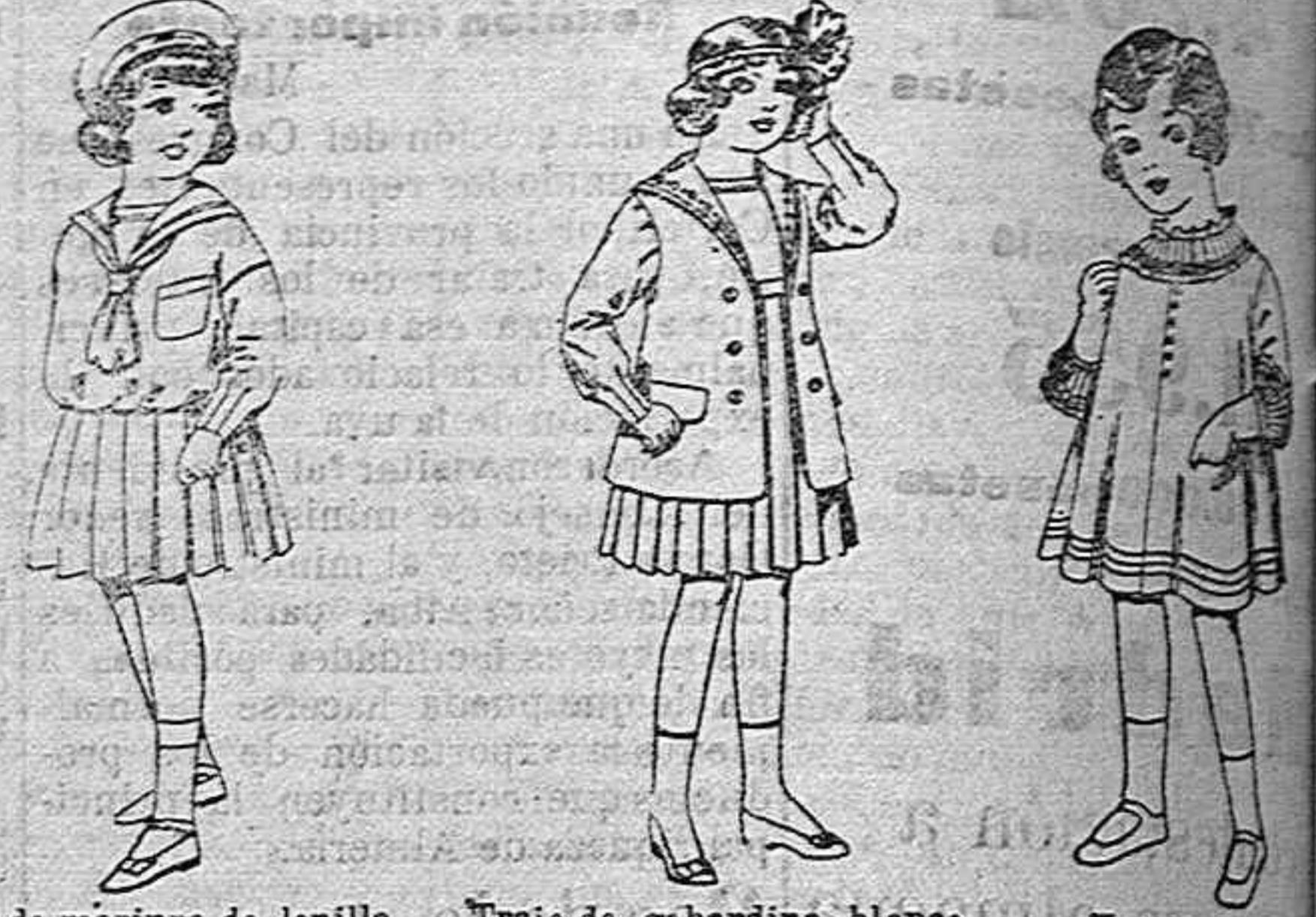
Trajes de marinera de lanilla azul para niñas... Traje de gabardina blanco...

Camisería, Géneros de punto, Corbatería, Guantería Sombrereria, Zapatería, Paraguas, Bastes y Artículos de viaje.