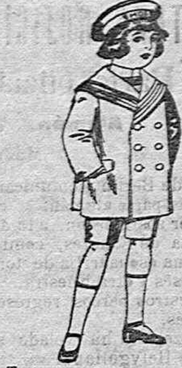
Trajes matelot de vicuña o jergal azul para niño...

Ropas confeccionadas para caballero, señora, niño y niña.