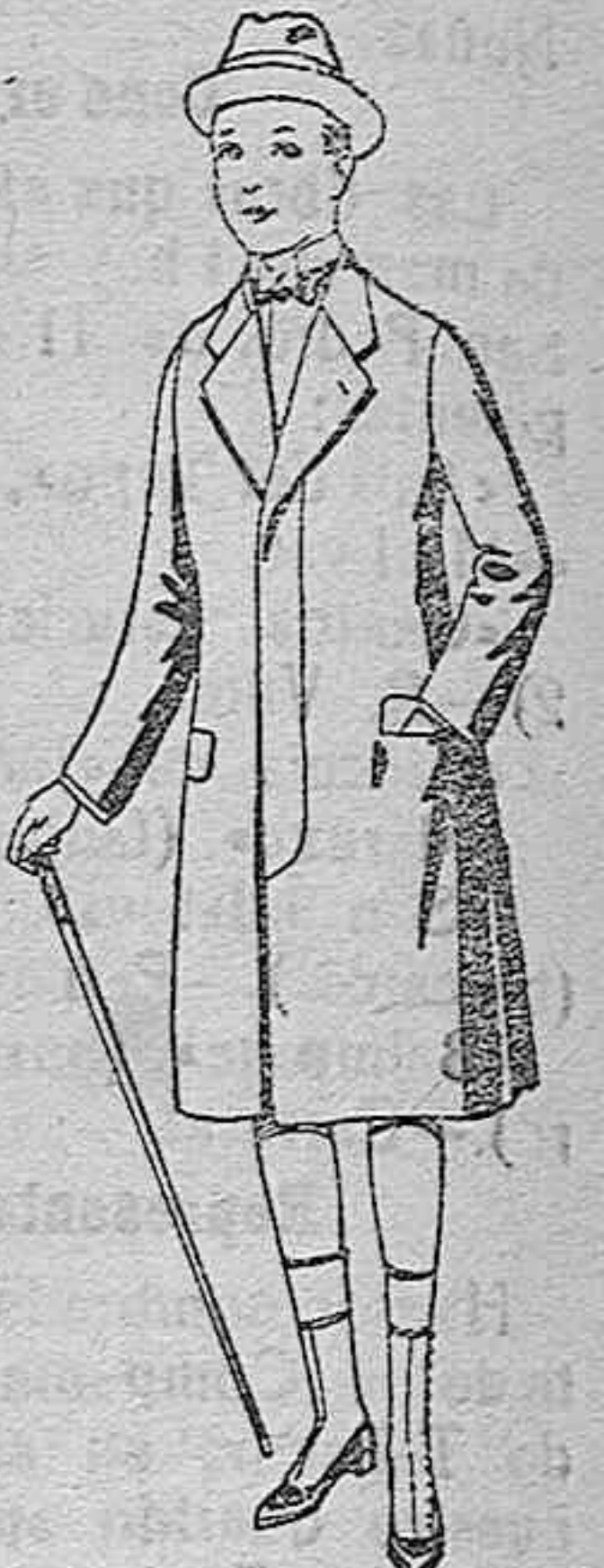
Gabanes de patén, para niños de 10 a 12 años. De ptas. 18 a 35. Los mismos, para juveniles de 13 a 16 años. De ptas. 21 a 38