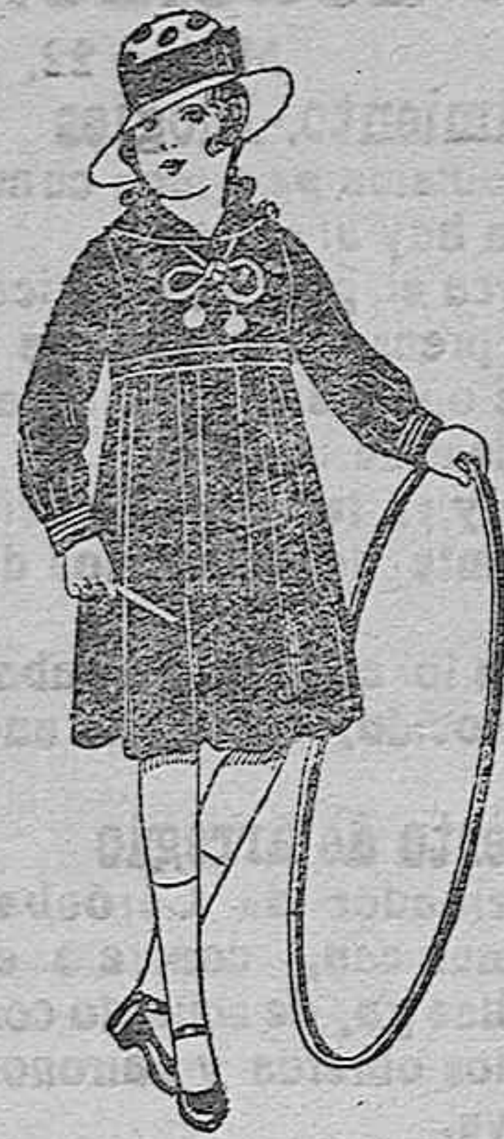
Vestidos marinera, de sarga o estambre azul, adornos seda blancos. De ptas. 25 a 30