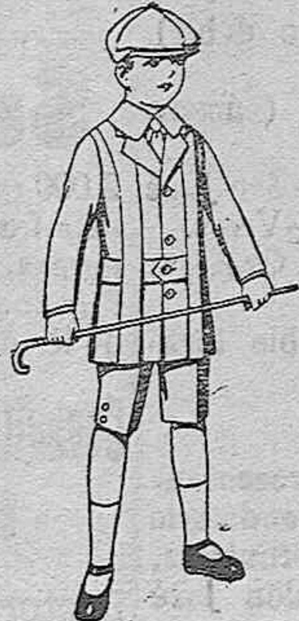
Trajes de patén, modelo «Norfolk» para niños de 4 a 9 años. De ptas. 14 a 35