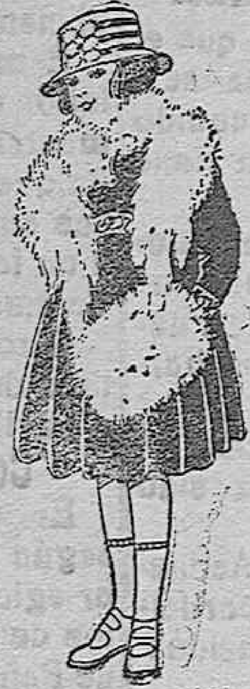
Juegos imitación Renard, blanco. A ptas. 12.