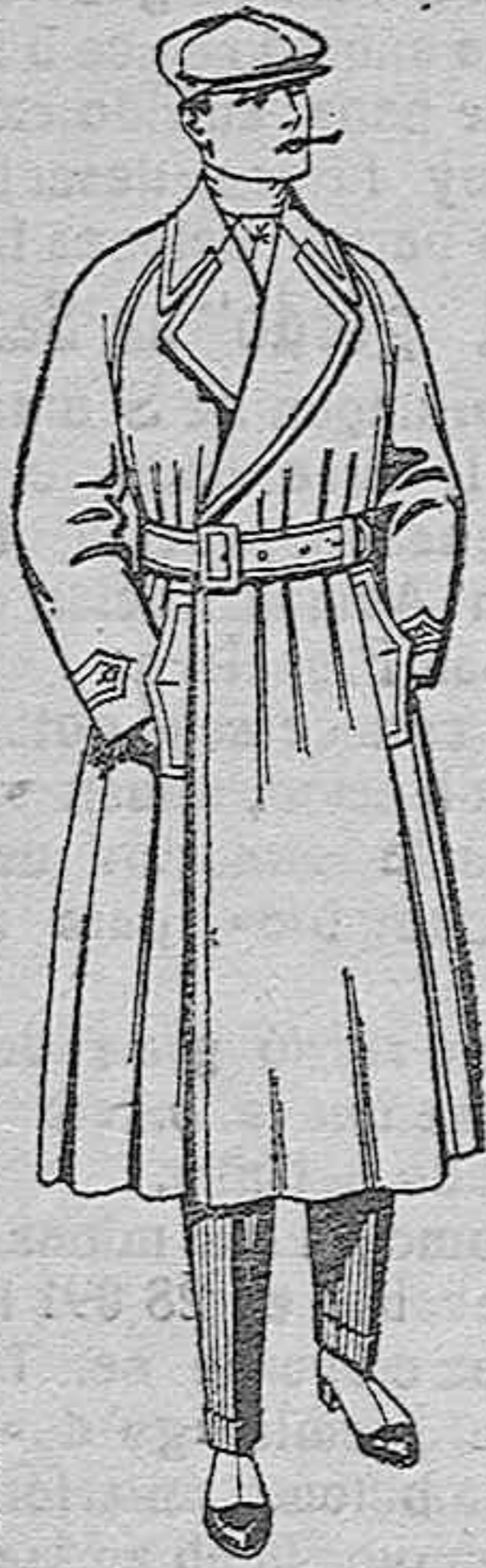
Gabanes impermeabilizados con cinturón, color beige. De ptas. 43 a 115

Ultima novedad en echarpas, manguitos, pelerinas, corbatas, abrigos, etc., en pieles de loutre, taupe, vison, renard, zibeline, armiño, etc., auténticas e imitación perfecta.