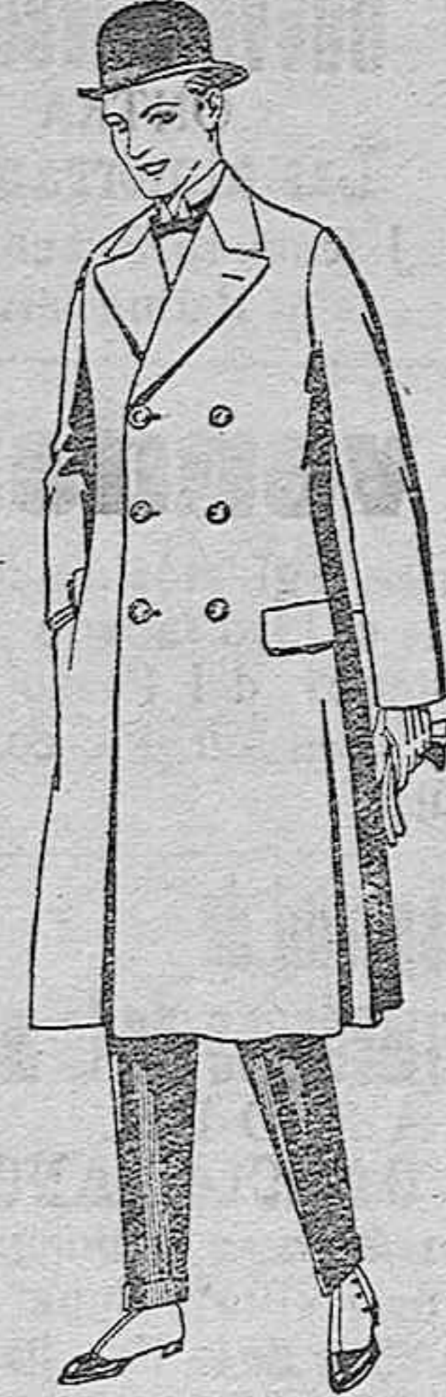
Gabanes de patén, gamuzá o Cover. De ptas. 50 a 110

PRECIO FIJO VENTA AL CONTADO Pídense el catálogo general