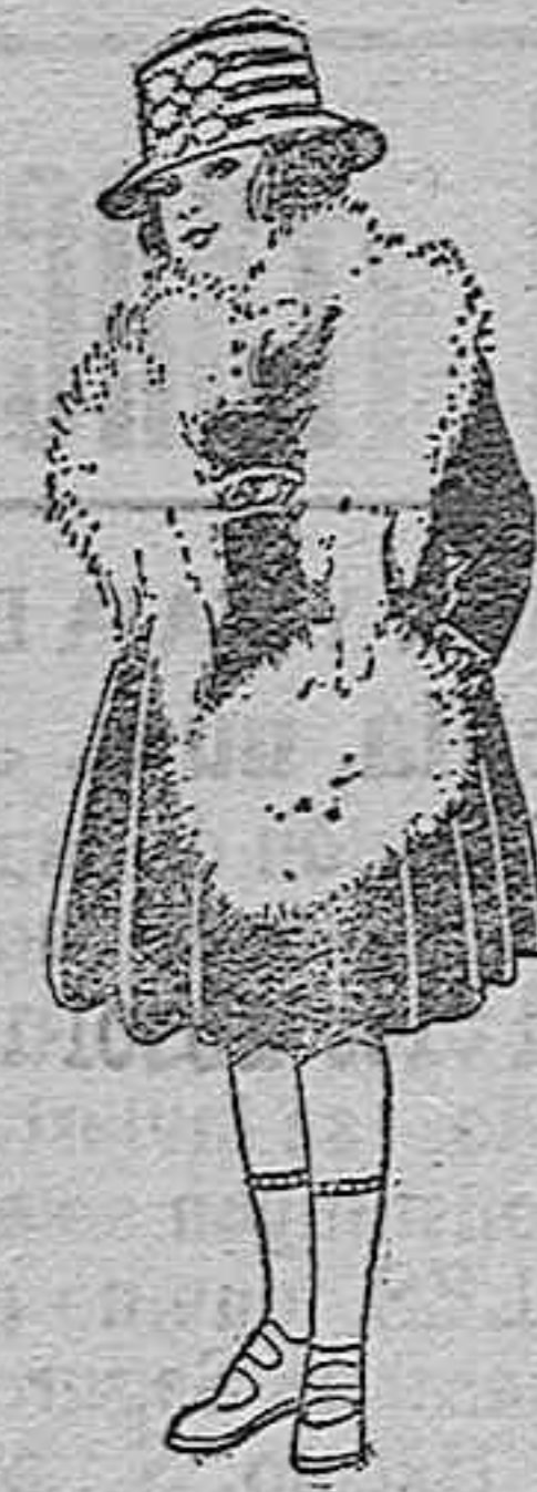
Juegos imitación Renard, blanco. A ptas. 52.