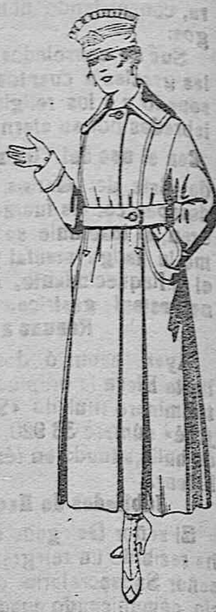
Abrigos de cheviot o gamuza en azul, negro y colores. De ptas. 45 a 55.