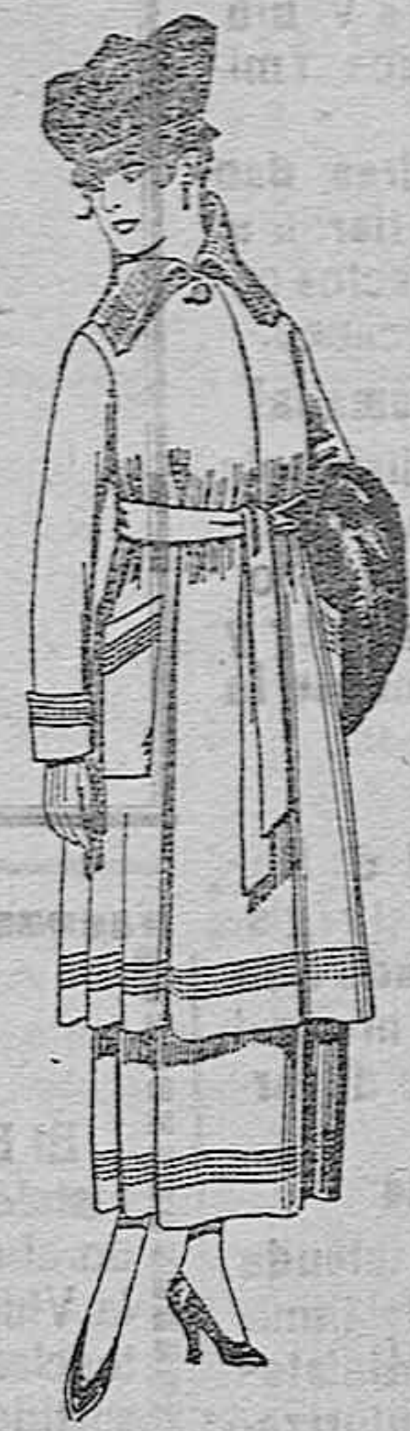
Trajes de sarga inglesa, en negro y azul, bordados. De ptas. 85 a 100