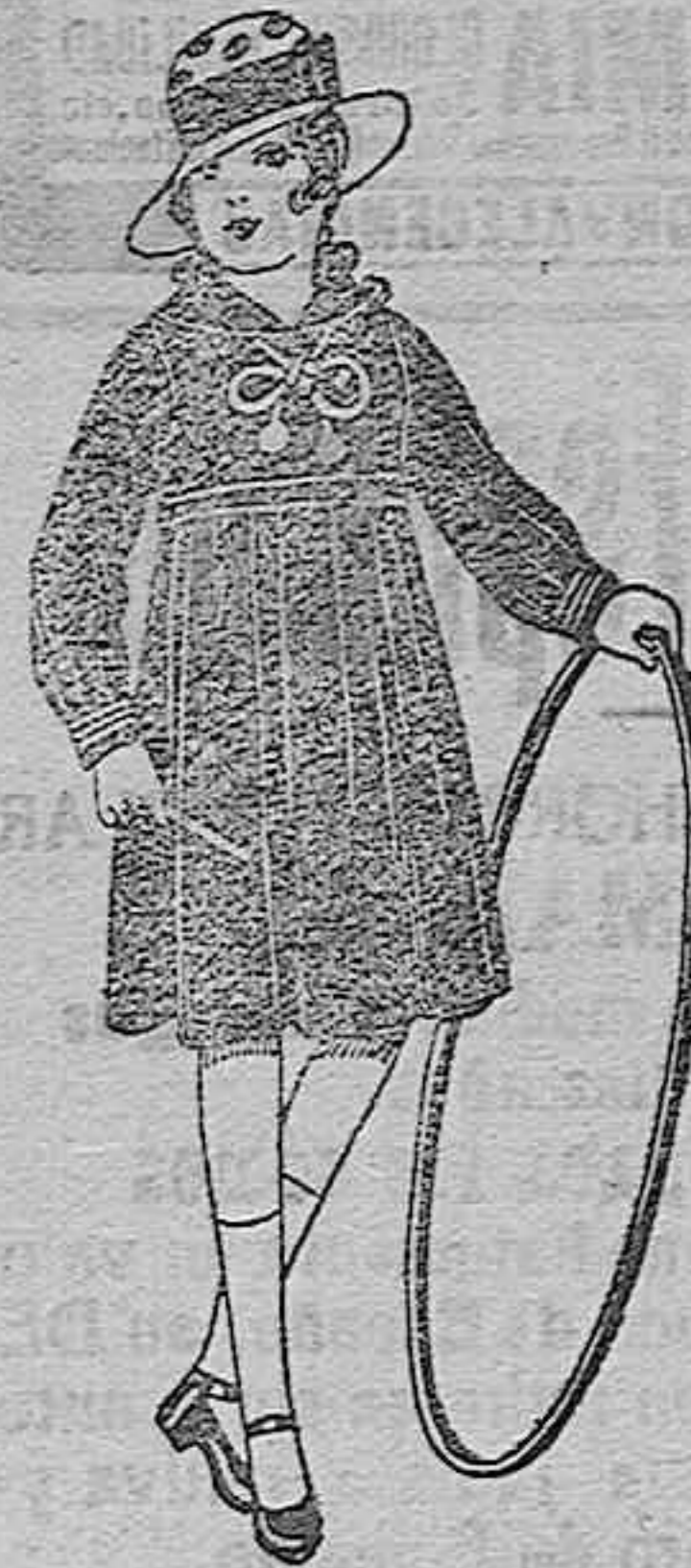
Vestidos marinera, de sarga o estambre azul, adornos seda blancos. De ptas. 25 a 30