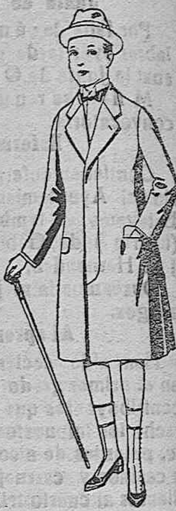
Gabanes de patén, para niños de 10 a 12 años. De ptas. 18 a 55. Los mismos, para juveniles de 13 a 16 años. De ptas. 21 a 58

GRAN EXPOSICION DE ARTICULOS DE LA TEMPORADA