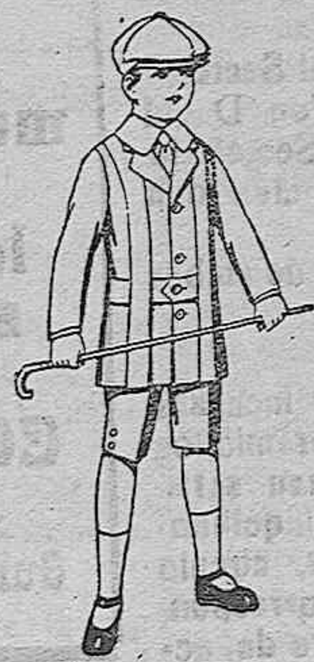
Trajes de patén, modelo «Norfolk» para niños de 4 a 9 años. De ptas. 14 a 35