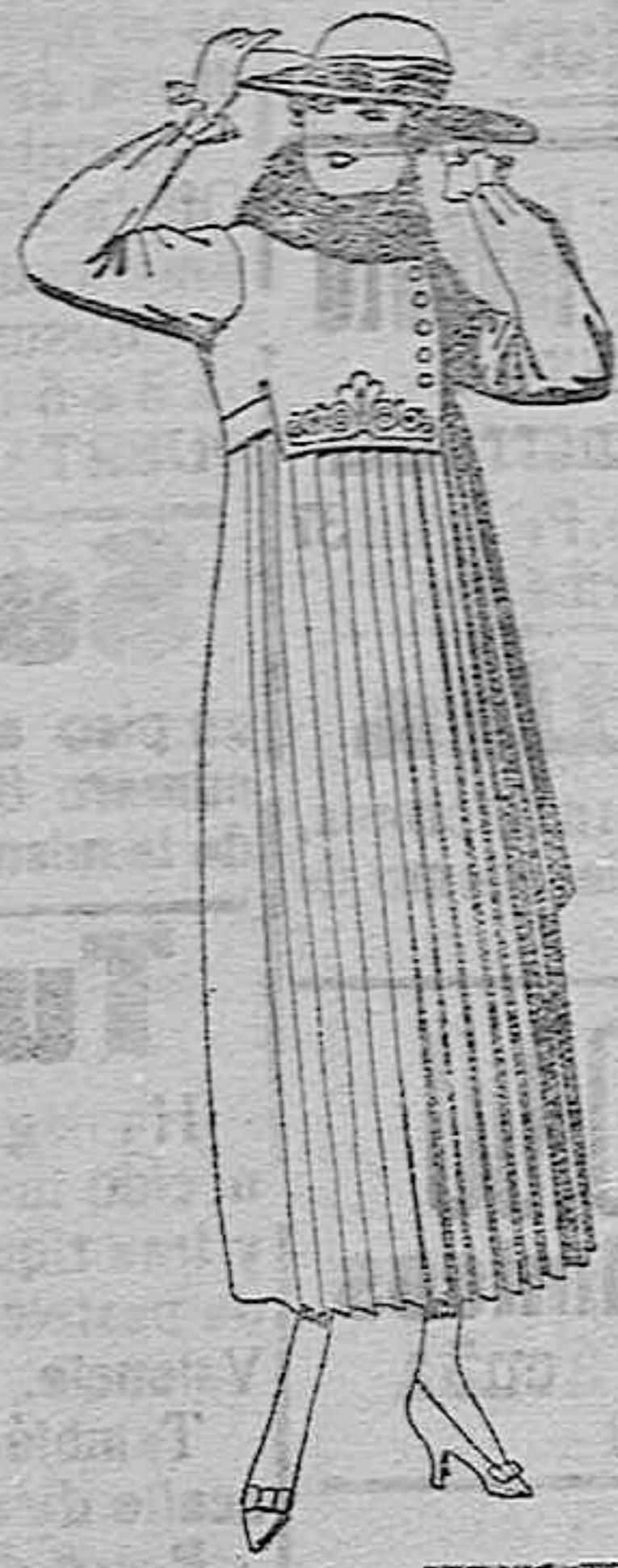
Vestidos de punto de lana, azul y color, bordados, cuello piel. De ptas. 95 a 100.