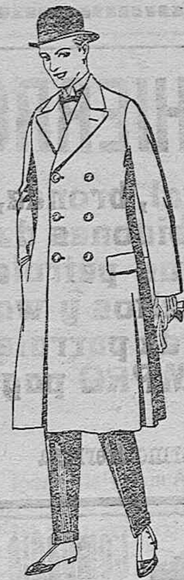
Gabanes de patén, gamuza o Cowar. De ptas. 50 a 110