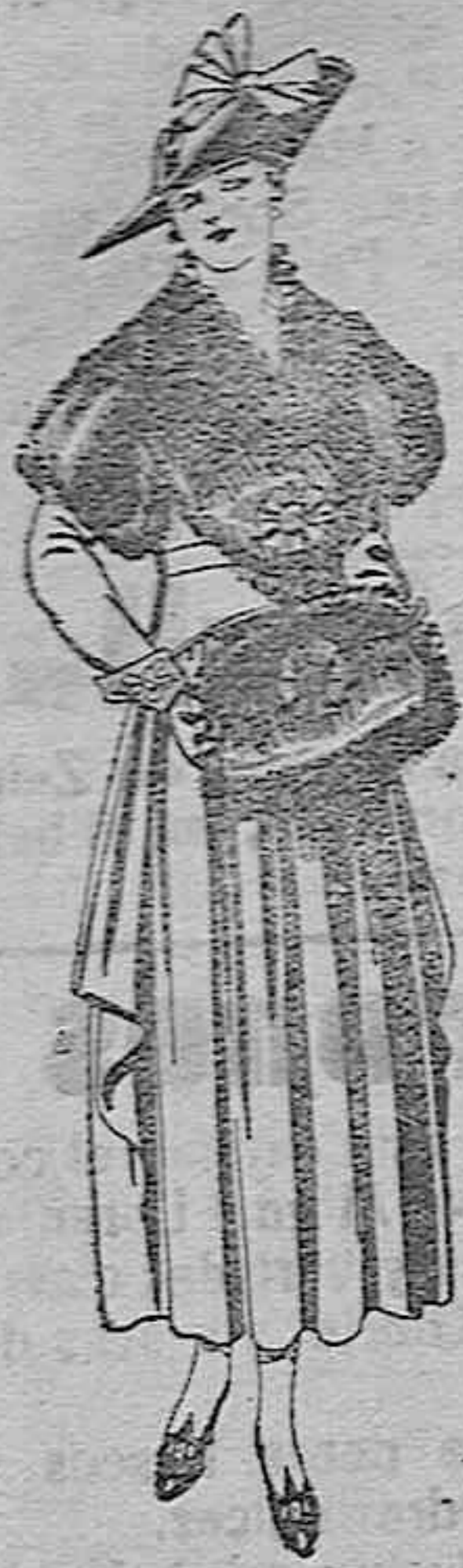
Juegos de pieles, negro, imitación Renard. Gran chic. A ptas. 58.

Ropas confeccionadas para caballero, señora, NIÑO Y NIÑA