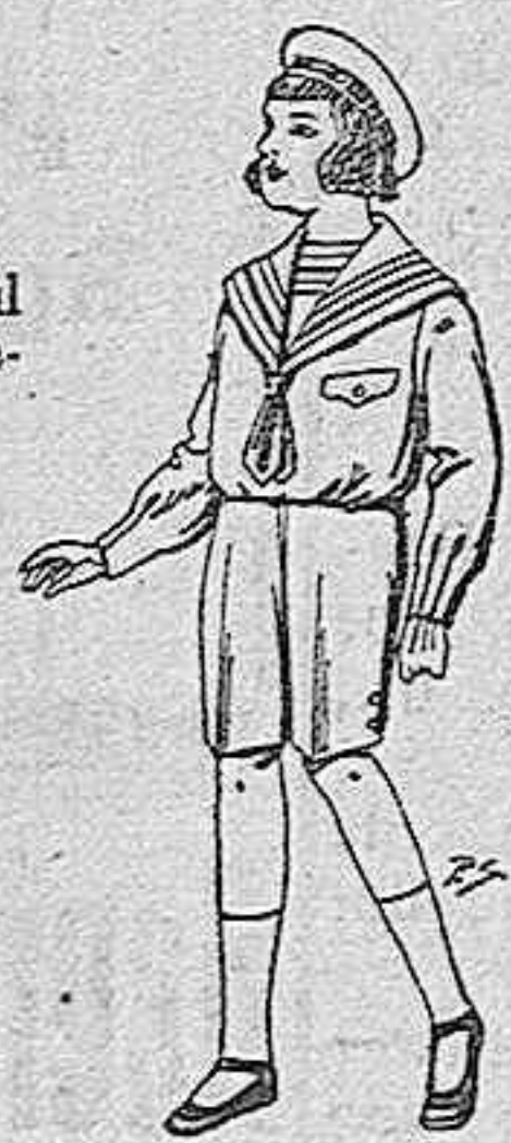
Trajes de gerga azul, para niños de 4 a nueve años, de ptas 9 a 22