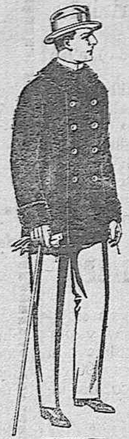
Pellicas de ratina con cnello del mismo genero y con astrakan, de pesetas 16 a 90