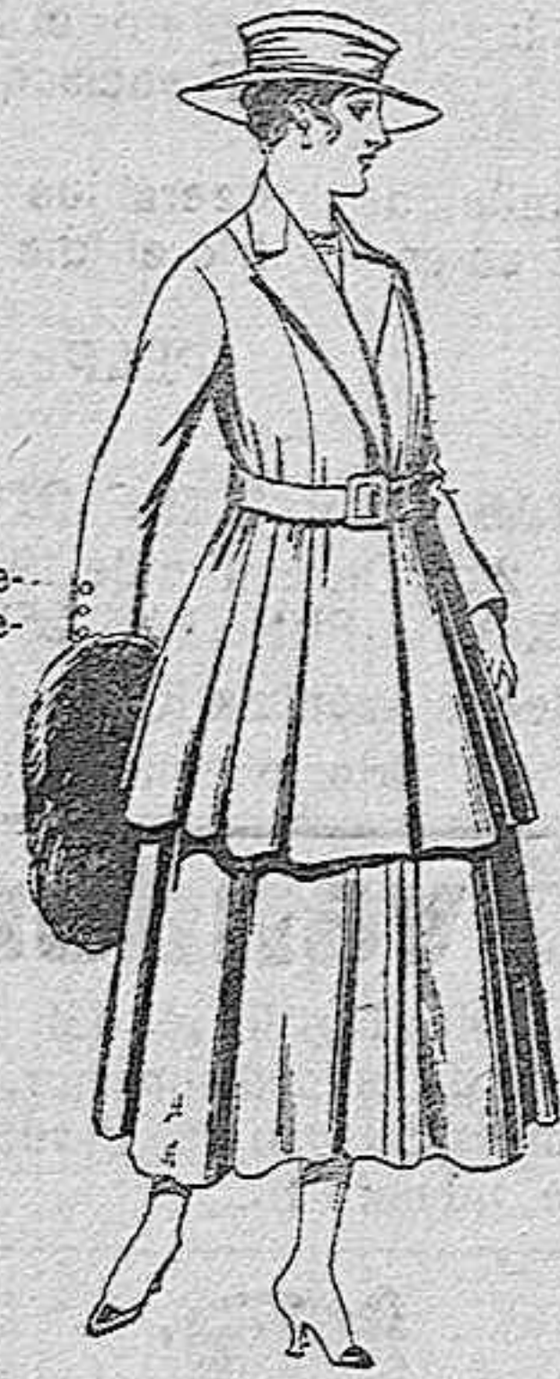
Traje de lana, para señora, en color negro y azul, de pesetas 85 a 100