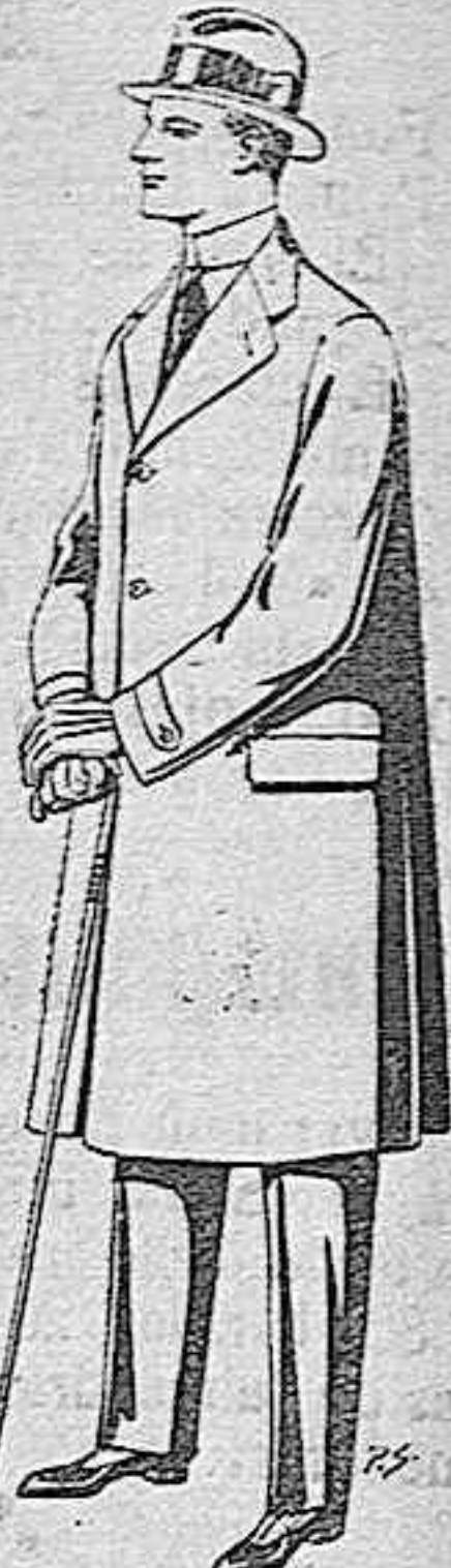
Gabanes de tejido pinma o ratina, de pesetas 33 a 110.