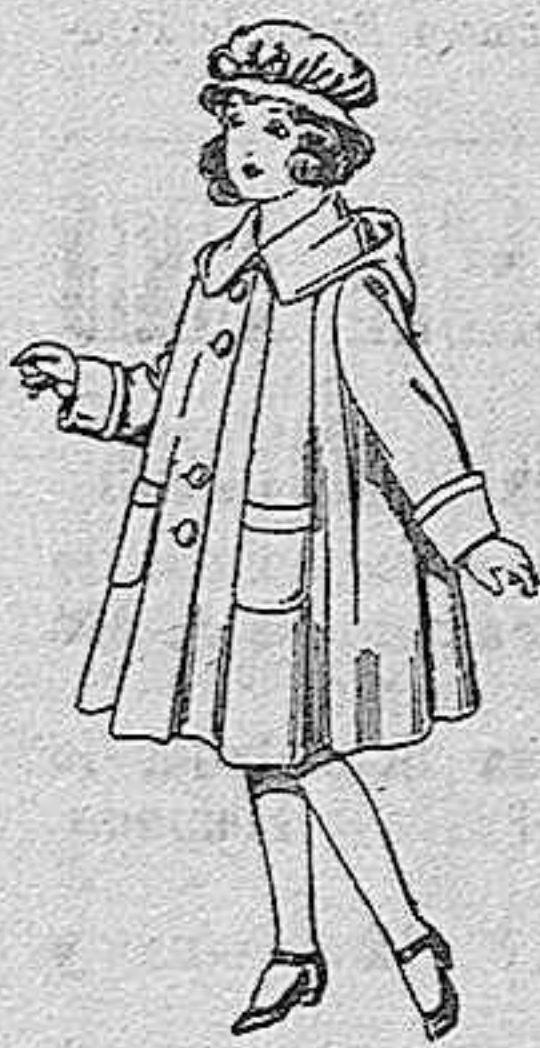
Abrigos de paten, para niñas de 4 a 9 años, de pesetas 22 a 33