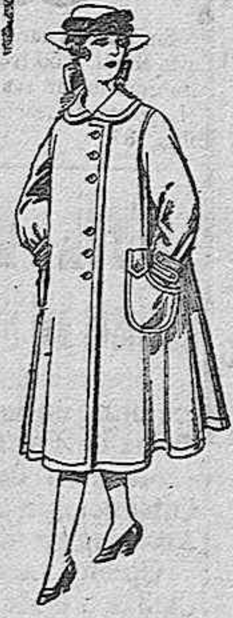
Abrigos de lana para jovencitas de 11 a 15 años, de ptas. 35 a 40