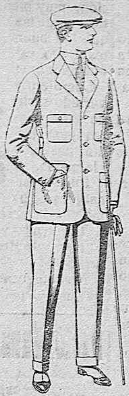
Trajes de cheviot, corte elegante, para sporman, de pesetas 45 a 55.