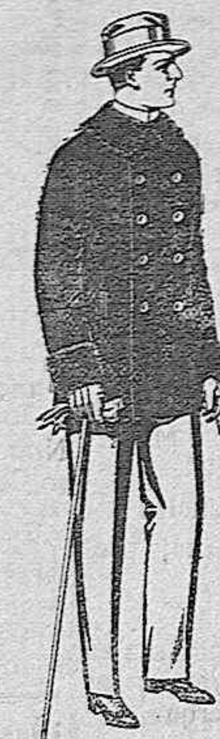
Pelizas de ratina con cuello del mismo género y con astrakán, de pesetas 16 a 90