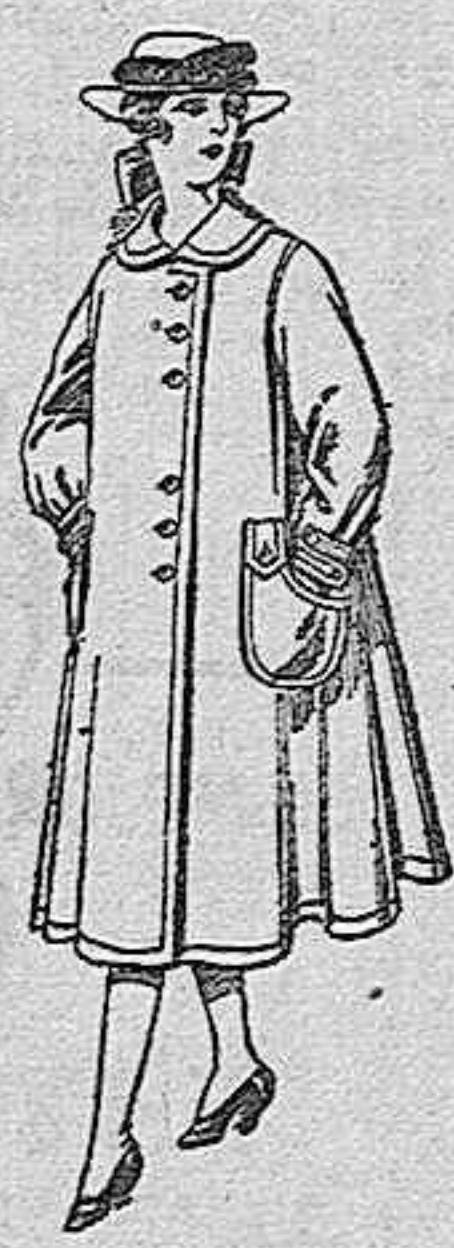
Abrigos de lana, para jovencitas de 11 a 15 años, de ptas. 35 a 40