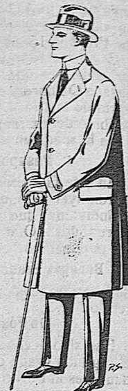
Gabanes de tejido pinma o ratina, de pesetas 33 a 110.