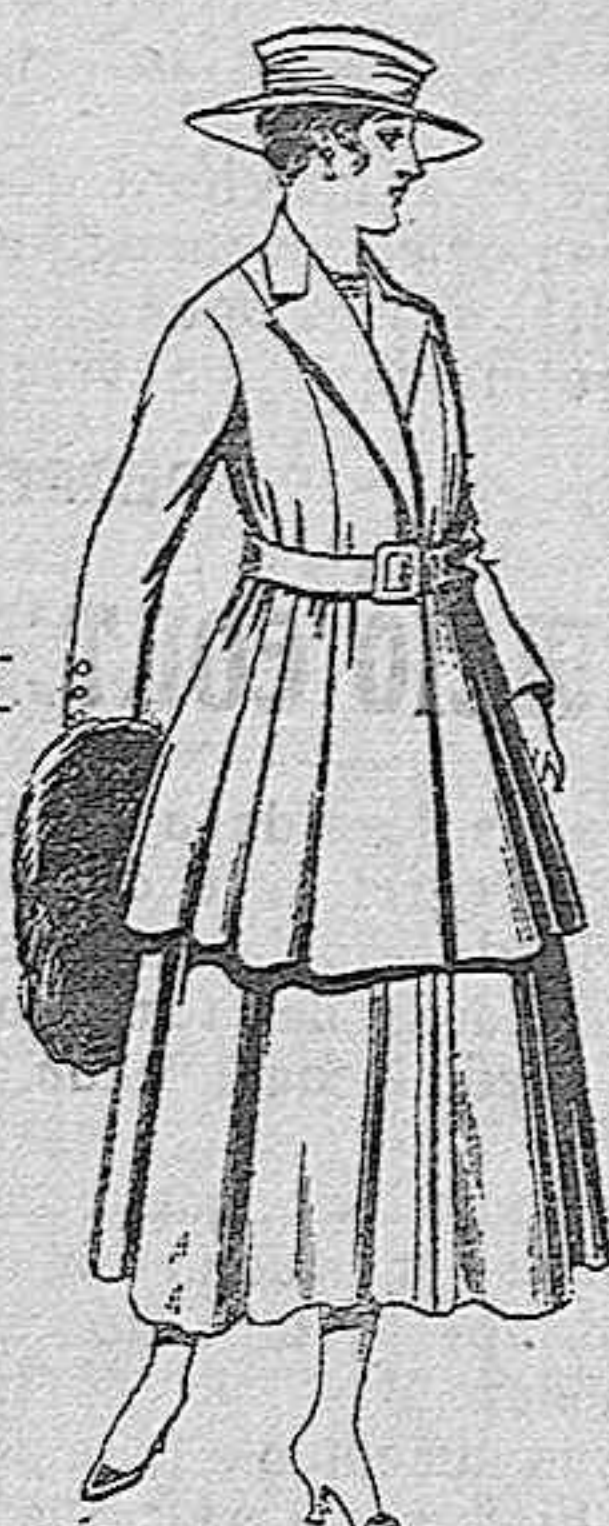
Traje de lana, para señora, en color negro y azul, de pesetas 85 a 100