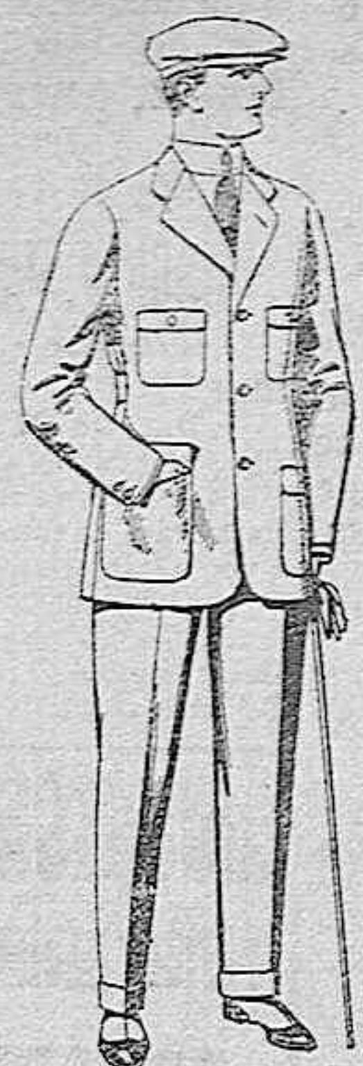
Trajes de cheviot, corte elegante, para sporman, de pesetas 45 a 55.