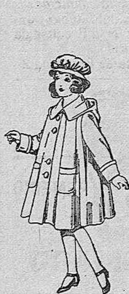
Abrigos de paten, para niñas de 4 a 9 años, de pesetas 22 a 33