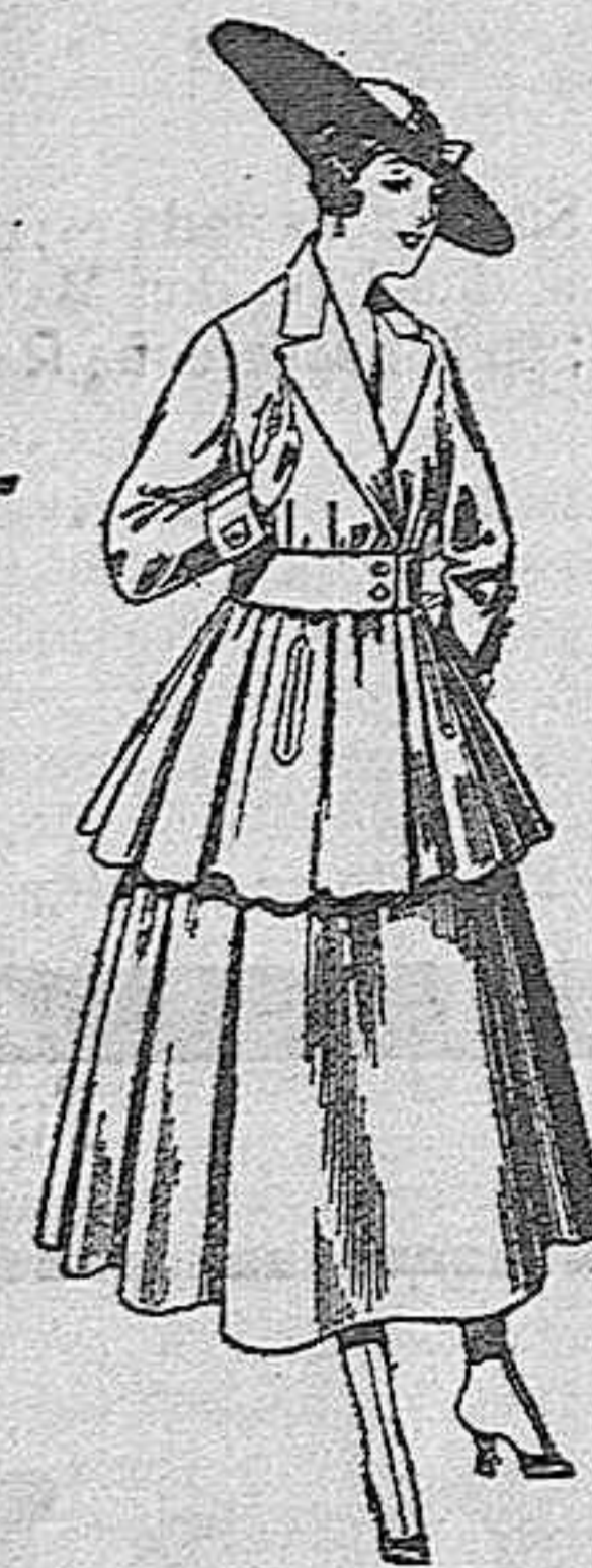
Traje de lana, en negro, azul y color, para señora, de pesetas 90 a 100