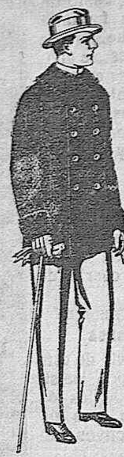
Pellizas de ratina con cuello del mismo género y con astrakán, de pesetas 16 a 90