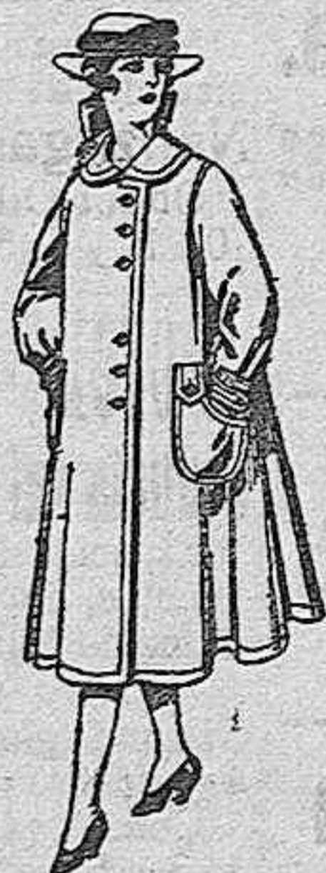
Abrigos de lana para jovencitas de 11 a 15 años, de ptas. 35 a 40