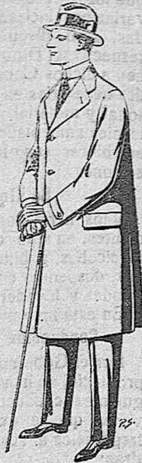
Gabanes de tejido pluma o ratina, de pesetas 33 a 110