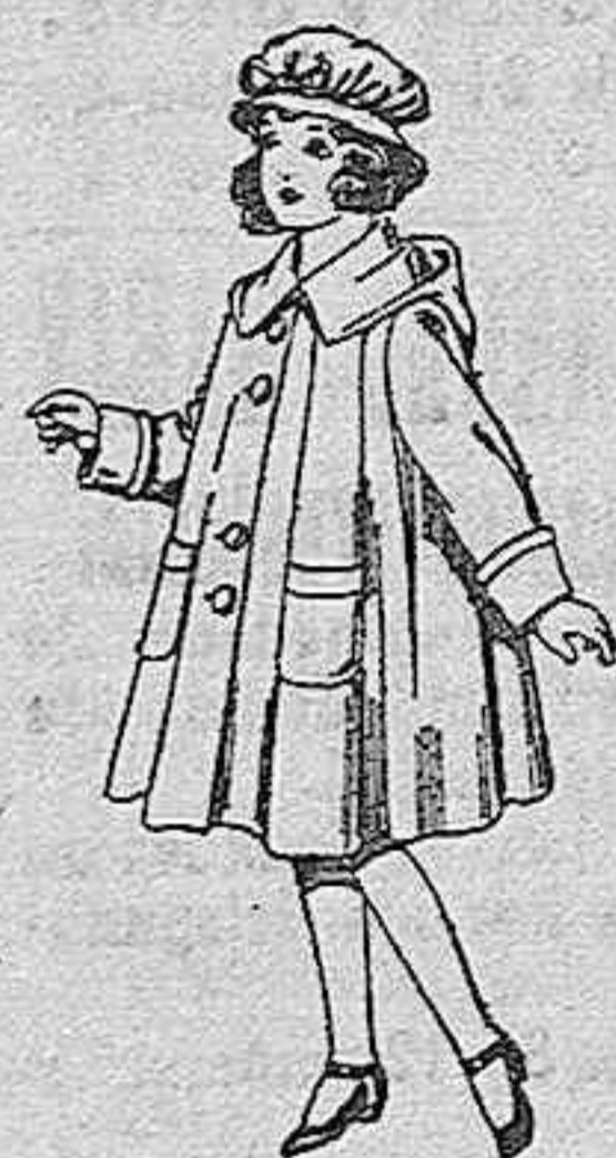
Abrigos de paten, para niñas de 4 a 9 años, de pesetas 22 a 33