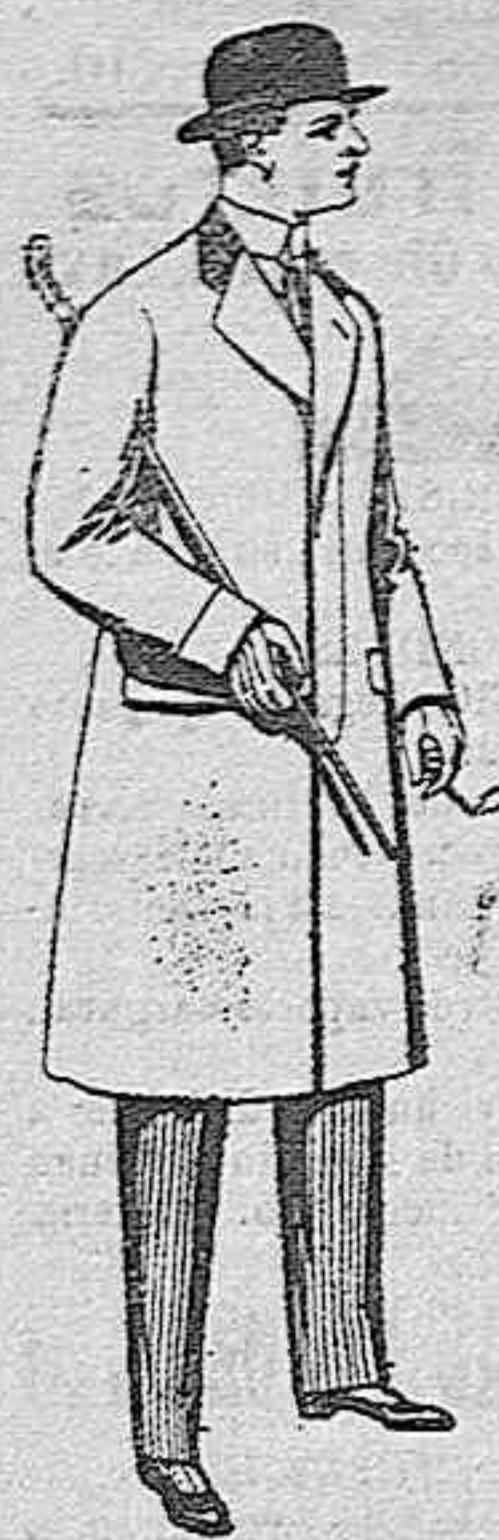
Gabanes de paten. melton y cheviot, con forros seda, saten o escocés, de pesetas 83 a 100.

Madrid, Barcelona, Alicante, Almería, Bilbao, Cádiz, Cartagena, Gijón, Granada, Málaga, Palma de Mallorca, Santander, Sevilla, Valencia, Valladolid y Zaragoza.