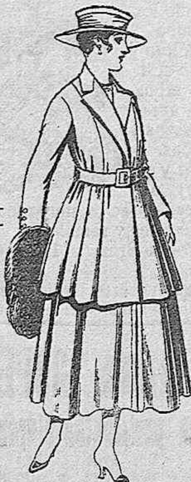
Traje de lana, para señora, en color negro y azul, de pesetas 85 a 100