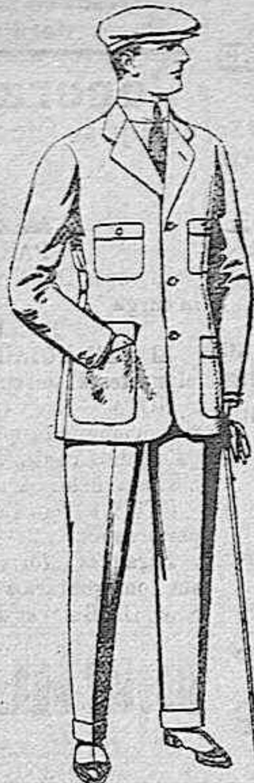
Trajes de cheviot, corte elegante, para sporman, de pesetas 45 a 55.