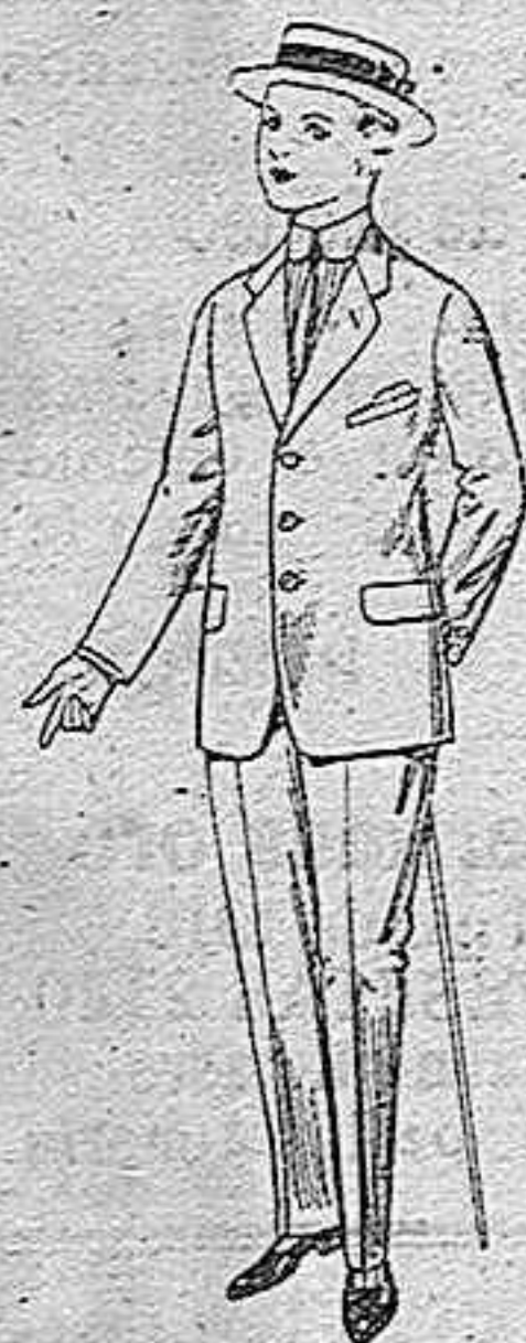
Trajes de lanilla viena etc. para jovencitos de 10 a 16 años De pesetas 14 a 48