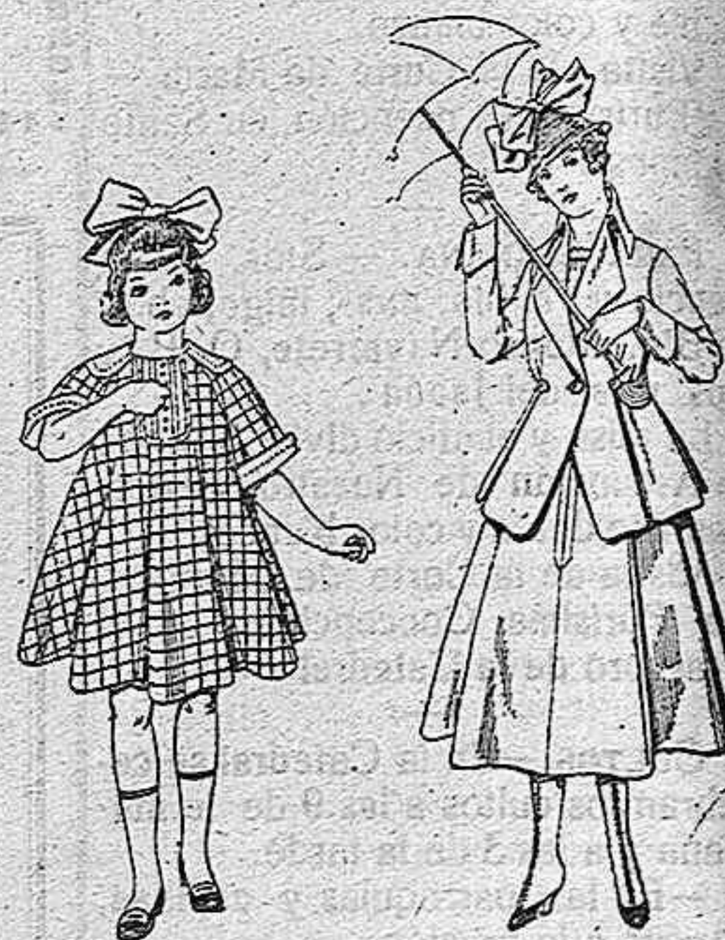
Vestidos de lanilla para niñas de 4 a 9 años. De pesetas 15 a 25 Trajes de lanilla negra, azul y color para jovencitas de 13 a 16 años De pesetas 50 a 55