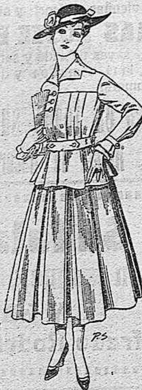
Trajes de lanilla negra, azul y color para señora A pesetas 105