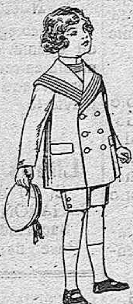
Trajes modelo matelot, de viena azul para niños de 4 a 9 años De pesetas 12 a 31