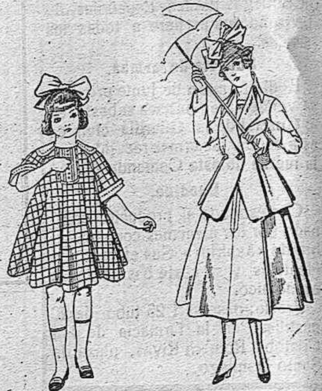
Vestidos de lanilla para niñas de 4 a 9 años. De pesetas 15 a 25 Trajes de lanilla negra, azul y color para juveniles de 13 a 16 años De pesetas 50 a 55