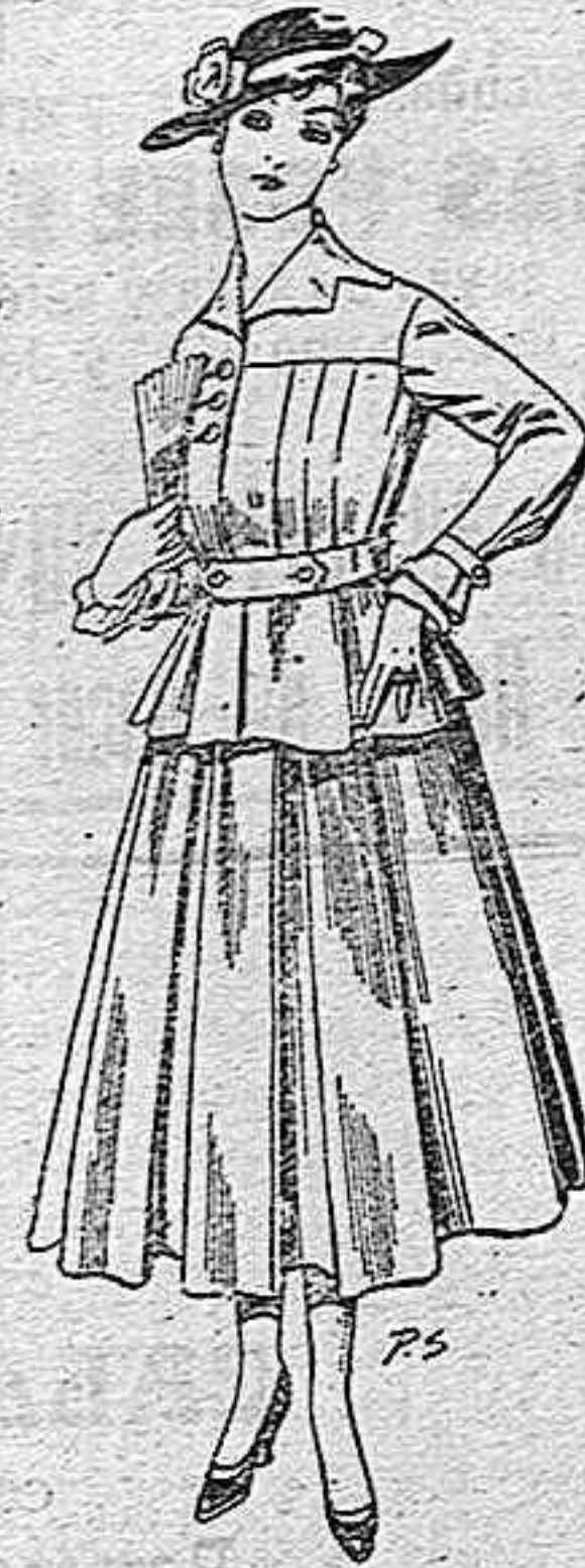
Trajes de lanilla negra, azul y color para señora A pesetas 105