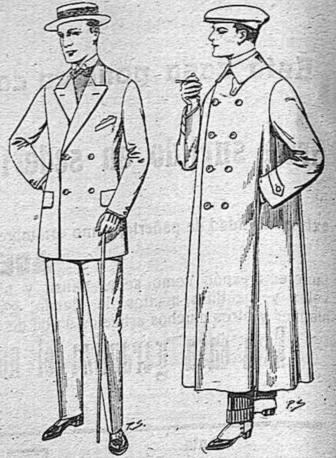
Trajes modelo Sport de lanilla, cheviot etc. De pesetas 40 a 47 Guardapolvos de dril crudo o gris. De pesetas 12 50 a 30