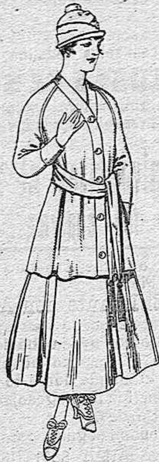
Paletot de tricot de seda colores lisos. A pesetas 33