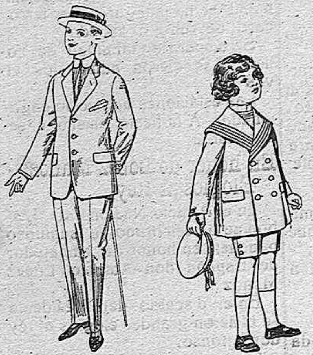
Trajes de lanilla vicuña etc. para juveniles de 10 a 16 años De pesetas 14 a 48. Trajes modelo matelot, de vicuña azul para niños de 4 a 9 años De pesetas 12 a 31