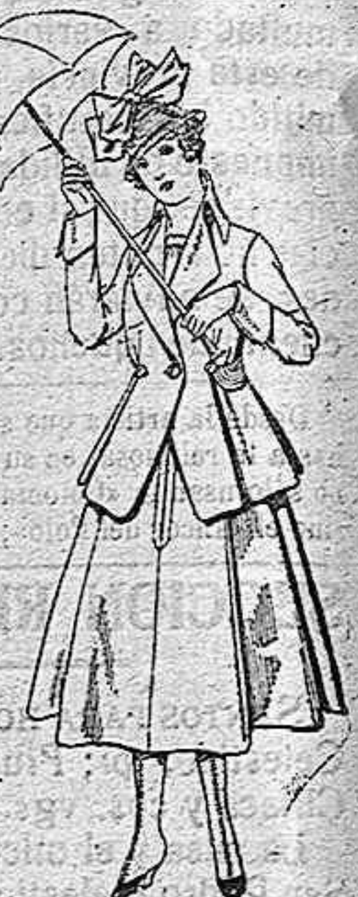
Trajes de lanilla para jovencitas de 13 a 16 años. De pesetas 33 a 55