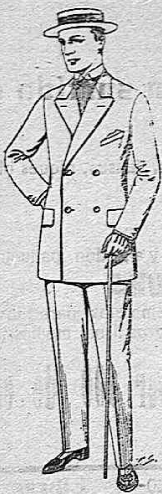
Trajes de vicuña o gerga negros y azules. De pesetas 38 a 75.