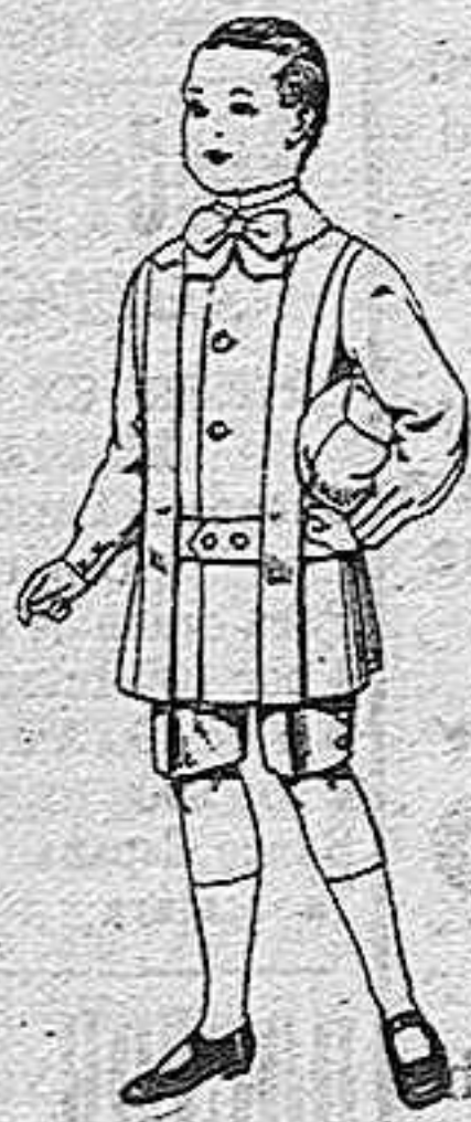
Trajes de lanilla para niños de 4 a 9 años. De pesetas 12 a 31