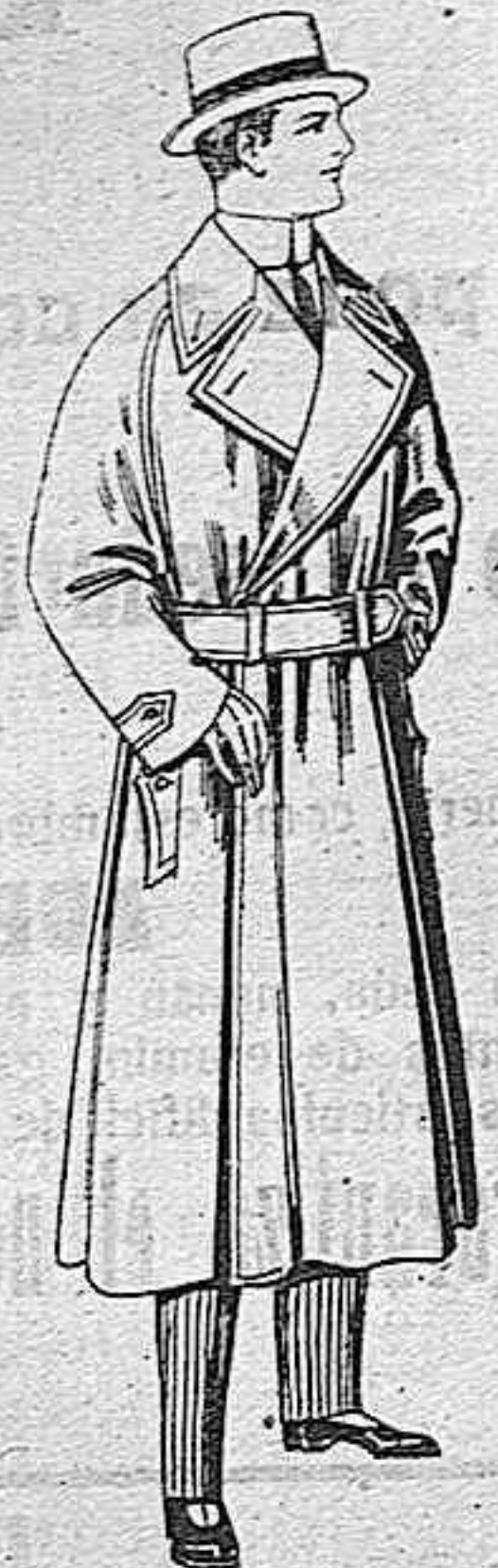
Gabanes impermeabilizados en color blige. De pesetas 65 a 100.