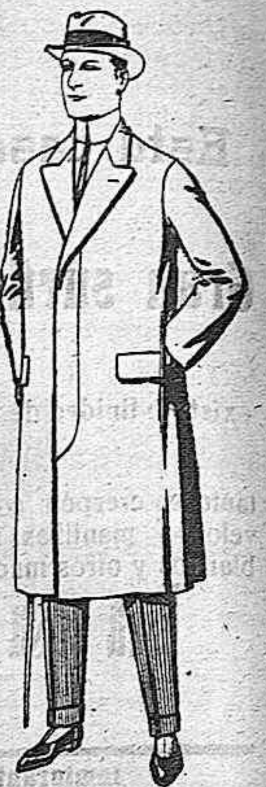
Pardessus de melton o vicuña. De pesetas 25 a 100