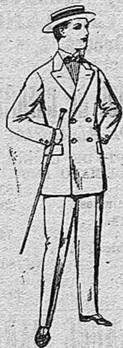
Trajes de lanilla para jovencitos de 10 a 16 años. De pesetas 17 a 48.