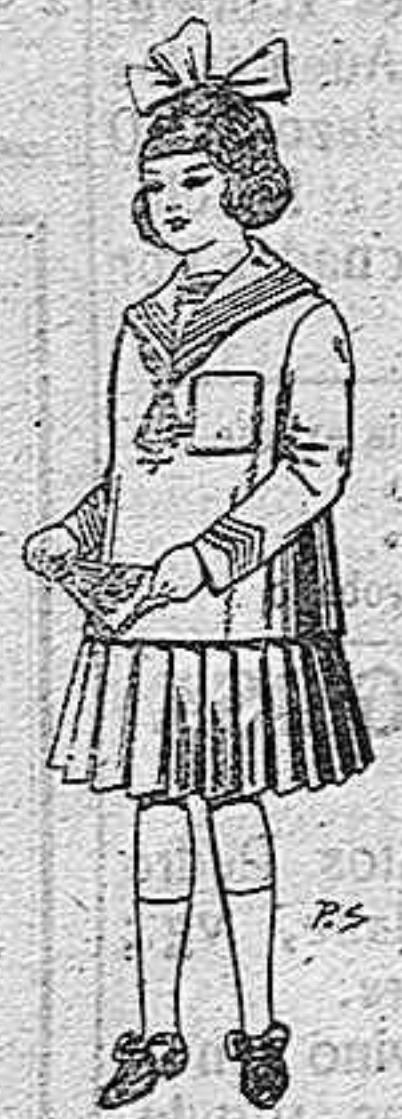
Trajes de lanilla para niñas de 4 a 12 años. De pesetas 32 a 40