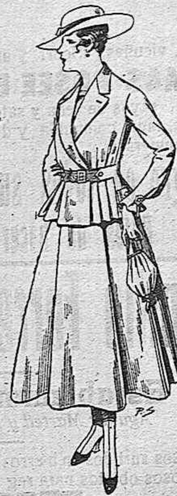
Trajes de lanilla para señora. A pesetas 70