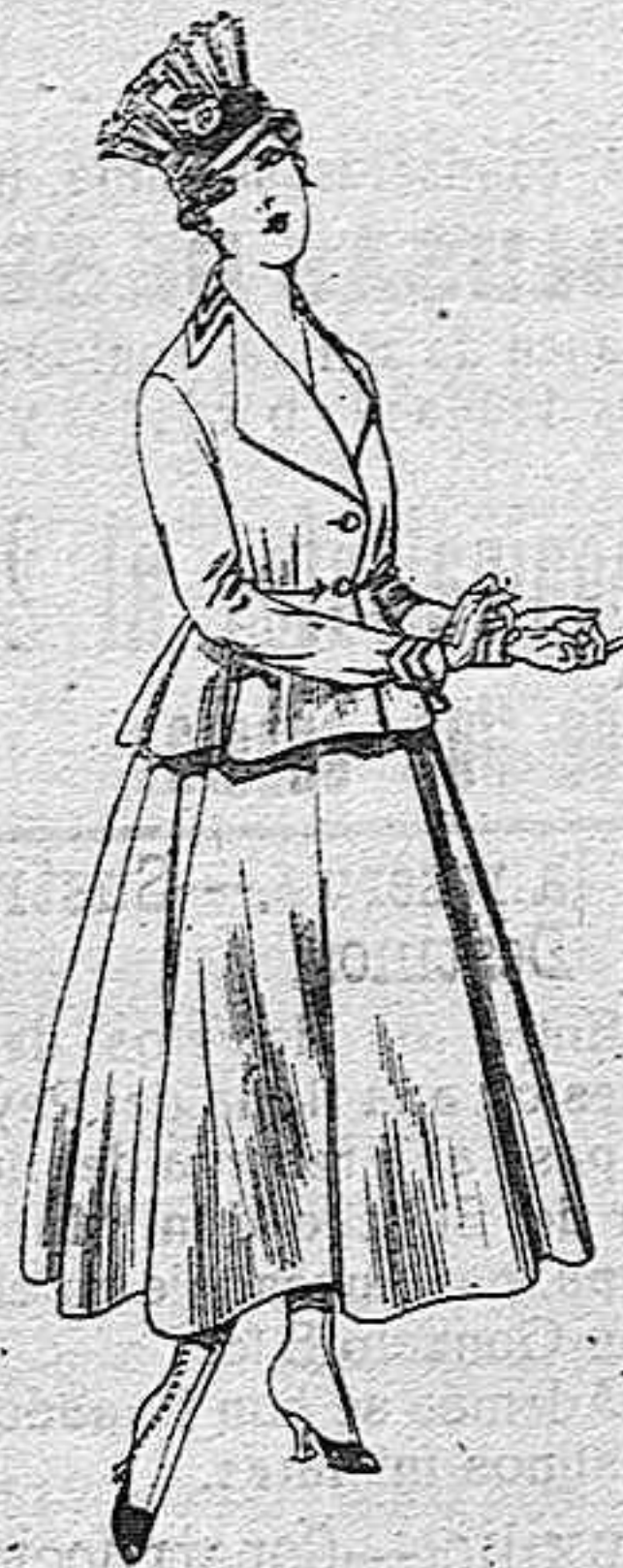
Trajes de lanilla para señora. A pesetas 80