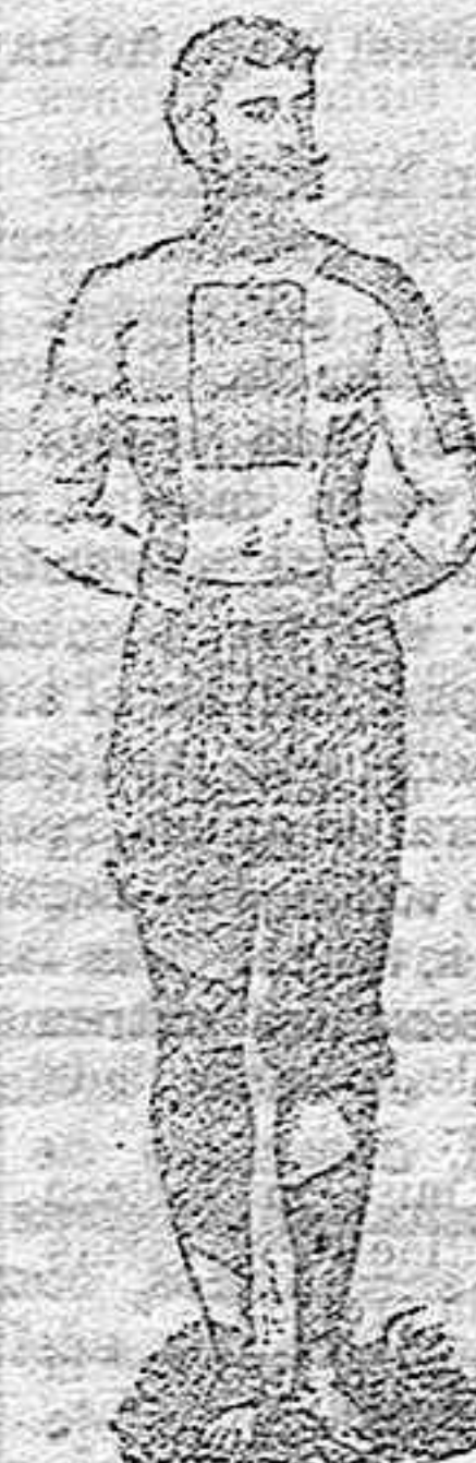
Trade Mark Registered

PERFORADOS AMERICANOS DE FIELTRO ROJO DEL doctor Winter.