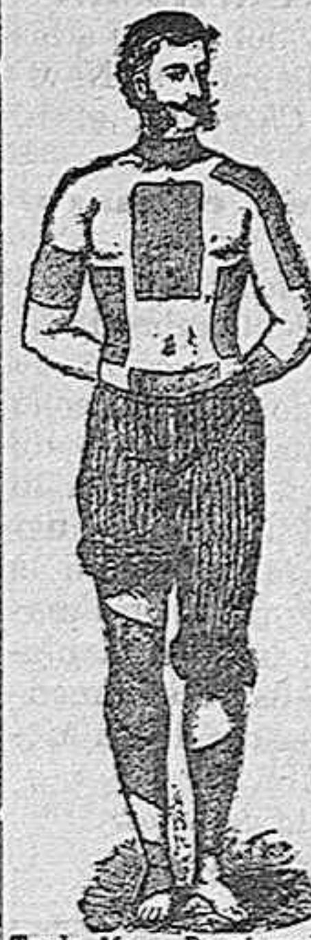
Trade Mark Registered.

PERFORADOS AMERICANOS DE FIELTRO ROJO DEL doctor Winter.