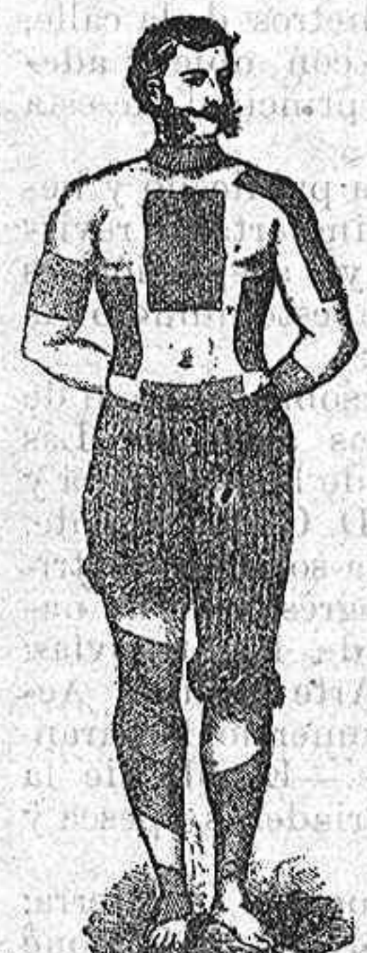
TradeMark of registered.

PERFORADOS AMERICANOS DE FIELTRO ROJO DEL docto Winter.