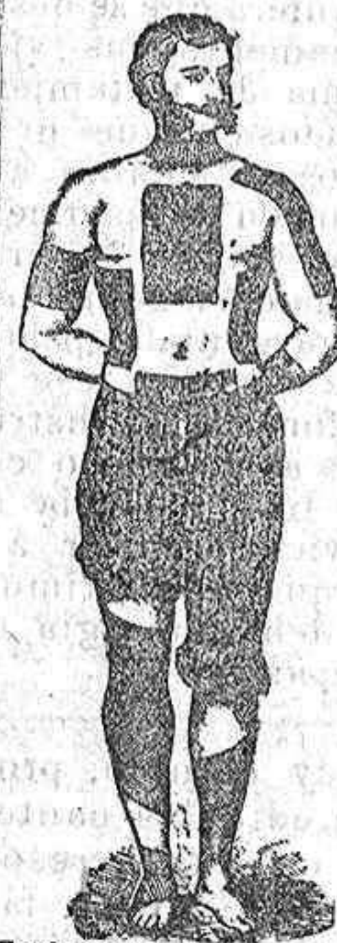
Trade Mark Registered.

PERFORADOS AMERICANOS DE FIELTRO ROJO DEL DOCTO W INTE.