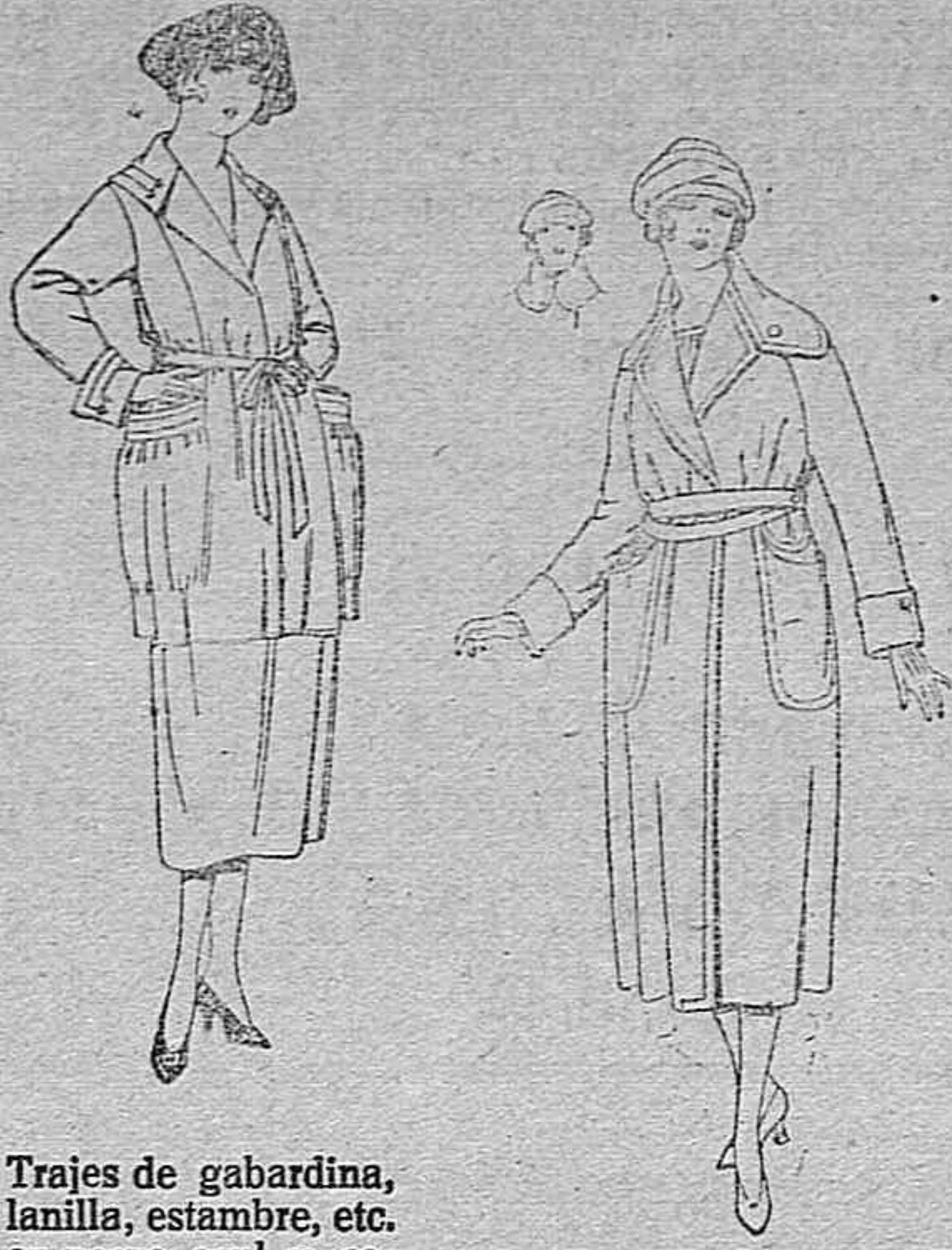
Trajes de gabardina, lanilla, estambre, etc. en negro, azul y color, respuntes de adorno. de ptas. 135 a 160.

Sucursales: Madrid, Barcelona, Alicante, Bilbao, Cádiz, Cartagena, Gijón, Granada, Málaga, Palma de Mallorca, Santander, Sevilla, Valencia, Valladolid y Zaragoza.