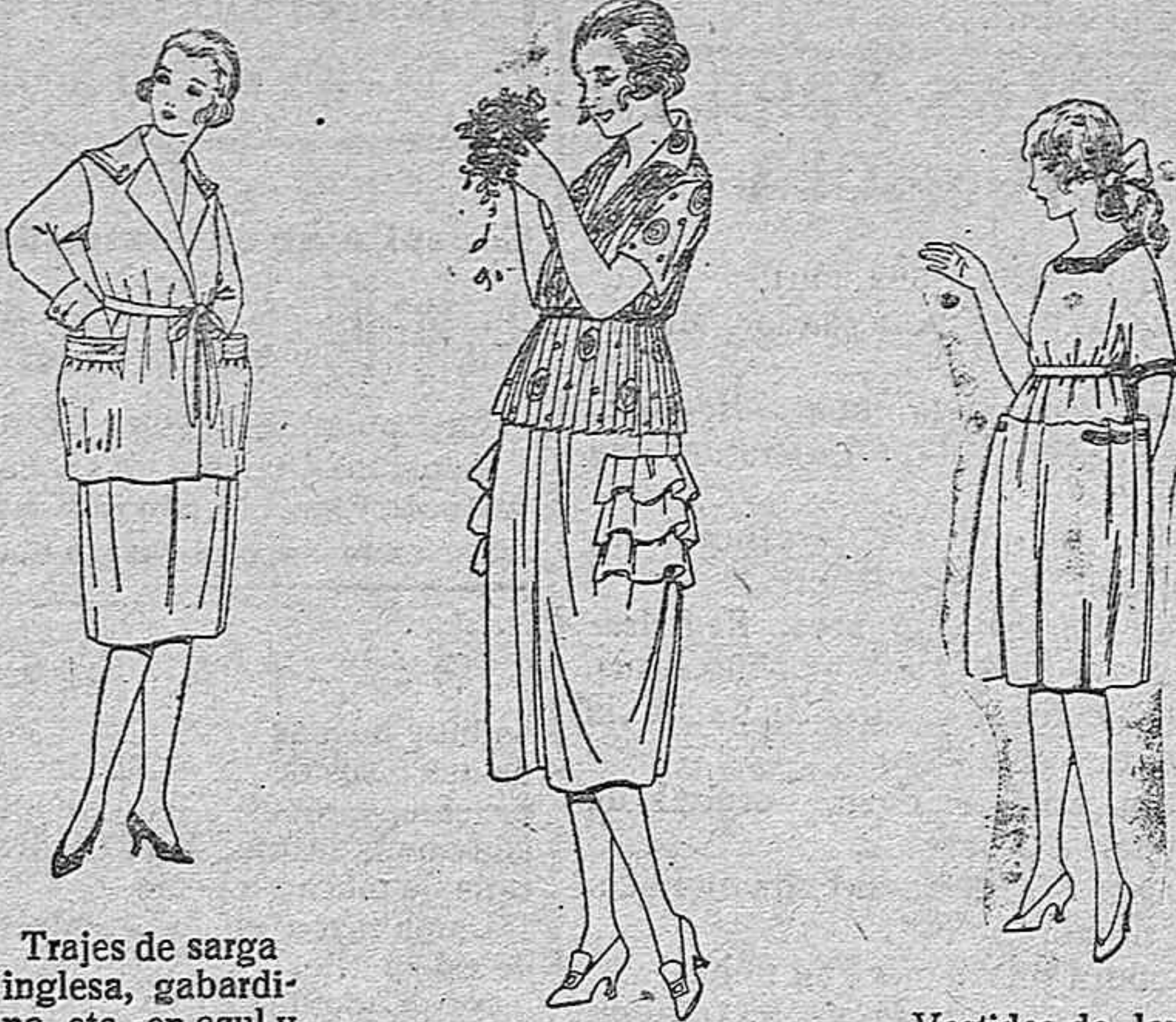
Trajes de sarga inglesa, gabardina, etc., en azul y colores, respuntes adorno, para jovencitas de 12 a 15 años. de ptas. 100 a 120