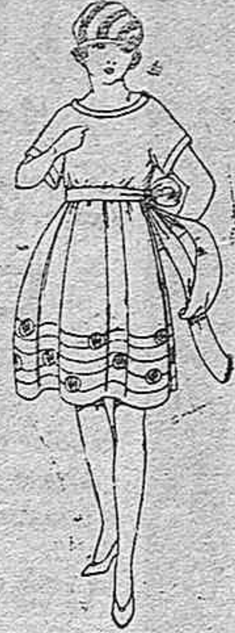
Vestidos de voile blanco y colores, adornos bordados, para jovencitas de 12 a 15 años. de ptas. 45 a 58.

Ropas confeccionadas para Caballero, Señora, Niño y Niña