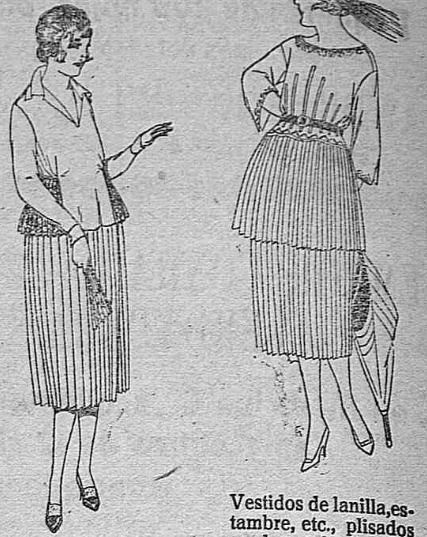
Vestidos de lanilla, estambre, etc., plisados y adornos bordados. de ptas. 120 a 140.