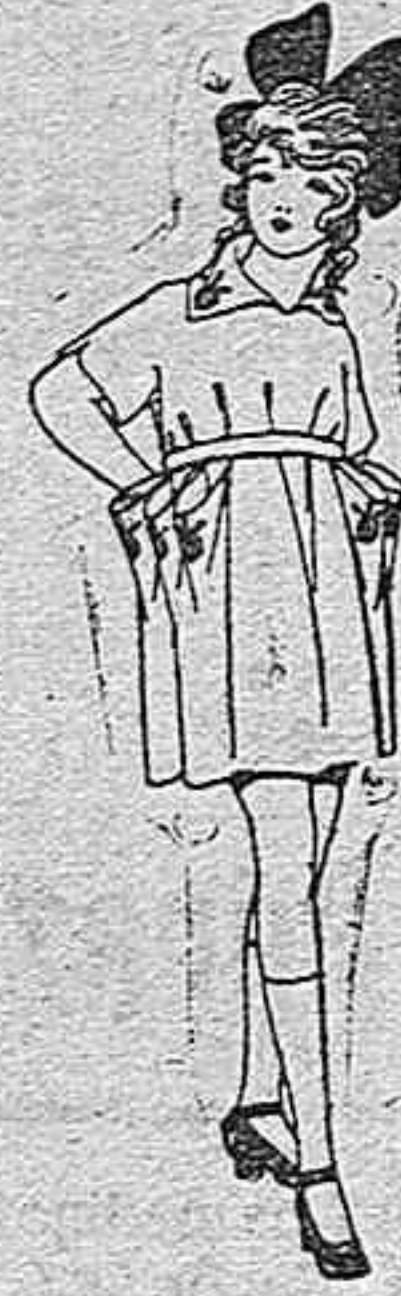
Vestidos de estambre, lanilla, etcétera, adornos bordados, para niñas de 4 a 9 años. de ptas. 38 a 48