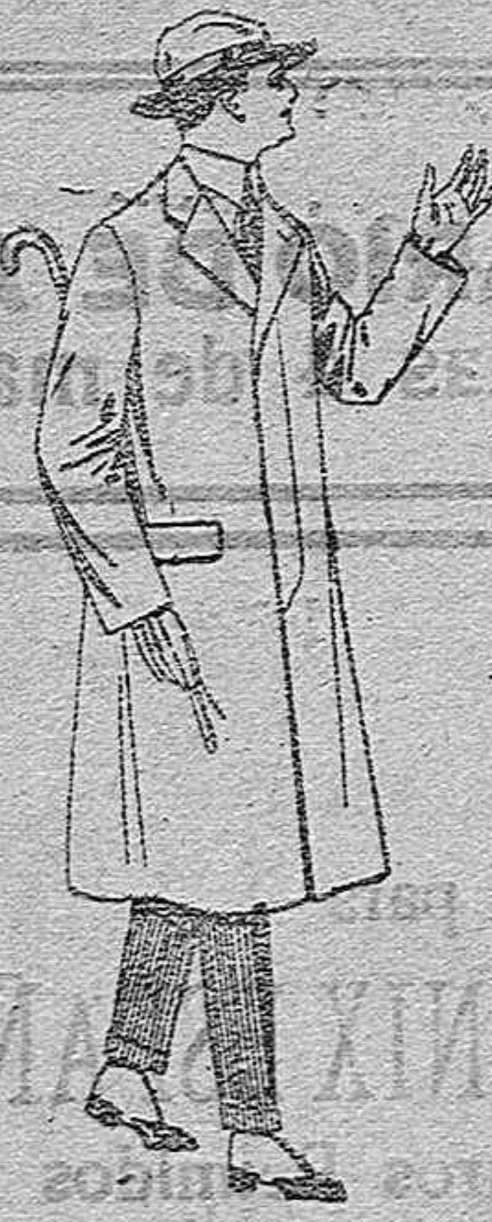
Gabanes de cheviot, melton, etcétera, con forro soda o satén,