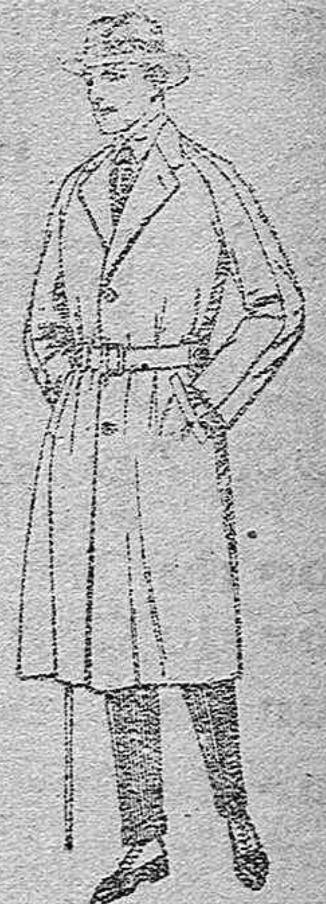
Gabanes de cheviot, esow, melton, gabardina, etc.,