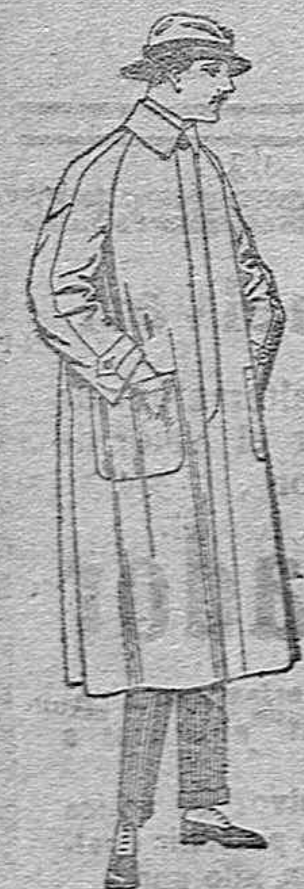
Impermeables forma gabán, raglán,