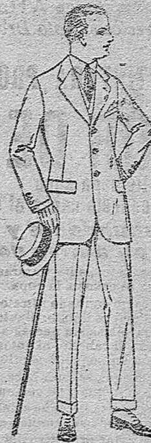
Trajes de lanilla, melton, estambre, vicuña o jerga,