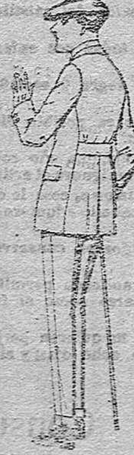
Trajes modelo Sport, de lanilla, melton, etc., para jovencito de 10 a 16 años,