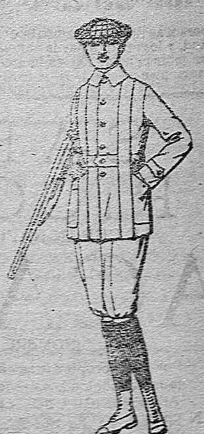
Cazadora de dril crudo o kaki,