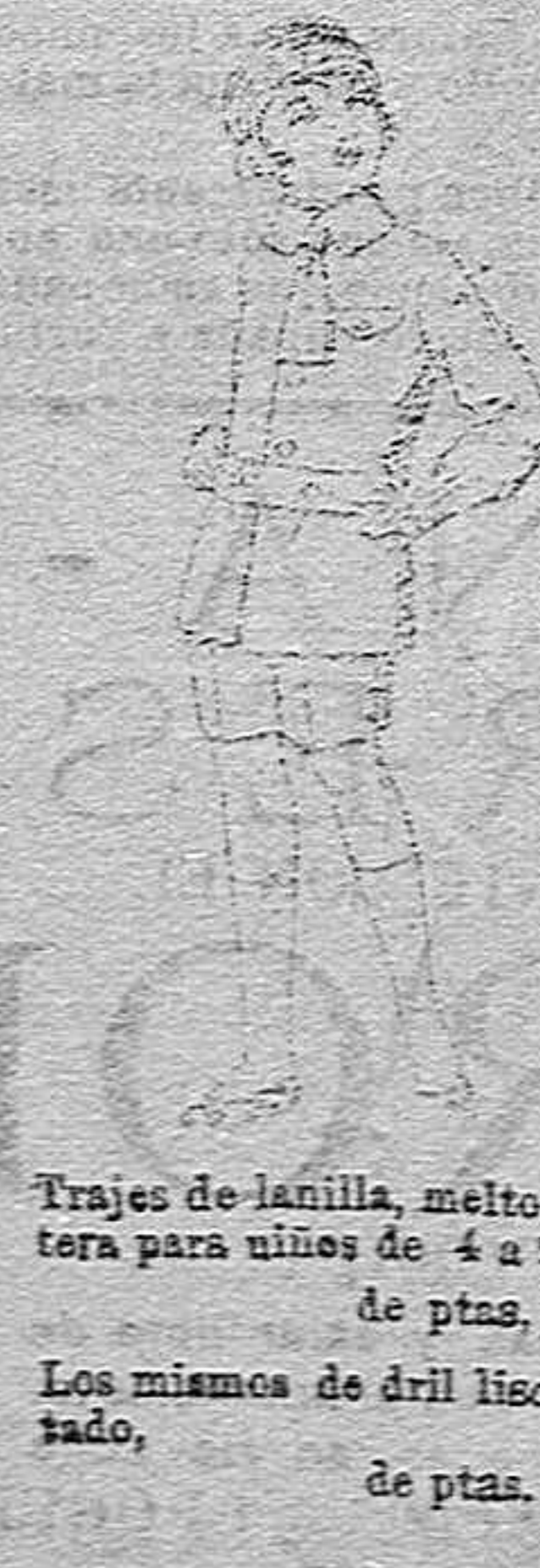
Trajes de lanilla, melton, etcétera para niños de 4 a 9 años,