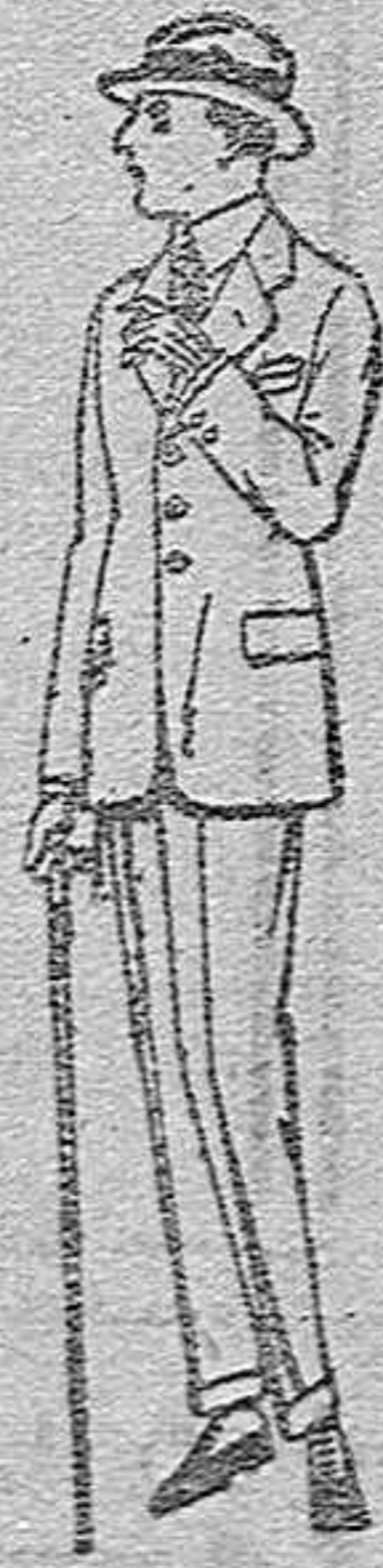
Trajes de lanilla, vicuña o estambre, para jovencitos de 10 a 16 años,