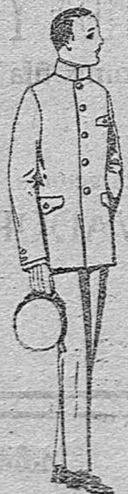
Trajes de vicuña azul o estambre gris, para grooms de 10 a 15 años,