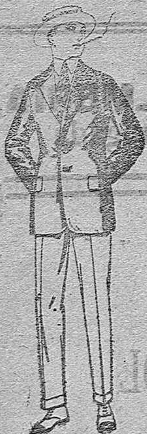
Trajes de alpaca negra o azul,

SUCURSALES: Madrid, Barcelona, Alicante, Bilbao, Cádiz, Cartagena, Gijón, Granada, Málaga, Palma de Mallorca, Santander, Sevilla, Valencia, Valladolid y Zaragoza