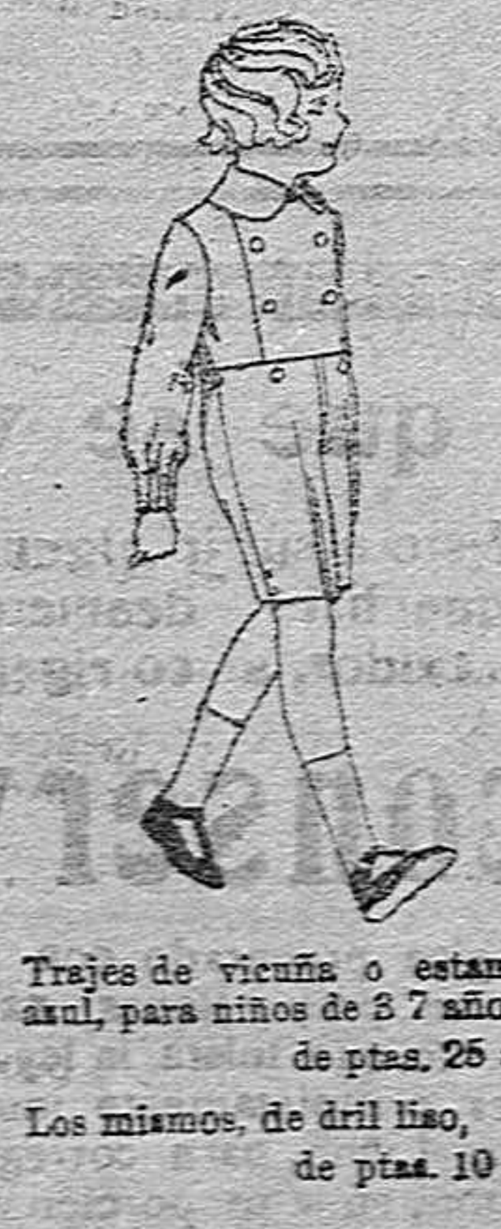
Trajes de vicuña o estambre azul, para niños de 3 a 7 años,