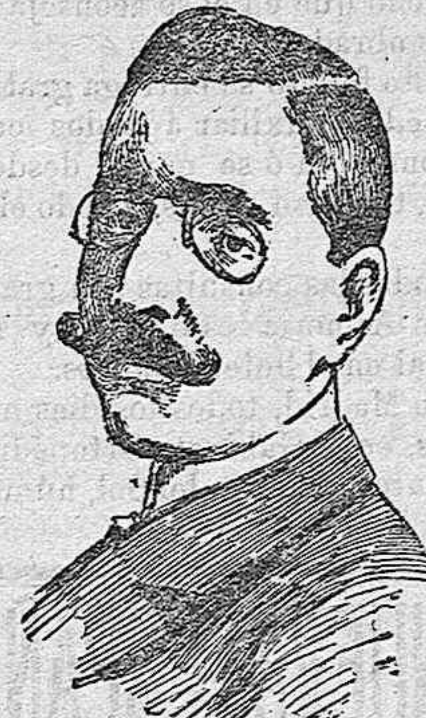
Don Juan Perez Caballero, nuevo ministro de Estado.

Hay que defender el negocio de la uva, parraleros; ¡al mitin del domingo en el teatro de Variedades; á hacer ver al Gobierno que Almería es un pueblo viril que siente entusiasmos por amparar sus intereses!