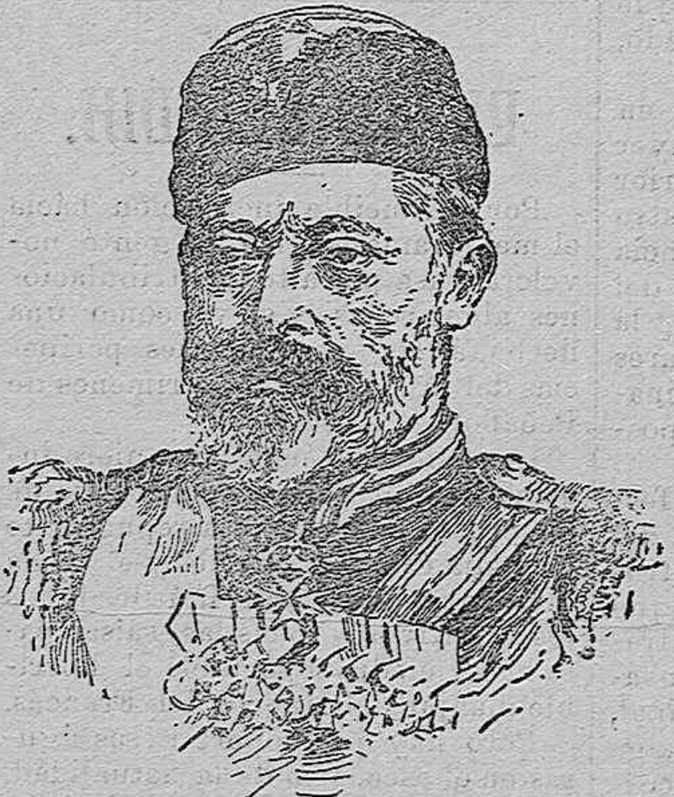
Eduardo VII de Inglaterra,

con uniforme de coronel de la guardia imperial rusa.