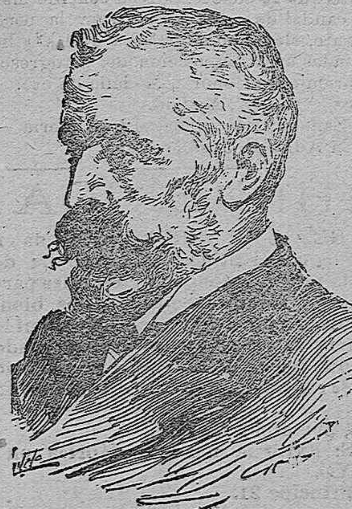
Excmo. Sr. D. Francisco Romero Robledo.