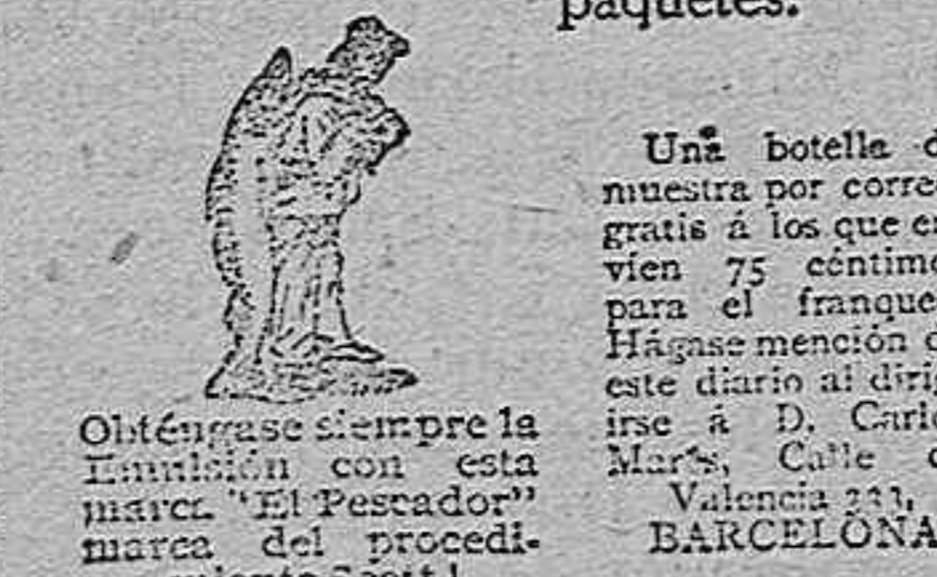
Una botella de nuestra por correo, gratis á los que envían 75 céntimos para el franqueo. Hágame mención de este diario al dirigirse á D. Carlos Marín, Calle de Valencia 111, BARCELONA.

Para todas las enfermedades de los pulmones, de la garganta, de la piel, de la sangre y de los huesos. Es agradable al paladar, digerible, tónico y nutritivo. El fortalecedor más seguro y activo. Véase el prospecto con un gran bacalao á costas, en todos los paquetes.