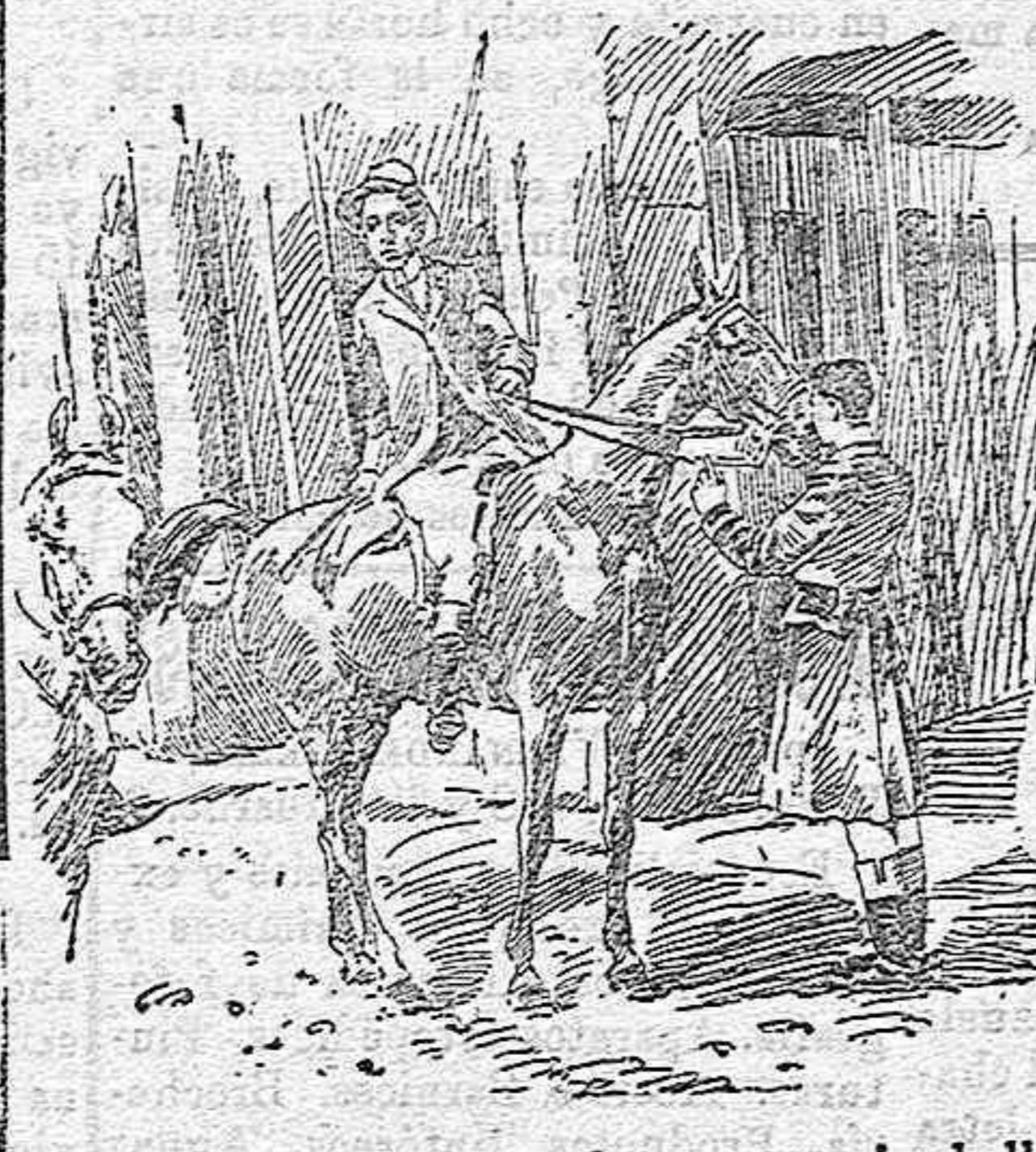
El rey preparándose para dar un paseo á caballo