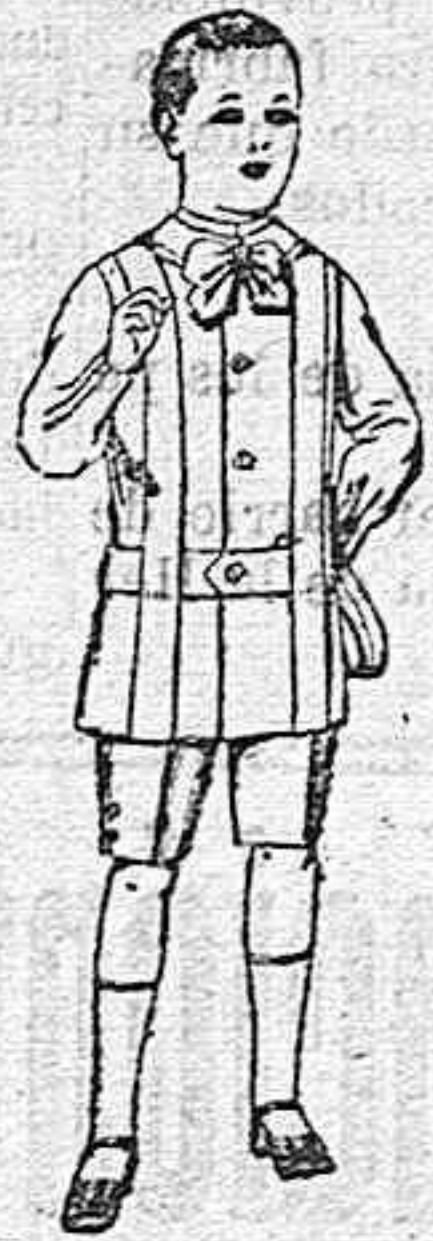
Trajes de lanilla, melton, etc. para niños de 4 á 7 años De ptas. 16 á 33.