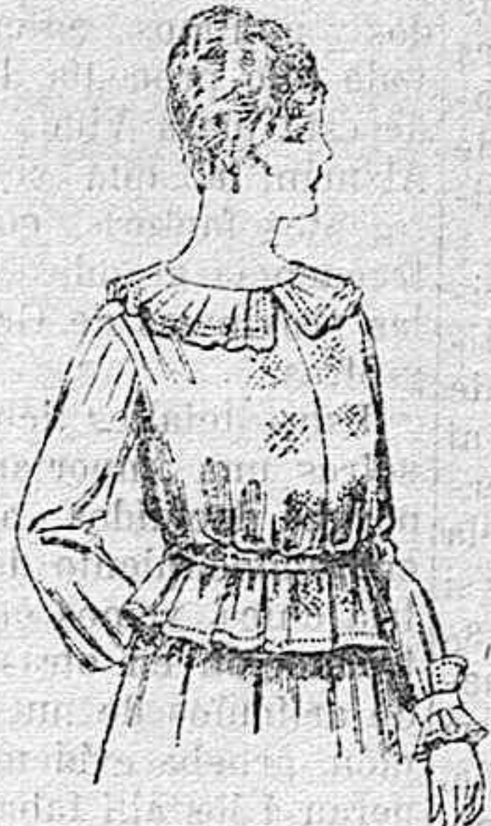
Blusa de crepón ó seda, en negro, azul y color. A ptas. 33.