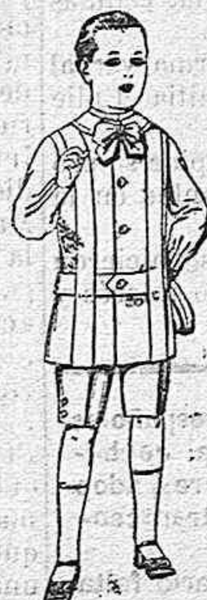
Trajes de lanilla, melton, etc. para niños de 4 á 7 años De ptas. 16 á 33.