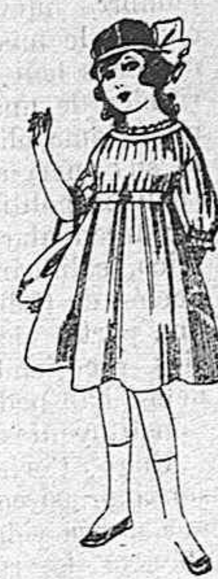
Vestidos de lana, azul, para niñas de 4 á 9 años De pesetas 22 á 25 Los mismos en voile. De pesetas 10 á 17