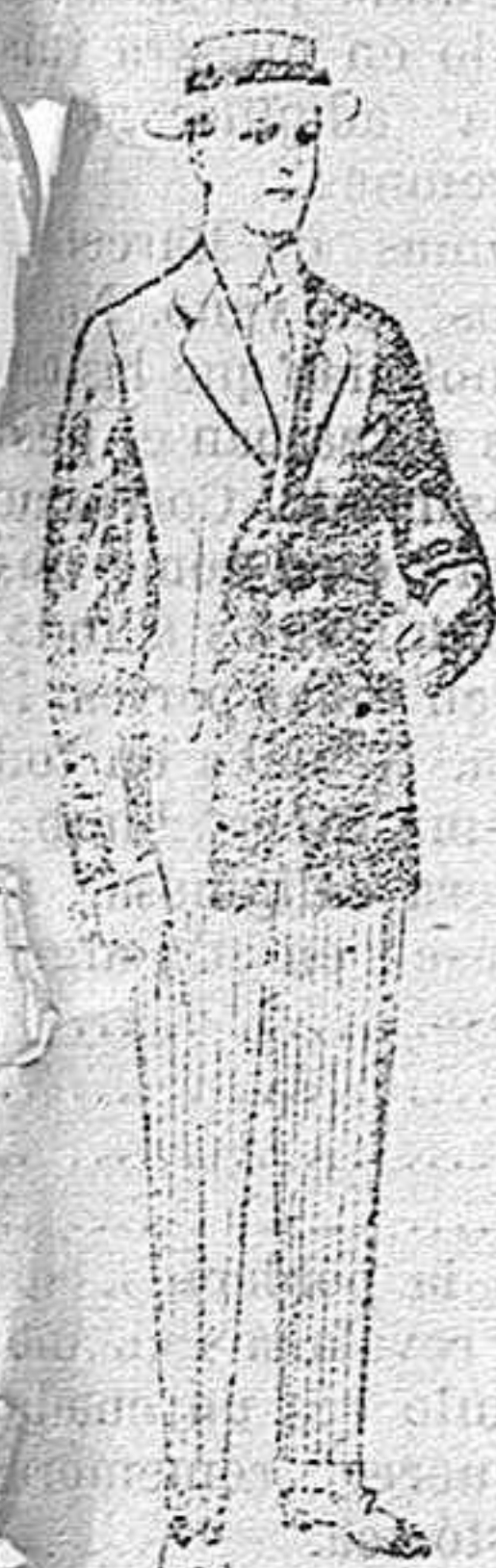
Trajes de lanilla, vicuña, etc., para jovencitos de 10 á 16 años. De pesetas 10 á 56