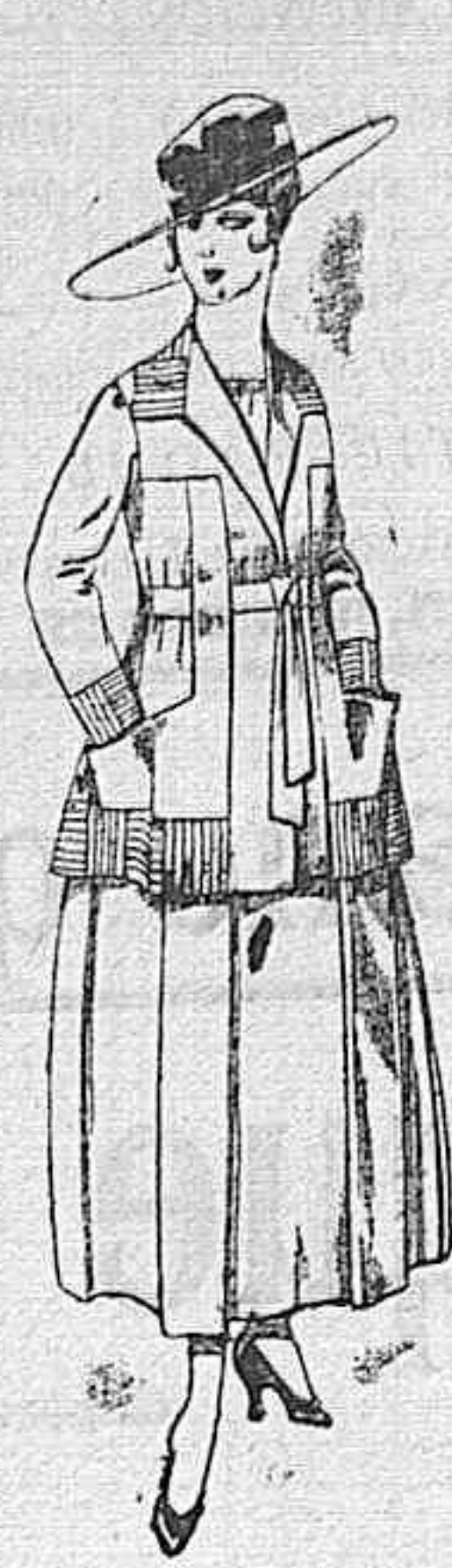
Trajes de lanilla negro, azul, y color, bordado, á pesetas 90.