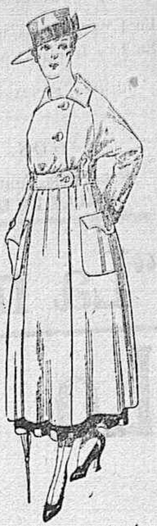
Vestido de estambre negro, azul y colores bordado De peseta 64 á 75