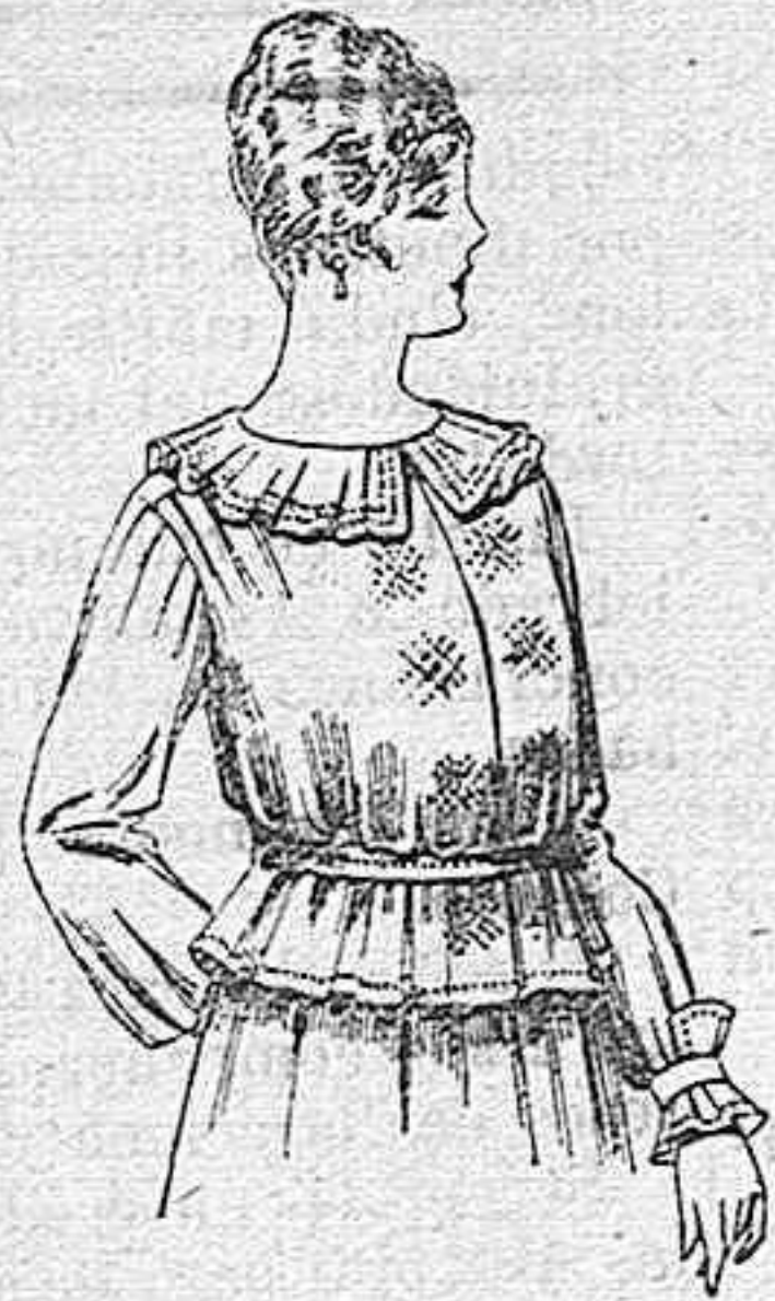
Blusa de crespón ó seda, en negro, azul y color. A ptas. 33.

Camisería, Gneros de punto, Corbatería, Guantería, Sombrería, Zapatería, Paraguas, Bastones y Artículos de Viaje.