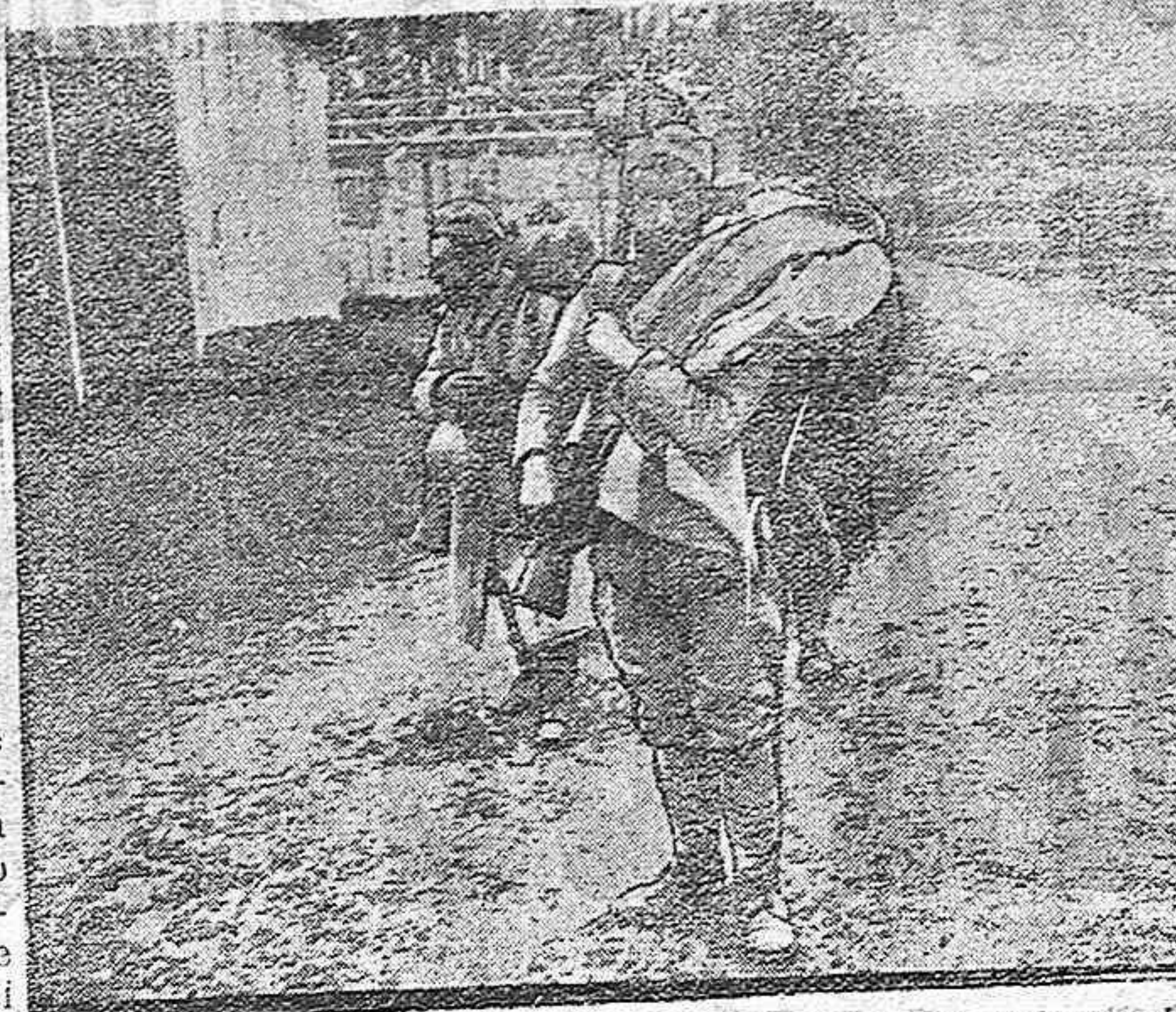
Un "pollu" regresando a su puesto después de una licencia.