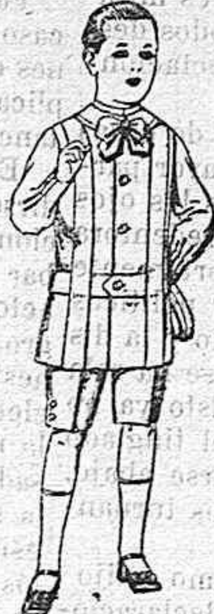
Trajes de lanilla, melton, etc. para niños de 4 á 7 años De ptas. 16 á 33.