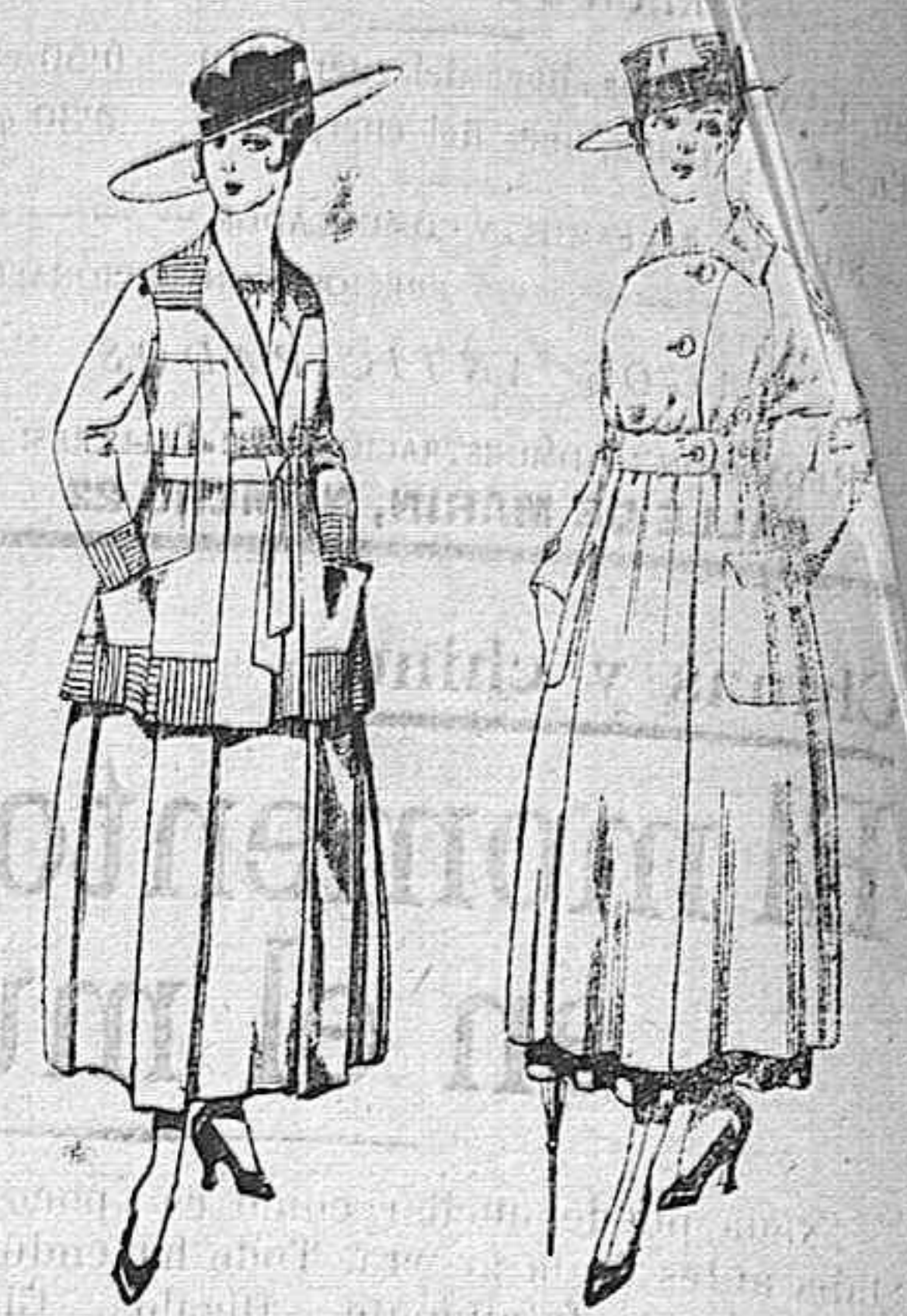
Trajes de lanilla negro, azul, y color, bordado, á pesetas 90. Vestido de estambre negro, azul y colores bordado De peseta 64 á 75