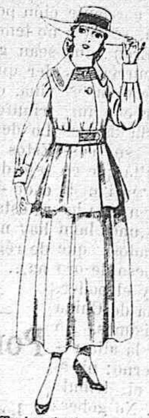
Trajes de lanilla negra, azul y color, para jovencitas de 13 á 16 años.