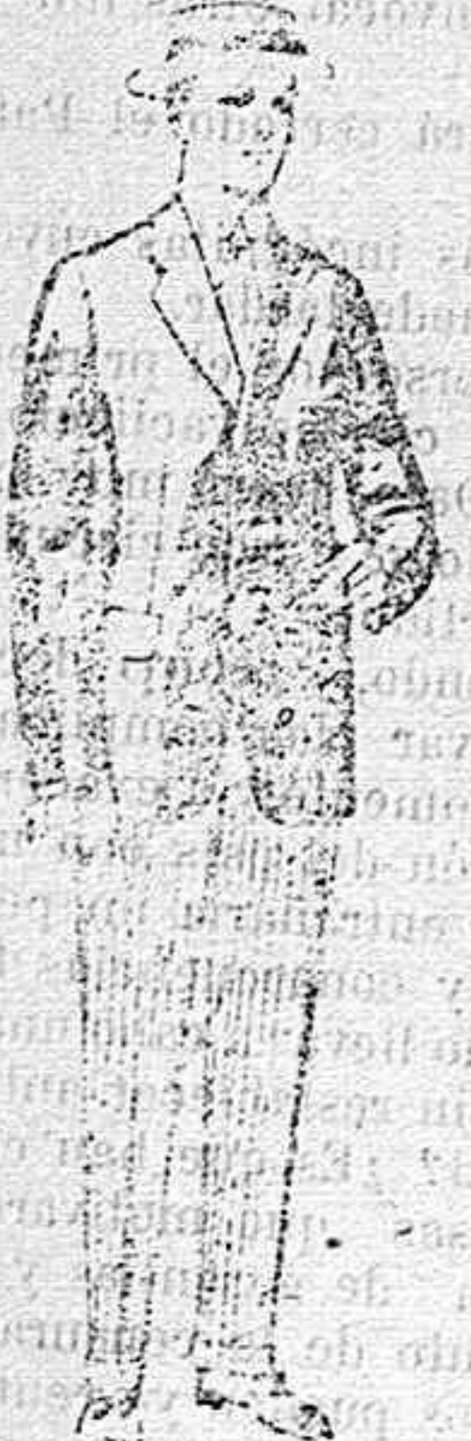
Trajes de lanilla, vicuña, etc., para jovencitos de 10 á 16 años. De pesetas 10 á 56