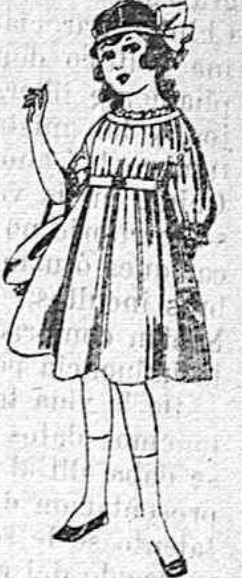
Vestidos de lana, azul, para niñas de 4 á 9 años De pesetas 22 á 25 Los mismos en voile. De pesetas 10 á 17