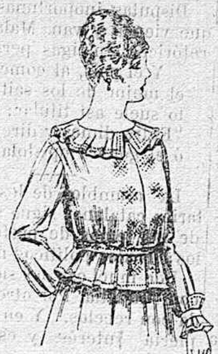
Blusa de crespón ó seda, en negro, azul y color. A ptas. 33.