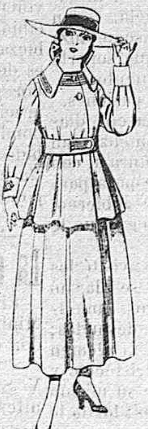
Trajes de lanilla negra, azul y color, para jovencitas de 13 á 16 años.