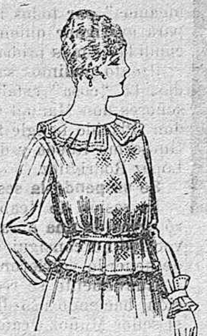
Blusa de crespón ó seda, en negro, azul y color. A ptas. 33.