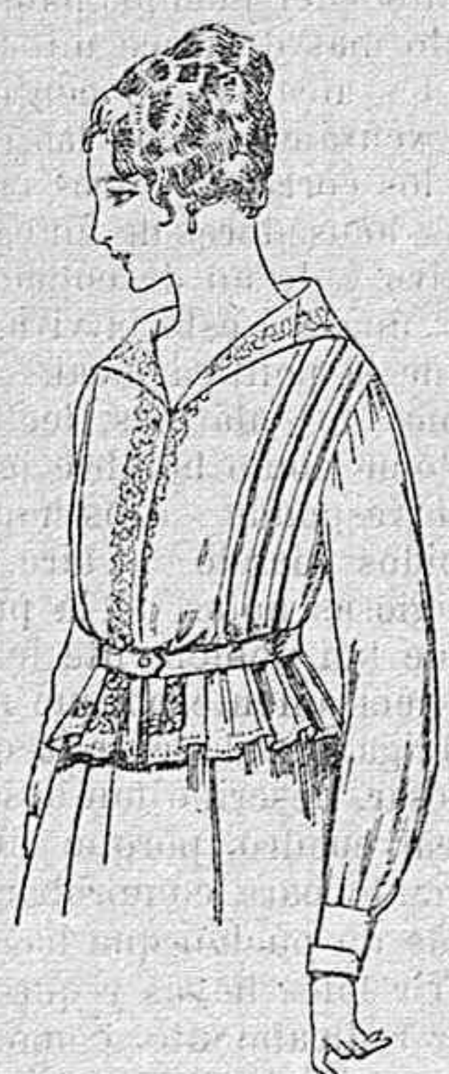
Blusa de voile blanco, bordados blancos, rosa ó azul A ptas. 9