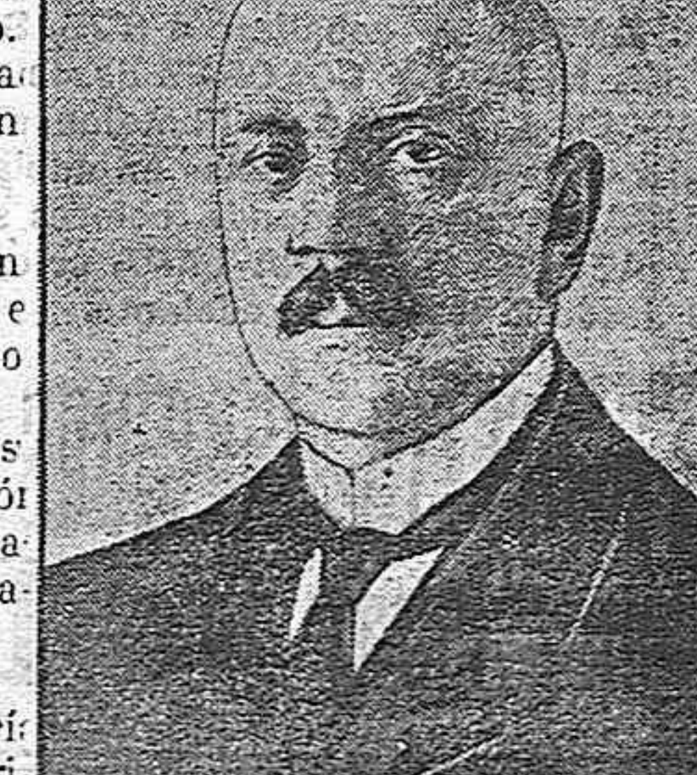
Sharp, embajador de los Estados Unidos en Francia.