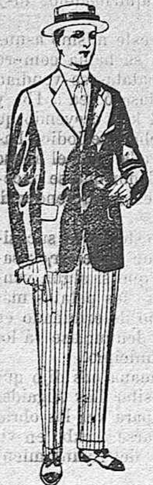
Trajes de lanilla, vicuña, etc., para jovencitos de 10 á 16 años. De pesetas 10 á 56