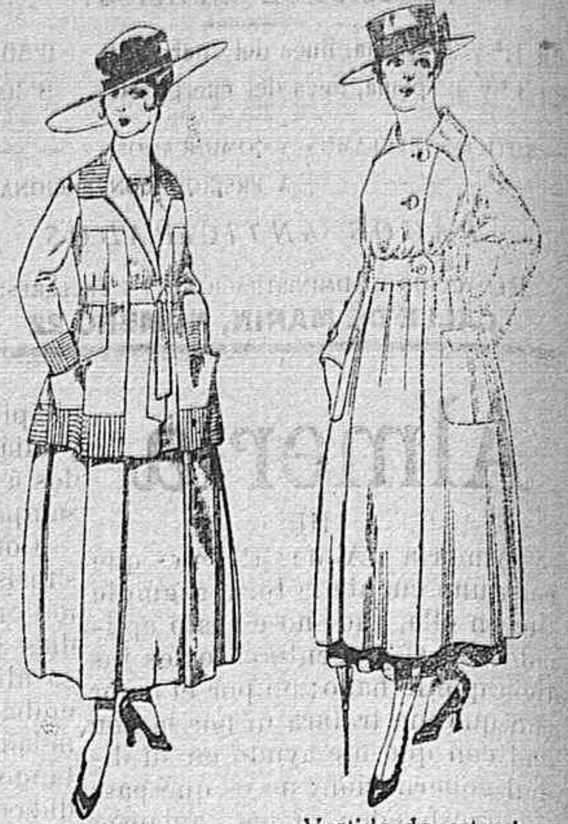
Trajes de lanilla negro, azul, y color, bordado, á pesetas 90. Vestido de estambre negro, azul y colores bordado De peseta 64 á 75