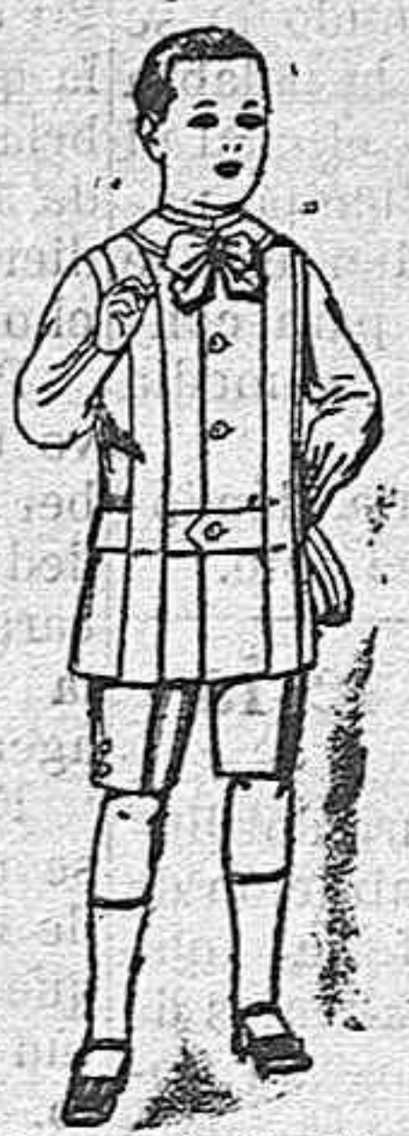
Trajes de lanilla, melton, etc. para niños de 4 á 7 años De ptas. 16 á 33.