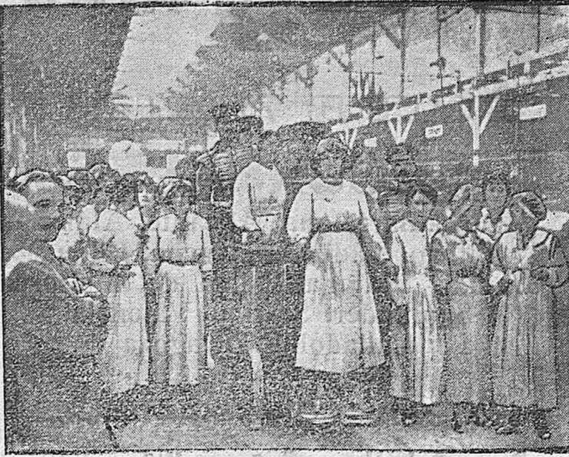
La banda de la guardia real inglesa en una fábrica de municiones de París.