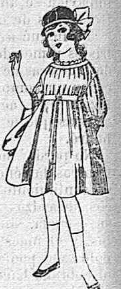
Vestidos de lana, azul, para niñas de 4 á 9 años De pesetas 22 á 25 Los mismos en voile. De pesetas 10 á 17

Juan Criado González ARMERO Expenduría de explosivos y armas de caza.—Plaza de Nicolás Salmerón, número CRISTALERIA ROLDAN Plaza de Nicolás Salmerón, 6 dupdo. Cristales planos, imprimé y muselina. Se piden cristales á domicilio