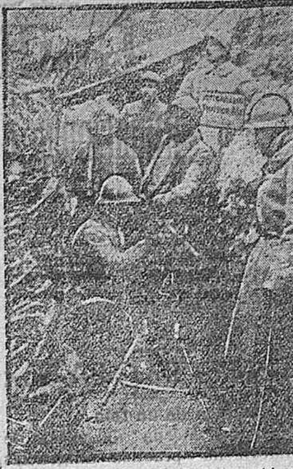
En las trincheras. — Limpiando ametralladoras.

do, lista y despacho del jefe de cartaría.