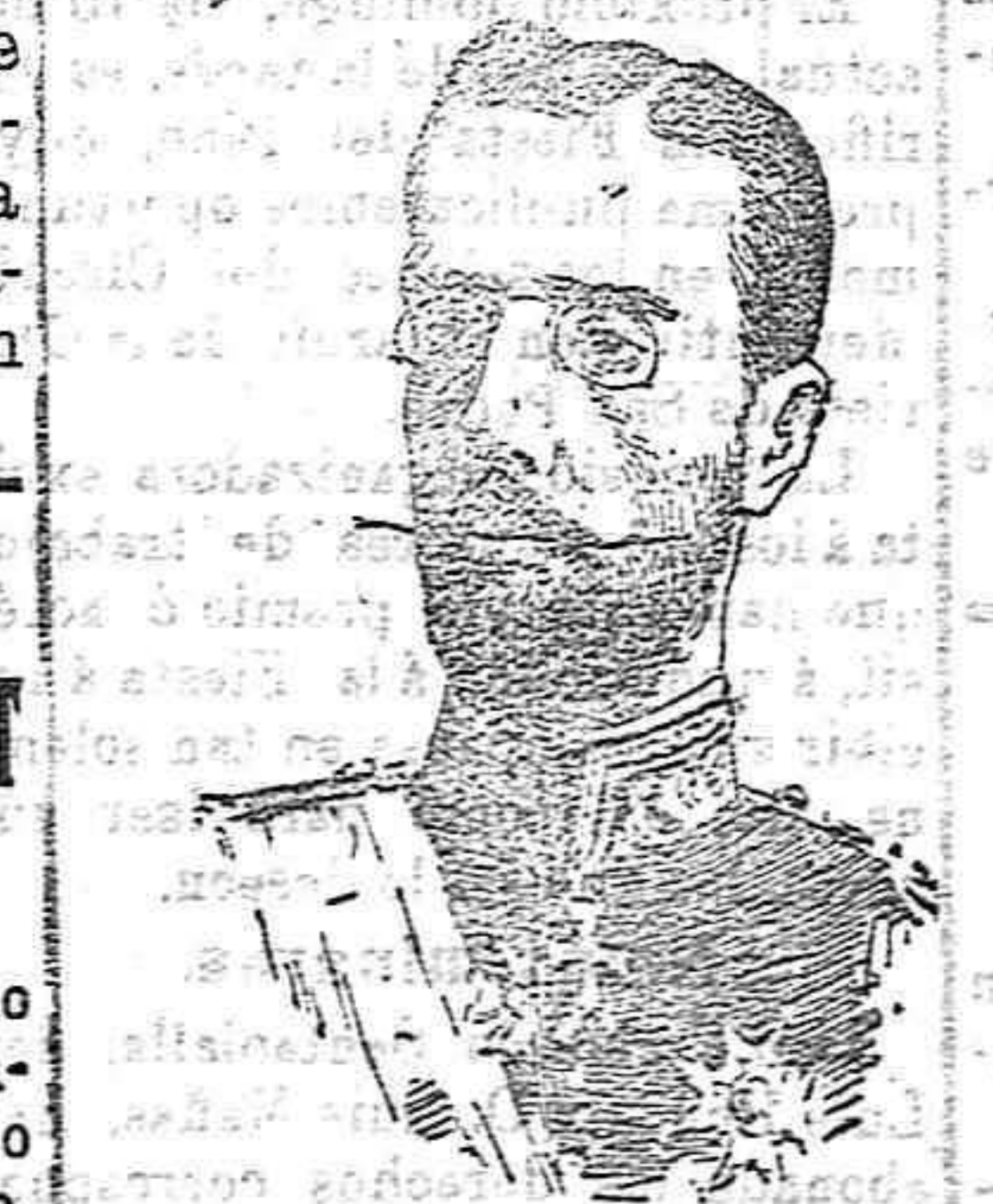
EL PRINCIPE OSCAR GUSTAVO ADOLFO HEREDERO DEL TRONO DE SUECIA

¿Y qué más cabe de que á nadie se le pueda ocurrir, en un momento de esta naturaleza, para el futuro que pueda inspirar al Gobernador civil de la pro-