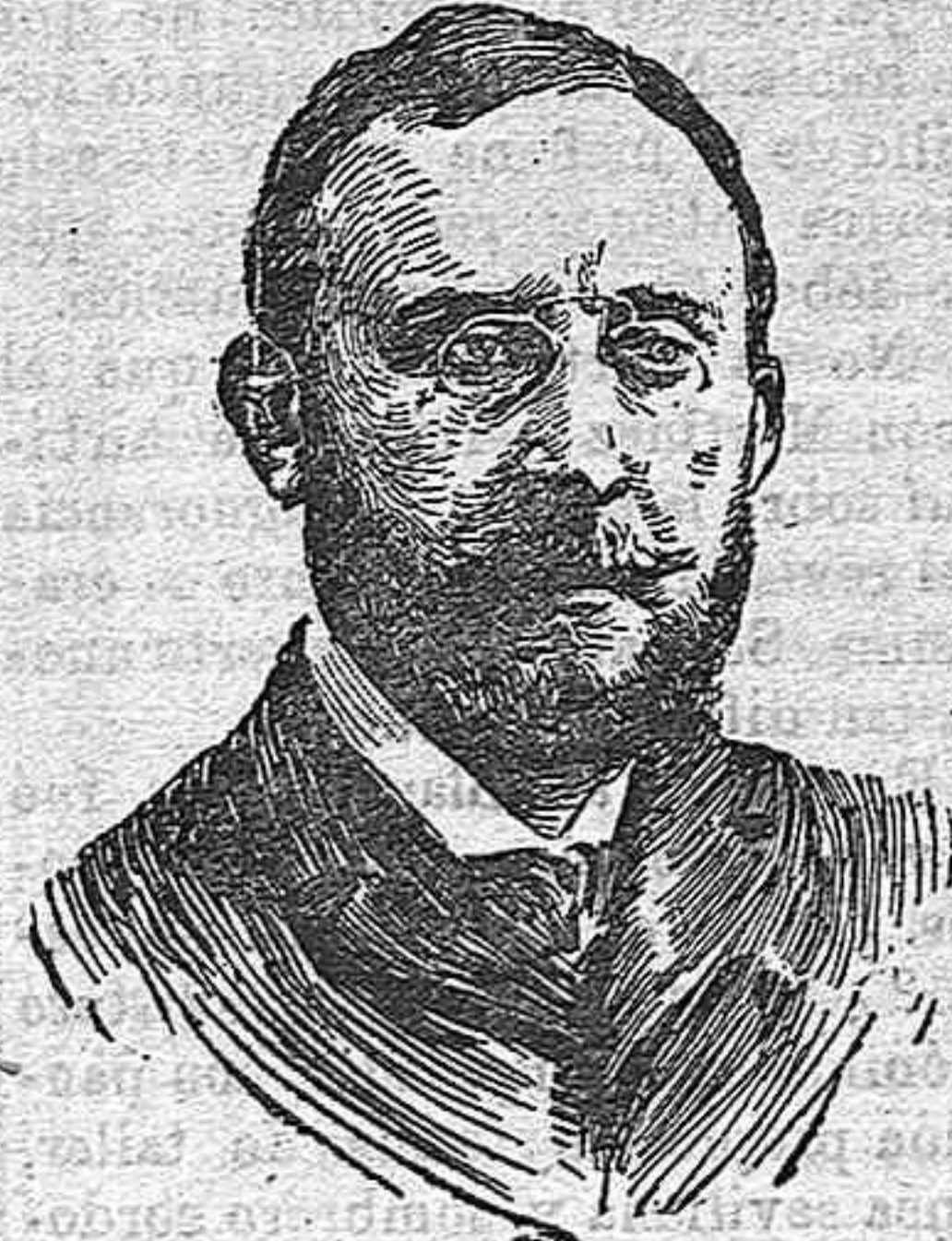
Sr. MARQUÉS DE FIGUEROA, MINISTRO DE GRACIA Y JUSTICIA.

El marqués de Figueroa, como ministro de Gracia y Justicia, observando sobre su pecho el gran