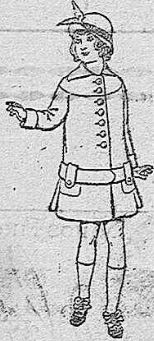
Abrigos de patén para niñas de 4 a 12 años. De pesetas 15 a 25.