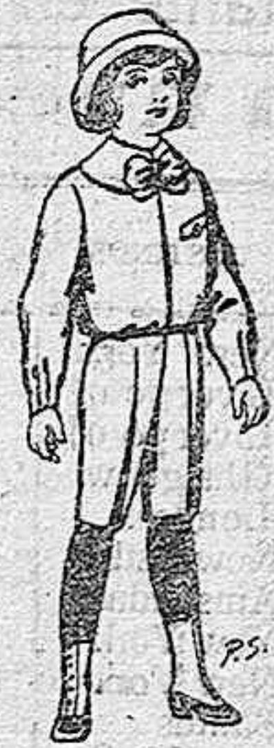
Trajes de patén para niños de 4 a 9 años. De pts. 5 a 7-50