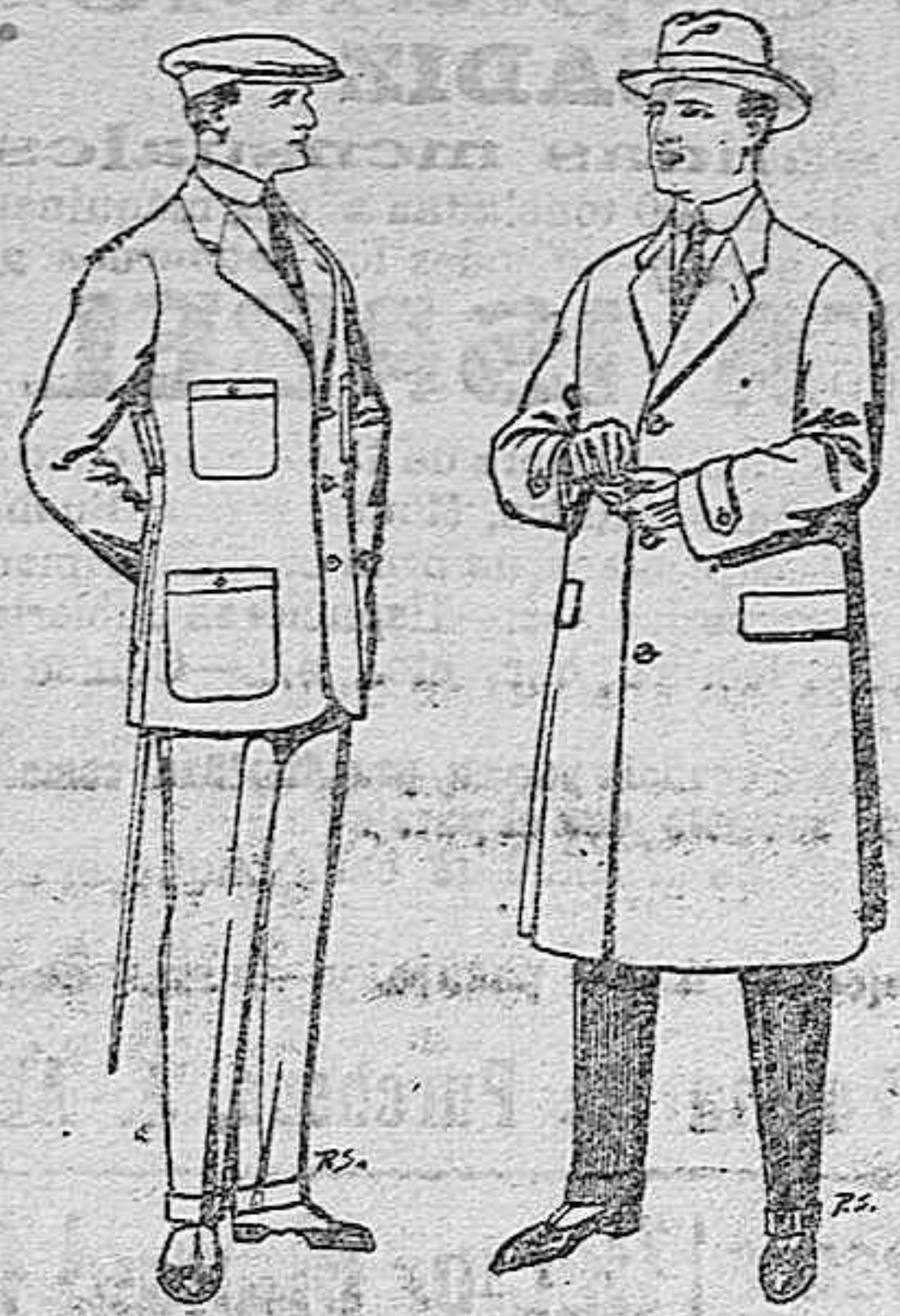
Trajes de cheviot cor- te elegante para "Sportman". De pesetas 35 a 50.