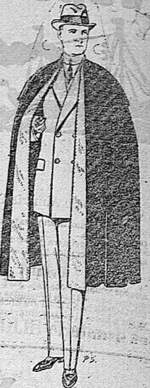
Capas (entenas) de paño. De pesetas 25 a 100.