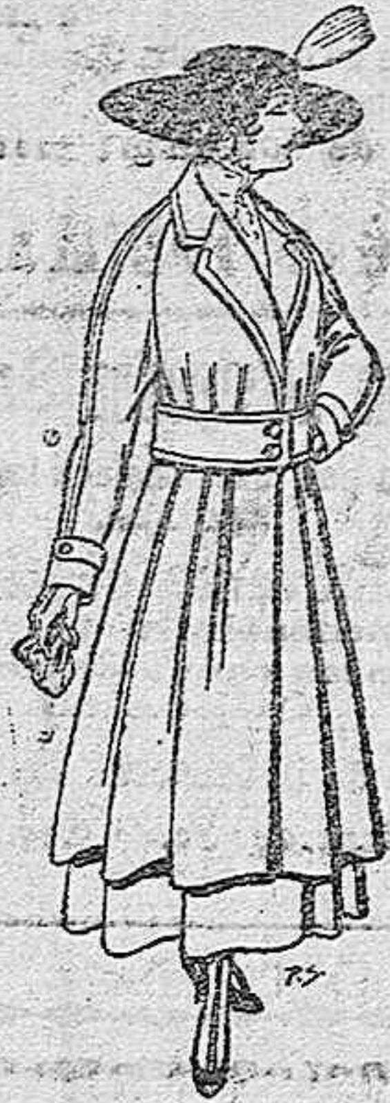
Abrigos de patén gran novedad, para señora. Apts. 53.