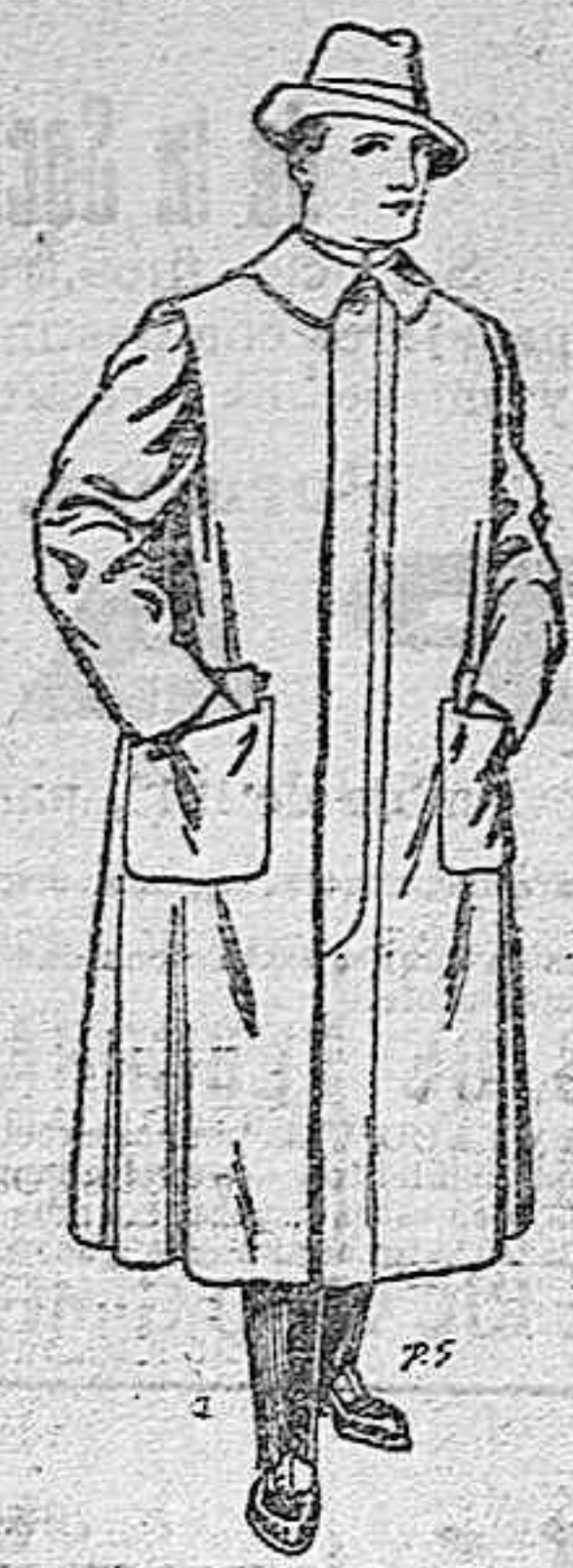
Impermeables para gabán en color verde o gris. De pesetas 35 a 100.