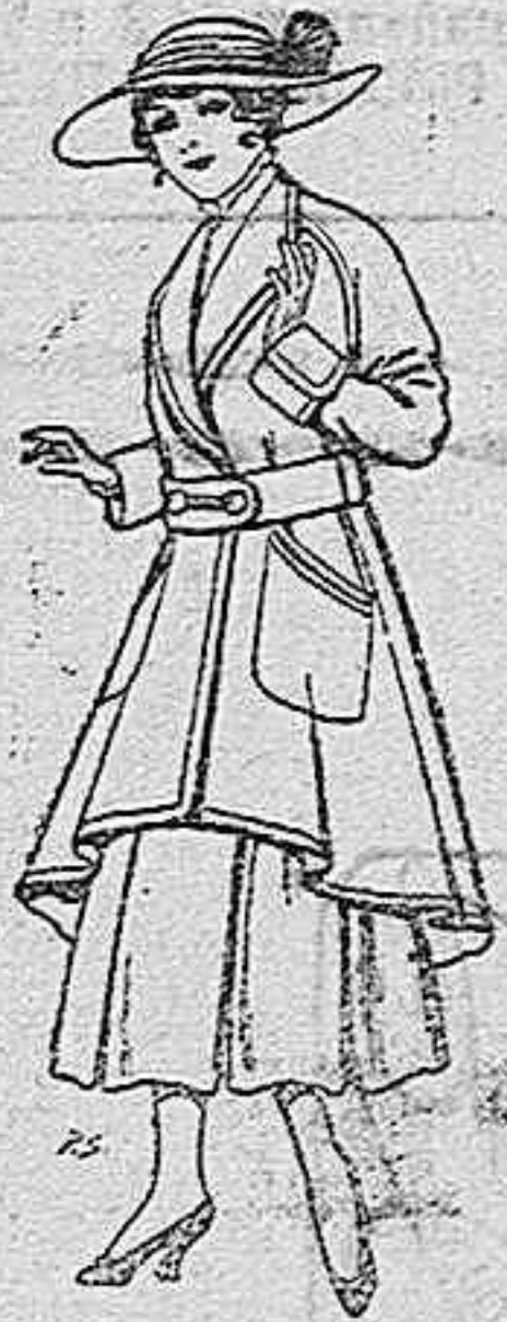
Abrigos de patén para jovencitas de 13 a 16 años. De pesetas 25 a 35.