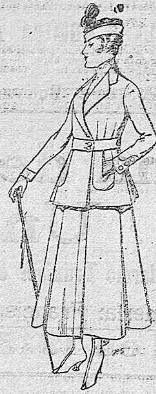
Trajes de lana negra, azul y color, para señora. A pesetas 65.