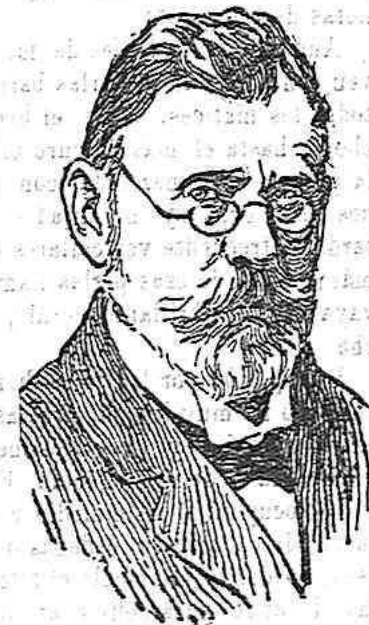
El Dr. Ehrlich.

Las más eminentes autoridades en Medicina, estudian, ensayan y discuten el descubrimiento del sabio profesor alemán, prestándole toda la atención que merece; pues no en balde se trata de un producto para combatir y curar la más traidora y cruel de las enfermedades que son azote del género humano, la avariosis, que como bien sabemos es temida hasta hoy como incurable, y que por ser hereditaria es causa de inevitable degeneración de la especie.