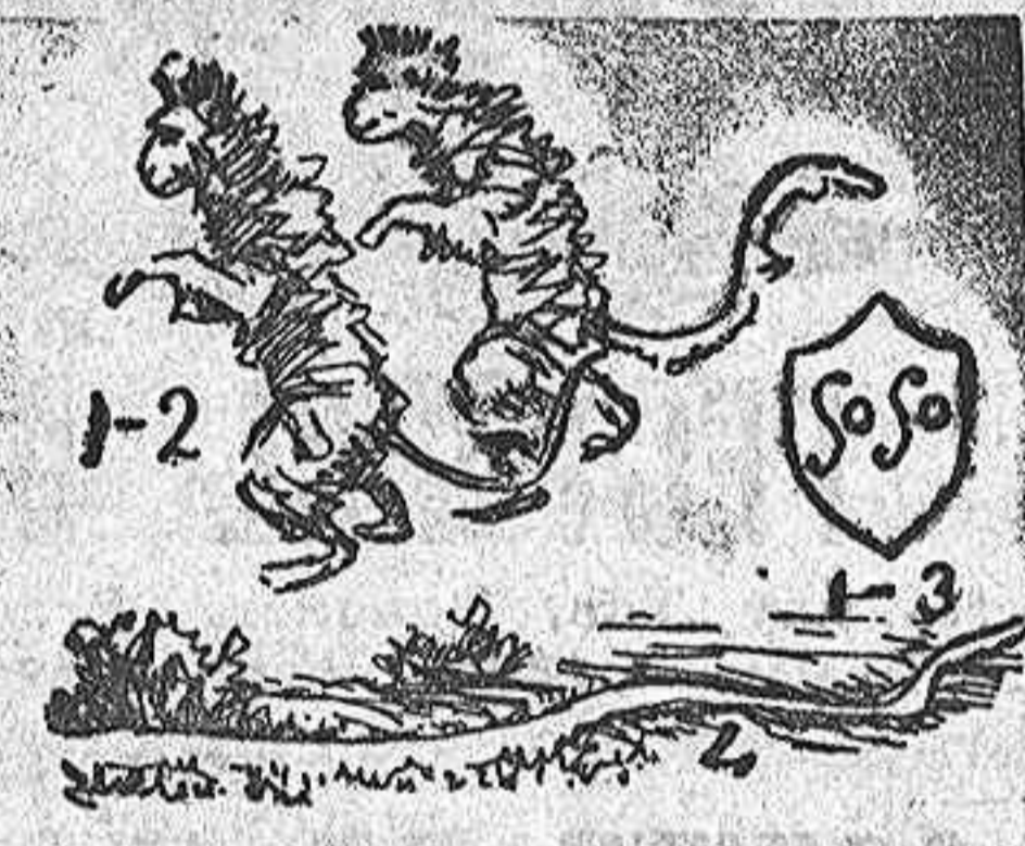
La solución mañana.