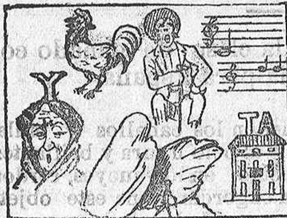
La solución mañana.